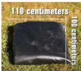
'ਸੁਕਾਉਣ ਵਾਲਾ ਢਾਂਚਾ' ਇੱਕ ਛੋਟੇ ਜਿਹੇ ਰੂਪ ਵਿੱਚ ਤਹਿ ਹੋ ਜਾਂਦਾ ਹੈ ਅਤੇ ਮੁੜ-ਸਥਾਪਨਾ ਵਾਸਤੇ ਇਸਨੂੰ ਆਸਾਨੀ ਨਾਲ ਕਿਸੇ ਹੋਰ ਸਥਾਨ 'ਤੇ ਲਿਜਾਇਆ ਜਾ ਸਕਦਾ ਹੈ

2425 ਵਿੱਚ, ਲਗਭਗ 450 ਕਿਲੋ ਅਨਾਜ, ਅਤੇ 2450 ਵਿੱਚ, 900 ਕਿਲੋ ਅਨਾਜ ਨੂੰ ਸੁਕਾਇਆ ਜਾ ਸਕਦਾ ਹੈ। ਅਨਾਜ ਦੀ ਸਹੀ ਮਾਤਰਾ ਇਸ ਦੀ ਥੋਕ ਘਣਤਾ ਤੇ ਨਿਰਭਰ ਕਰਦੀ ਹੈ। ਸਾਰਾ ਸਿਸਟਮ ਪੋਰਟੇਬਲ ਹੈ ਅਤੇ ਇਸੇ ਥਾਂ ਨੂੰ ਆਸਾਨੀ ਨਾਲ ਤਬਦੀਲ