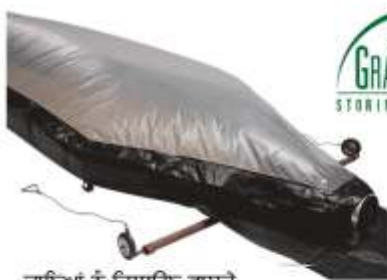
ਦਾਇਆਂ ਨੂੰ ਹਿਲਾਉਣ ਵਾਸਤੇ ਆਸਾਨ ਔਜ਼ਾਰ

ਪੱਖਾ ਸੋਲਰ ਬਬਲ ਡ੍ਰਾਇਅਰ ਦਾ ਇੱਕ ਮਹੱਤਵਪੂਰਨ ਭਾਗ ਹੈ। ਇਸ ਨੂੰ ਸੋਲਰ ਪੈਨਲ ਜਾਂ ਬੈਟਰੀ ਨਾਲ ਚਲਾਇਆ ਜਾ ਸਕਦਾ ਹੈ।