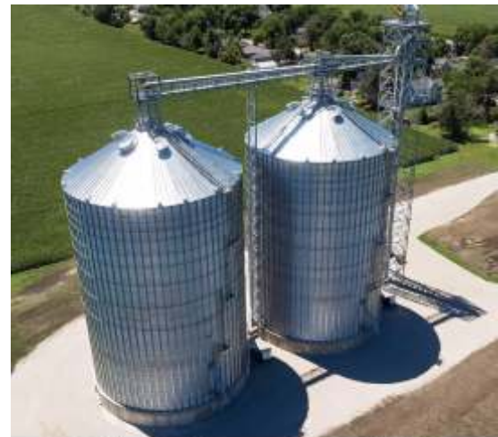
ਉਦਯੋਗਿਕ-ਪੈਮਾਨੇ ਦੇ ਅਨਾਜ ਸੁਕਾਉਣ ਵਾਲੇ ਸੈਂਟਰਾਂ

ਕਰੋੜਾਂ ਟਨ ਕਣਕ, ਮੱਕੀ, ਸੋਇਆਬੀਨ, ਚੌਲ ਅਤੇ ਹੋਰ ਅਨਾਜ ਜਿਵੇਂ ਕਿ ਸੋਰਘਮ, ਸੂਰਜਮੁਖੀ ਦੇ ਬੀਜ, ਰੇਪਸੀਡ/ਕਨੋਲਾ, ਜੌਂ, ਜਵੀ ਆਦਿ ਨੂੰ ਅਨਾਜ ਸੁਕਾਉਣ ਵਾਲੇ ਮਸ਼ੀਨਾਂ ਵਿੱਚ ਸੁਕਾਇਆ ਜਾਂਦਾ ਹੈ। ਮੁੱਖ ਖੇਤੀਬਾੜੀ ਦੇਸ਼ਾਂ ਵਿੱਚ, ਸੁਕਾਉਣ ਵਿੱਚ ਅਨਾਜ ਦੇ ਆਧਾਰ 'ਤੇ, ਲਗਭਗ 17-30% ਤੋਂ 8-15% ਦੇ ਮੁੱਲਾਂ ਤੱਕ ਨਮੀ (Moisture) ਦੀ ਕਮੀ ਸ਼ਾਮਲ ਹੁੰਦੀ ਹੈ। ਅਨਾਜ ਅਕਸਰ 14% ਤੱਕ ਸੁੱਕ ਜਾਂਦੇ ਹਨ, ਜਦੋਂ ਕਿ ਤੇਲ ਬੀਜਾਂ ਨੂੰ 12.5% (ਸੋਇਆਬੀਨ), 8% (ਸੂਰਜਮੁਖੀ) ਅਤੇ 9% (ਮੂੰਗਫਲੀ) ਤੱਕ ਸੁਕਾਇਆ ਜਾਂਦਾ ਹੈ। ਫਸਲ ਦੀ ਗੁਣਵੱਤਾ ਨੂੰ ਸੁਰੱਖਿਅਤ ਰੱਖਣ ਲਈ ਸੁਕਾਉਣਾ ਮਹੱਤਵਪੂਰਨ ਪਹਿਲਾ ਕਦਮ ਹੈ। ਫਸਲਾਂ ਨੂੰ ਸਹੀ ਨਮੀ ਦੀ ਮਾਤਰਾ (Moisture Content) ਵਿੱਚ ਵਾਢੀ ਤੋਂ ਬਾਅਦ ਤੁਰੰਤ ਸੁਕਾਉਣਾ ਇੱਕ ਪ੍ਰਭਾਵਸ਼ਾਲੀ ਅਭਿਆਸ ਹੈ, ਜੋ ਉੱਲੀ ਦੇ ਵਾਧੇ ਅਤੇ ਸੰਕਰਮਣ ਨੂੰ ਘੱਟ ਕਰਦਾ ਹੈ।