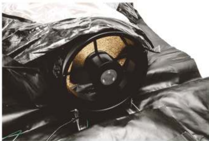
ਸੋਲਰ ਬਬਲ ਡ੍ਰਾਇਅਰ ਦੇ ਪੱਖੇ ਨੂੰ ਸੋਲਰ ਪੈਨਲ ਜਾਂ ਬੈਟਰੀ ਨਾਲ ਚਲਾਇਆ ਜਾ ਸਕਦਾ ਹੈ।

ਅਤੇ ਬੀਜਾਂ ਨੂੰ 1% ਨਮੀ ਦੀ ਮਾਤਰਾ Moisture Content ਪ੍ਰਤੀ ਦੇ ਘੰਟੇ ਦੀ ਔਸਤ ਸੁਕਾਉਣ ਦੀ ਦਰ (ਚਾਵਲ ਅਤੇ ਮੱਕੀ 'ਤੇ ਆਧਾਰਿਤ) 'ਤੇ ਸੁਕਾ ਸਕਦਾ ਹੈ। ਇਸਦਾ ਪਾਰਦਰਸ਼ੀ, UV- ਅਤੇ ਪਾਣੀ-ਰੋਧਕ ਪੋਲੀਥੀਨ (LDPE) Bubble Dryer ਨੂੰ ਗਰਮ ਕਰਨ ਲਈ ਸੂਰਜੀ ਰੇਡੀਏਸ਼ਨ ਨੂੰ ਢੱਕਦਾ ਹੈ। ਨਮੀ ਨੂੰ ਫਿਰ ਵਾਸ਼ਪੀਕਰਨ ਕੀਤਾ ਜਾਂਦਾ ਹੈ ਅਤੇ ਵੈਂਟੀਲੇਟਰਾਂ ਦੁਆਰਾ ਬਾਹਰ ਪੱਕ ਦਿੱਤਾ ਜਾਂਦਾ ਹੈ, ਜੋ Bubble Dryer ਦੀ ਸ਼ਕਲ ਨੂੰ ਵੀ ਬਰਕਰਾਰ ਰੱਖਦਾ ਹੈ। ਸੁਕਾਉਣ ਵਾਲਾ ਫਰਸ਼ ਹੇਠਾਂ ਤੋਂ ਪਾਣੀ ਦੇ ਪ੍ਰਵਾਹ ਨੂੰ ਰੋਕਣ ਲਈ ਇੱਕ ਮਜ਼ਬੂਤ ਵਾਟਰਟਾਈਟ ਸਮੱਗਰੀ ਦਾ ਬਣਿਆ ਹੁੰਦਾ ਹੈ। ਉੱਪਰਲੇ ਢੱਕਣ ਅਤੇ ਸੁਕਾਉਣ ਵਾਲੀ ਮੰਜ਼ਿਲ ਨੂੰ ਭਾਰੀ-ਡਿਊਟੀ ਜ਼ਿੱਪਰਾਂ ਦੁਆਰਾ ਜੋੜਿਆ ਜਾਂਦਾ ਹੈ। SBD ਦੇ ਆਕਾਰਾਂ ਵਿੱਚ ਆਉਂਦਾ ਹੈ। SBD25™ ਦਾ ਸੁਕਾਉਣ ਵਾਲਾ ਖੇਤਰ 269 ft 2 ਹੈ, ਜਦੋਂ ਕਿ SBD50™ ਦਾ ਸੁਕਾਉਣ ਵਾਲਾ ਖੇਤਰ 538 ft 2 ਹੈ।