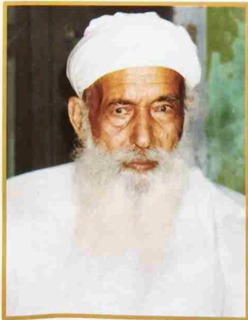
ਸੰਤ ਅਮਰ ਸਿੰਘ ਜੀ - 1996