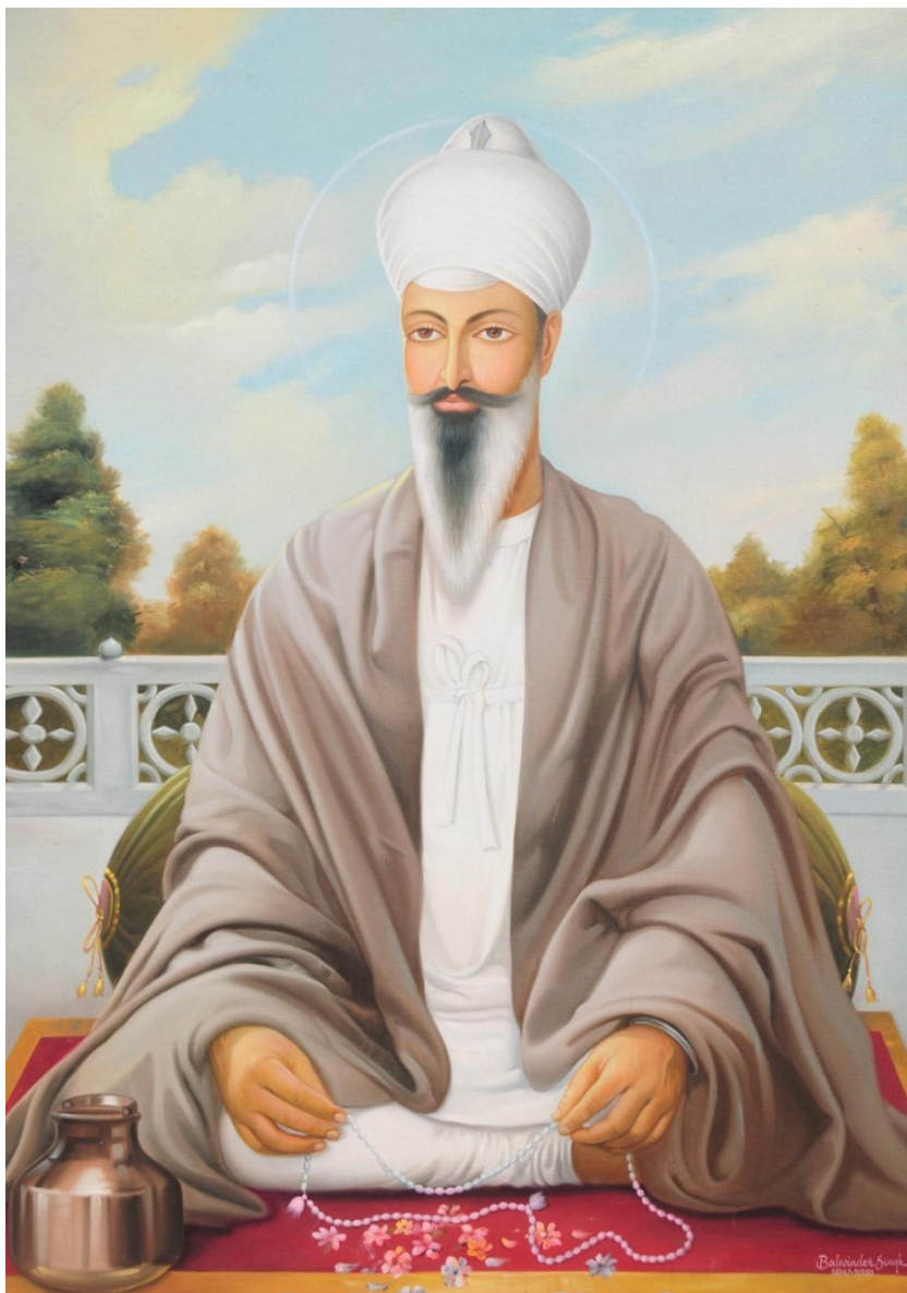
ਅਜ਼ਾਦੀ ਸੰਗਰਾਮ ਦੇ ਮਹਾਂਨਾਇਕ ਬਾਬਾ ਰਾਮ ਸਿੰਘ ਜੀ