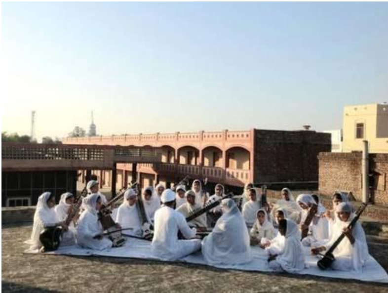
ਨਾਮਧਾਰੀ ਬੀਬੀਆਂ ਕੀਰਤਨ ਕਰਦੇ ਸਮੇਂ