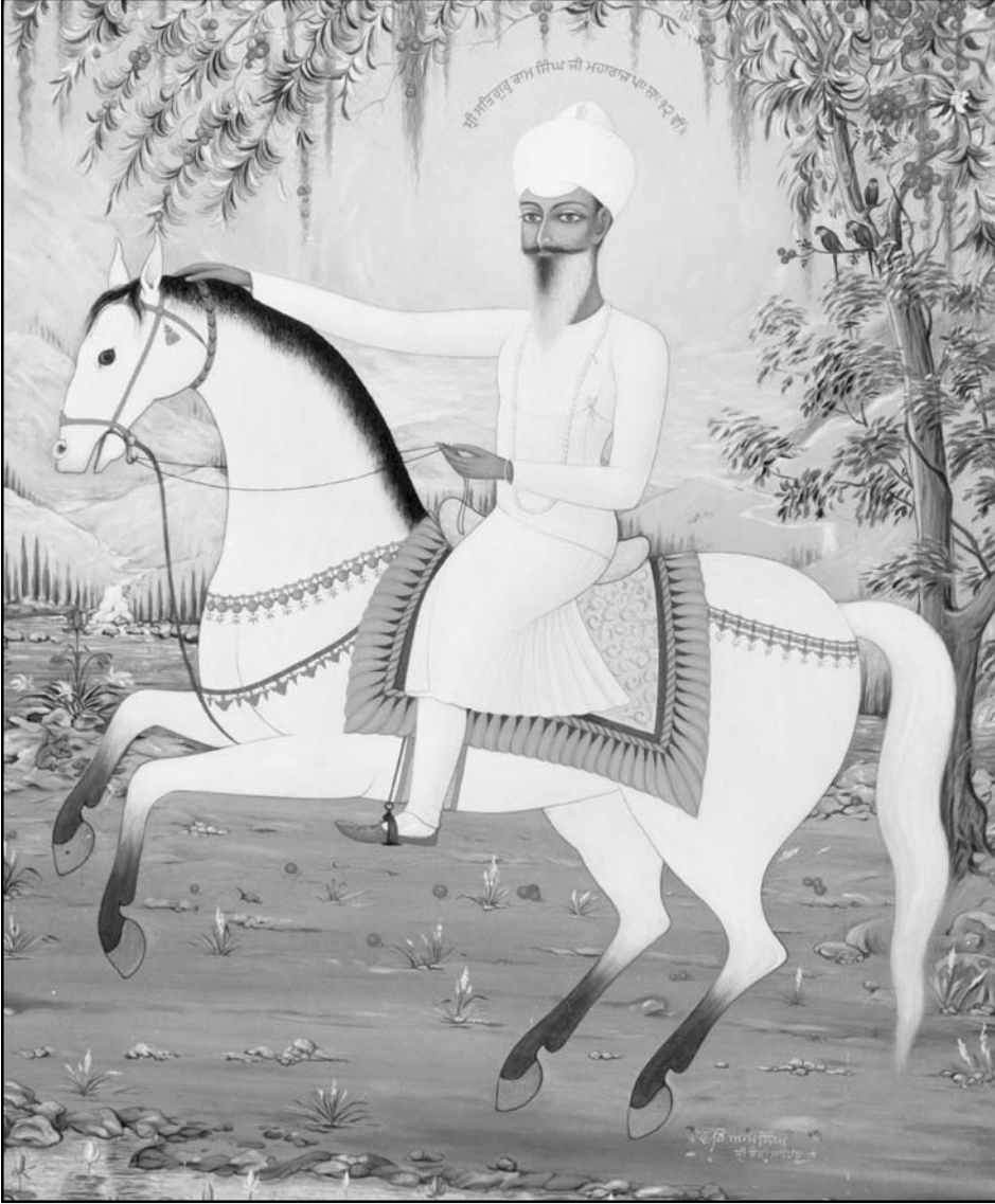
ਚੀਨੀ ਘੋੜੀ ਤੇ ਸਵਾਰ ਸ੍ਰੀ ਸਤਿਗੁਰੂ ਰਾਮ ਸਿੰਘ ਜੀ।