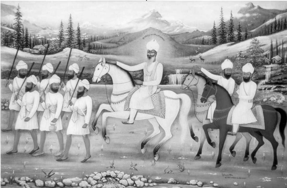
ਸ੍ਰੀ ਸਤਿਗੁਰੂ ਰਾਮ ਸਿੰਘ ਜੀ ਨੇ ਸੰਤ ਖਾਲਸੇ ਦੀ ਸਾਜਨਾ ਤੋਂ ਬਾਅਦ ਸੂਬਿਆਂ ਸਹਿਤ ਪ੍ਰਚਾਰ ਦੌਰੇ ਕੀਤੇ।