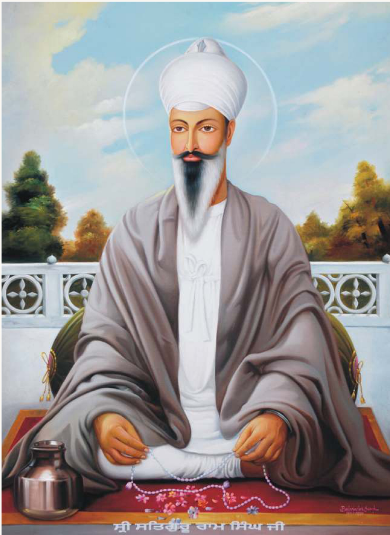
ਸ੍ਰੀ ਸਤਿਗੁਰੂ ਰਾਮ ਸਿੰਘ ਜੀ

13 ਤੋਂ 19 ਮਾਘ 2068 - 26 Jan. to 1 Feb. 2012 ਵੀਰਵਾਰ, ਸੰਮਤ ਸ੍ਰੀ ਸਤਿਗੁਰੂ ਰਾਮ ਸਿੰਘ ਜੀ 197