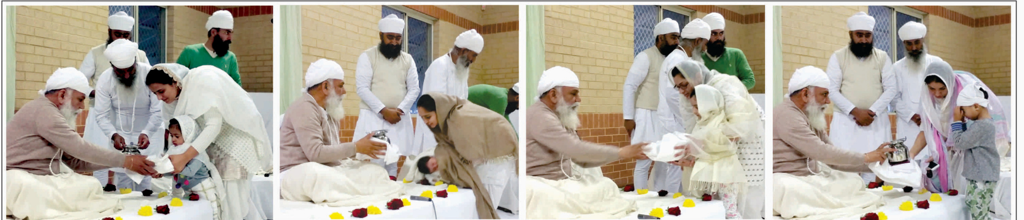
ਸ੍ਰੀ ਸਤਿਗੁਰੂ ਜੀ ਨੇ ਪਰਥ ਦੇ ਵਸਨੀਕ ਨੌਜਵਾਨ ਬੱਚਿਆਂ ਨੂੰ ਗੁਰਸਿੱਖੀ ਦੇ ਚਿੰਨ੍ਹ ਬਖਸ਼ਿਸ਼ ਕੀਤੇ।