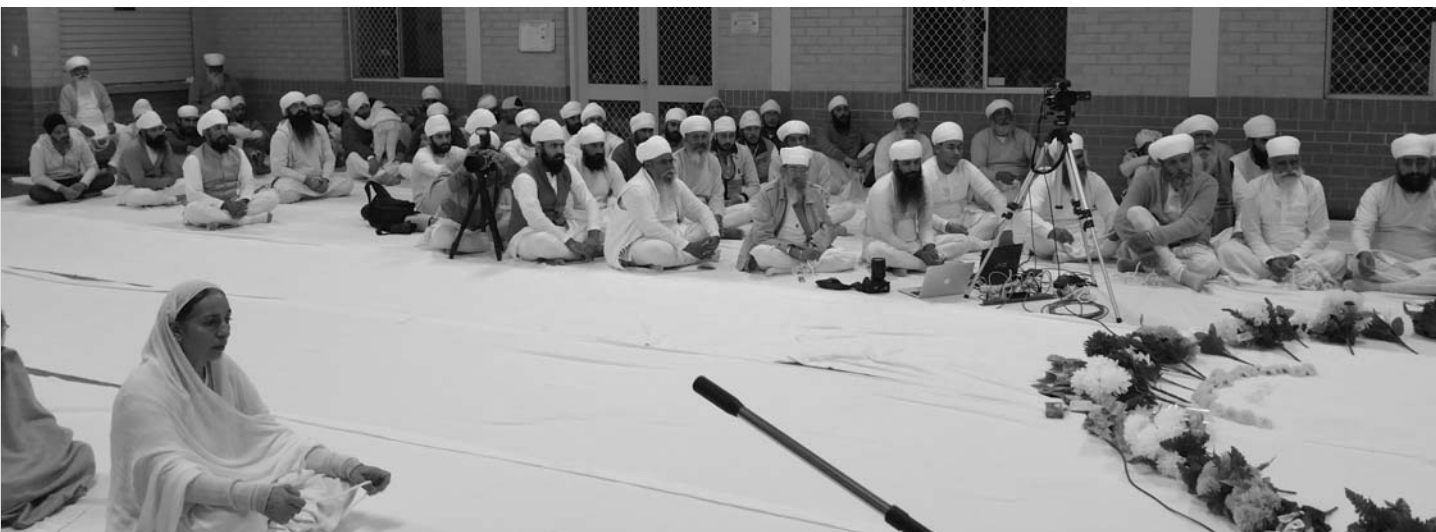
ਸ੍ਰੀ ਸਤਿਗੁਰੂ ਜੀ ਦੇ ਪਰਥ ਦੌਰੇ ਸਮੇਂ ਸਾਧ ਸੰਗਤ ਨਾਮ ਸਿਮਰਨ ਕਰਦੀ ਹੋਈ।