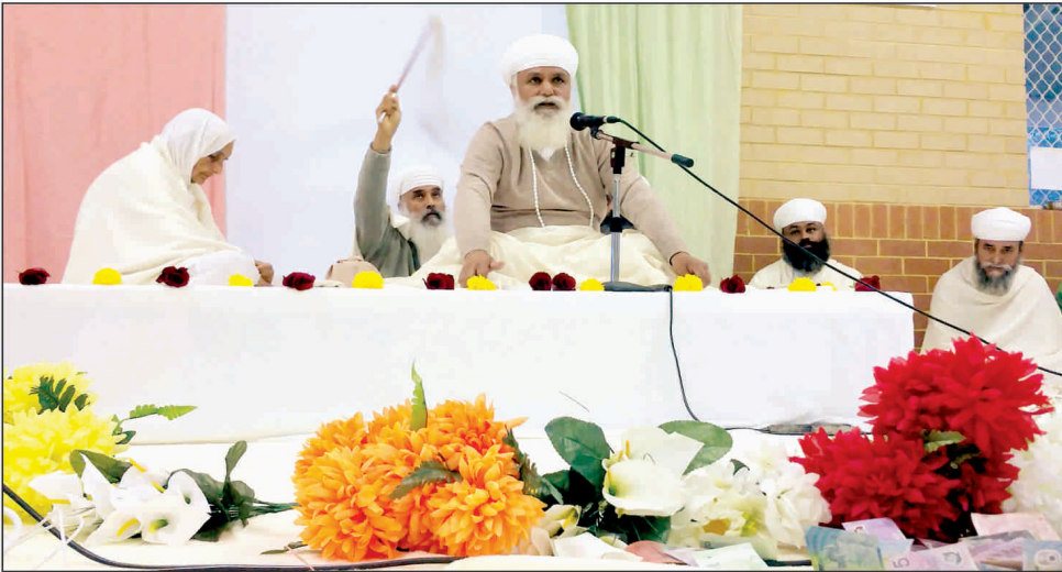
ਪਰਥ ਆਸਟ੍ਰੇਲੀਆ ਵਿਖੇ ਸ੍ਰੀ ਸਤਿਗੁਰੂ ਜੀ ਸਰਬਤ ਦੇ ਭੱਲੇ ਲਈ ਪ੍ਰਵਚਨ ਕਰਨ ਦੀ ਕ੍ਰਿਪਾ ਕਰਦੇ ਹੋਏ।