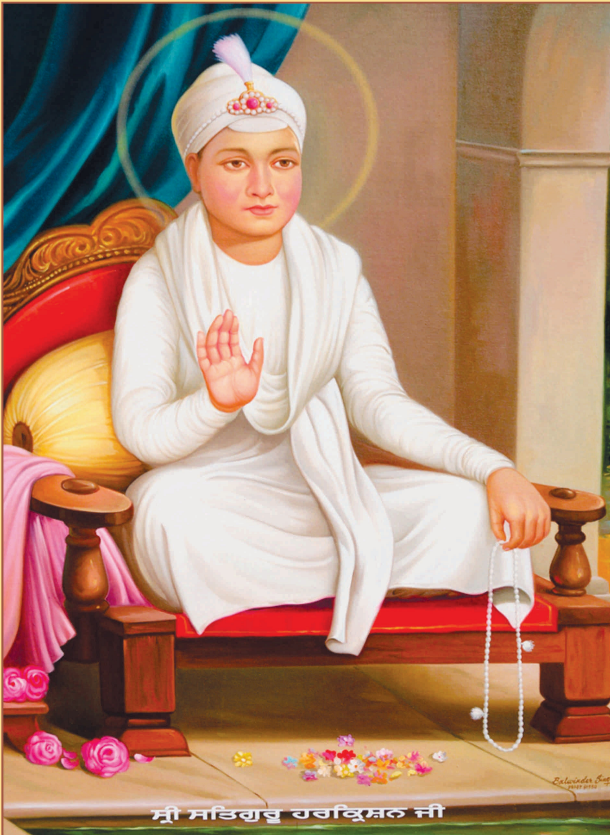
ਸ੍ਰੀ ਸਤਿਗੁਰੂ ਹਰਕ੍ਰਿਸ਼ਨ ਜੀ

ਸ੍ਰੀ ਹਰਿ ਕ੍ਰਿਸ਼ਨ ਧਿਆਈਐ ਜਿਸ ਡਿਠੈ ਸਭਿ ਦੁਖ ਜਾਏ ॥