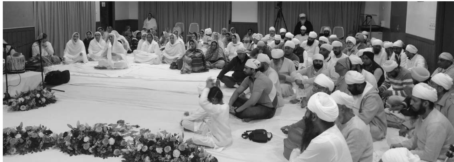
ਬ੍ਰਿਸਬੇਨ ਆਸਟ੍ਰੇਲੀਆ ਵਿਖੇ ਹੋਏ ਪ੍ਰੋਗਰਾਮ ਦੌਰਾਨ ਬੈਠੀ ਸਾਧ ਸੰਗਤ।