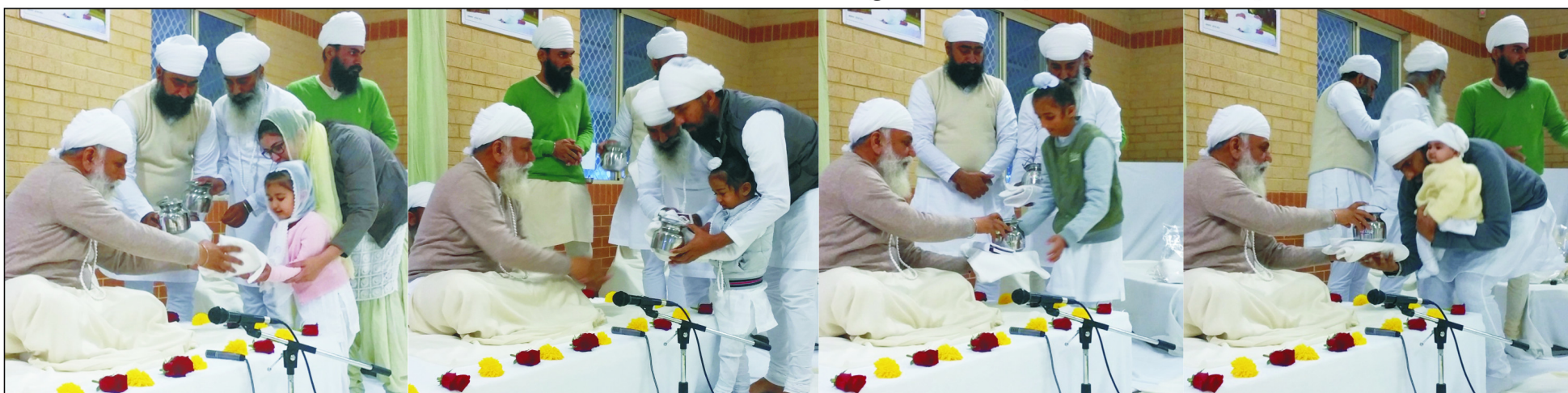
ਸ੍ਰੀ ਸਤਿਗੁਰੂ ਜੀ ਨੇ ਪਰਥ (ਆਸਟ੍ਰੇਲੀਆ) ਦੇ ਵਸਨੀਕ ਨੌਜਵਾਨ ਬੱਚਿਆਂ ਨੂੰ ਗੁਰਸਿੱਖੀ ਦੇ ਚਿੰਨ੍ਹ ਬਖਸ਼ਿਸ਼ ਕੀਤੇ