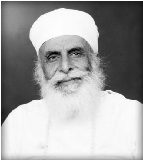
ਸ੍ਰੀ ਸਤਿਗੁਰੂ ਪ੍ਰਤਾਪ ਸਿੰਘ ਜੀ

ਪੰਜ ਭਾਦਰੋਂ ਵਿਛੋੜੇ ਦੀ ਰਾਤ ਸੀ, ਕਿਉਂਕਿ ਉਸ ਰਾਤ ਅਟਲ ਪ੍ਰਤਾਪੀ ਸ੍ਰੀ ਸਤਿਗੁਰੂ ਪ੍ਰਤਾਪ ਸਿੰਘ ਜੀ ਬ੍ਰਹਮਲੀਨ ਹੋਏ ਸਨ, ਦੇਹ ਦਾ ਓਹਲਾ ਕਰਕੇ ਗਏ ਸਨ ਅਤੇ ਰੋਂਦੀਆਂ, ਵਿਲਕਦੀਆਂ, ਕੁਰਲਾਉਂਦੀਆਂ ਸੰਗਤਾਂ ਨੂੰ ਛੱਡ ਗਏ ਸਨ। ਅਜੇ ਨਾਮਧਾਰੀ ਪੰਥ ਨੂੰ ਸ੍ਰੀ ਸਤਿਗੁਰੂ ਰਾਮ ਸਿੰਘ ਜੀ ਦੇ ਪ੍ਰਦੇਸ਼ ਗਵਨ ਦਾ ਵਿਛੋੜਾ ਅਜੇ ਭੁਲਿਆ ਨਹੀਂ ਸੀ ਕਿ ਇਕ ਹੋਰ ਵਿਛੋੜਾ ਪੈ ਗਿਆ ਸੀ ਜੋ ਨਾਮਧਾਰੀ ਪੰਥ ਲਈ ਅਸਹਿ ਤੇ ਅਕਹਿ ਸੀ। ਅਟਲ ਪ੍ਰਤਾਪੀ ਸਤਿਗੁਰੂ ਜੀ ਨੇ ਨਾਮਧਾਰੀ ਪੰਥ ਦੀ ਉਨਤੀ ਅਤੇ ਭਵਿੱਖ ਵਿਚ ਹਰ ਪੱਖ ਯੋਗ ਹੋਣ ਲਈ ਲੰਮੀ ਜਦੋਂ ਜਹਿਦ ਕੀਤੀ ਸੀ ਅਤੇ ਸਤਿਗੁਰੂ ਰਾਮ ਸਿੰਘ ਜੀ ਦੇ ਸੁਤੰਤਰਤਾ ਸੰਗ੍ਰਾਮ ਵਾਲੇ ਮਿਸ਼ਨ ਨੂੰ ਅਗੇ ਤੋਰਦੇ ਹੋਏ ਦੂਜੇ ਦੇਸ਼ ਭਗਤਾਂ ਸੰਗ ਮਿਲਕੇ 1947 ਈਸਵੀ ਵਿਚ ਹਿੰਦੋਤਸਤਾਨ ਨੂੰ ਅੰਗਰੇਜ਼ ਤੋਂ ਆਜ਼ਾਦ ਕਰਾਇਆ ਸੀ।