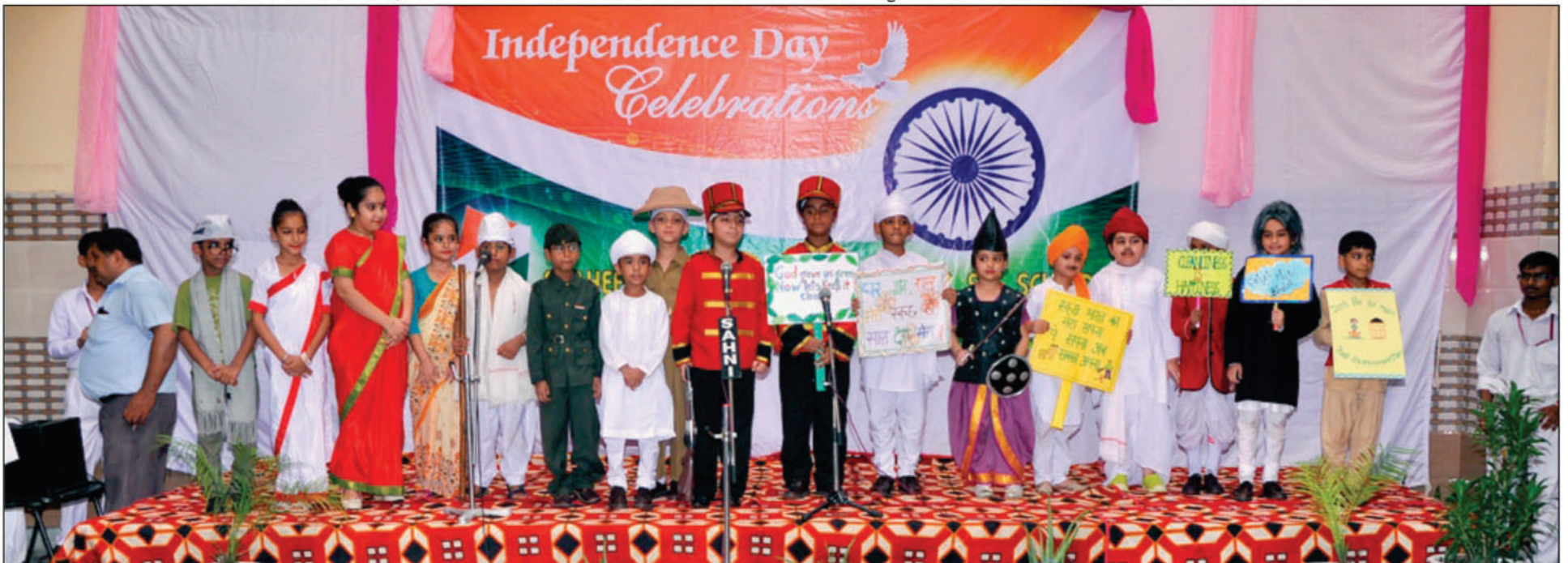
69ਵਾਂ ਸੁਤੰਤਰਤਾ ਦਿਵਸ ਮੌਕੇ ਛੋਟੇ ਛੋਟੇ ਬੱਚੇ ਵੱਖੋ-ਵੱਖ ਨੇਤਾਵਾਂ ਦੀਆਂ ਵੇਸ਼ਭੂਸ਼ਾ ਵਿੱਚ ਆਪਣਾ ਯੋਗਦਾਨ ਪਾਉਂਦੇ ਹੋਏ।