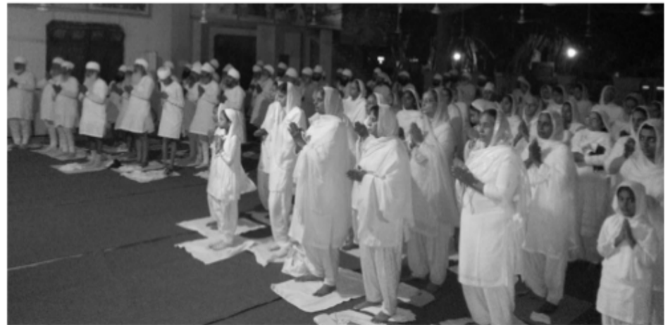
ਜਪ ਪ੍ਰਯੋਗ ਦੇ ਆਰੰਭ ਸਮੇਂ ਹਾਜ਼ਰ ਸਾਧ ਸੰਗਤ।