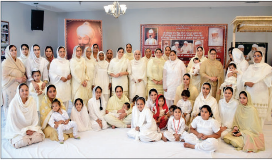
ਅਮਰੀਕਾ ਵਿਖੇ ਮਨਾਏ ਗੁਰੂ ਸਾਹਿਬਾਨਾਂ ਦੇ ਪੁਰਬਾਂ ਤੇ ਦੂਰੋਂ ਨੇੜਿਓਂ ਪਹੁੰਚੀ ਸਾਧ ਸੰਗਤ (ਰਿਪੋਰਟ ਸਫਾ 2 'ਤੇ)