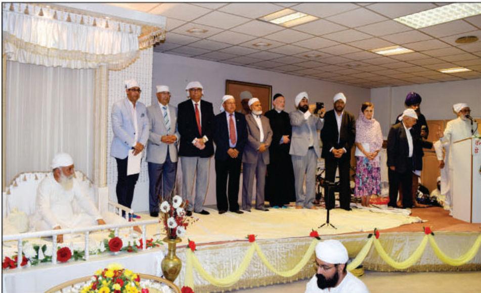
ਸ੍ਰੀ ਸਤਿਗੁਰੂ ਜੀ ਦੇ ਬਰਮਿੰਘਮ ਯੂ. ਕੇ. ਦਰਸ਼ਨ ਦੇਣ ਸਮੇਂ ਵੱਖੋ-ਵੱਖ ਅਦਾਰਿਆ ਦੇ ਬੁਲਾਰੇ ਆਪ ਜੀ ਦੇ ਦਰਸ਼ਨ ਕਰਨ ਪਹੁੰਚ ਆਪਣੀ ਹਾਜ਼ਰੀ ਲਾਉਂਦੇ ਹੋਏ