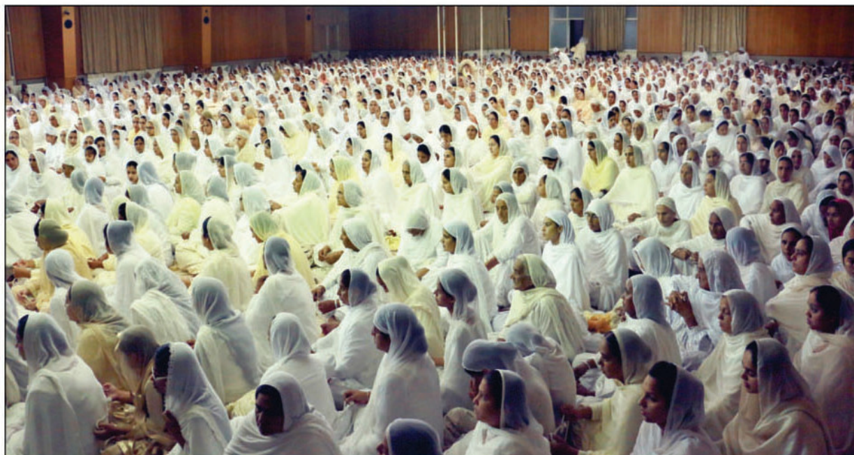
ਹਰੀ ਮੰਦਰ ਵਿੱਚ ਚਲ ਰਹੇ ਜਪ ਪ੍ਰਯੋਗ ਦੌਰਾਨ ਬੀਬੀਆਂ ਨਾਮ ਸਿਮਰਨ ਕਰਦੀਆਂ ਹੋਈਆਂ