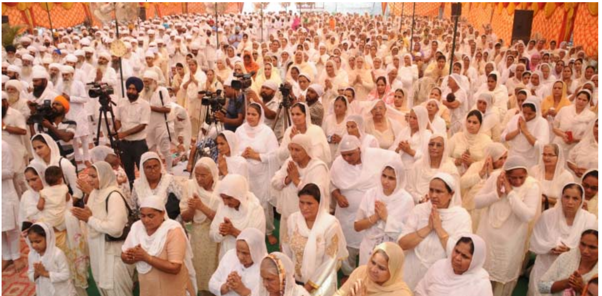
ਅੰਮ੍ਰਿਤਸਰ ਸ਼ਹੀਦਾਂ ਦੇ ਮੇਲੇ ਸਮੇਂ ਸਾਧ ਸੰਗਤ ਦਾ ਭਾਰੀ ਵਿਸ਼ਾਲ ਇਕੱਠ।