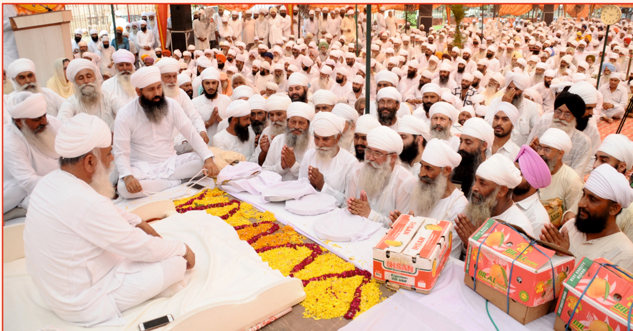
ਅੰਮ੍ਰਿਤਸਰ ਵਿਖੇ ਮਨਾਏ ਸ਼ਹੀਦਾਂ ਦੇ ਮੇਲੇ ਸਮੇਂ ਸ੍ਰੀ ਸਤਿਗੁਰੂ ਜੀ ਦੇ ਦਰਸ਼ਨ ਦੇਣ ਮੌਕੇ ਆਪ ਜੀ ਦਾ ਤਹਿ-ਦਿਲੋਂ ਧੰਨਵਾਦ ਕਰਦੀ ਅੰਮ੍ਰਿਤਸਰ ਦੀ ਸਾਧ ਸੰਗਤ - 15 ਸਤੰਬਰ 2015

ਅੰਮ੍ਰਿਤਸਰ, 15 ਸਤੰਬਰ 2015:- ਸ੍ਰੀ ਸਤਿਗੁਰੂ ਰਾਮ ਸਿੰਘ ਜੀ 19ਵੀਂ ਸਦੀ ਦੇ ਮਹਾਨ ਧਾਰਮਿਕ ਨੇਤਾ ਤੇ ਯੁਗ ਪਲਟਾਉ ਸਤਿਗੁਰੂ ਹੋਏ ਹਨ। ਜਿਨ੍ਹਾਂ ਦੀ ਅਣਥੱਕ ਮਿਹਨਤ ਨੇ ਸਮੁੱਚੀ ਭਾਰਤ ਦੀ ਜਨਤਾ ਨੂੰ ਹਲੂਣਿਆ ਅਤੇ ਇੱਕ ਸ਼ਕਤੀਸਾਲੀ ਆਦਰਸ਼ ਜੀਵਨ ਦੀ ਨੀਂਹ ਰੱਖੀ। ਸਹੀ ਅਰਥਾਂ ਵਿੱਚ ਸ੍ਰੀ ਸਤਿਗੁਰੂ ਰਾਮ ਸਿੰਘ ਜੀ ਅਕਾਲ ਪੁਰਖ ਹਨ ਉਹਨਾਂ ਨੂੰ ਕਾਲ ਜਾਂ ਦੇਸ ਦੀ ਪਕੜ ਵਿੱਚ ਨਹੀਂ ਬੰਨਿਆਂ ਜਾ ਸਕਦਾ। ਉਹਨਾਂ ਨੇ ਮੁਰਝਾਈ ਹੋਈ ਸਿੱਖੀ ਨੂੰ ਮੁੜ ਸੁਰਜੀਤ ਕੀਤਾ ਤੇ ਇੱਕ ਇਹੋ ਜਿਹੇ ਸੱਚੇ ਸੂਚੇ ਤੇ ਬੇਡਰ ਸਿੱਖਾਂ ਦੀ ਫ਼ੌਜ ਤਿਆਰ ਕਰ ਦਿੱਤੀ। ਸਤਿਗੁਰੂ ਰਾਮ ਸਿੰਘ ਜੀ ਨੇ 10 ਸਾਲਾਂ ਦੇ ਵਿੱਚ 7 ਲੱਖ ਨਾਮਧਾਰੀ ਸਿੱਖ ਸਾਜ ਦਿਤੇ ਇਹ ਇੱਕ ਇਤਿਹਾਸ ਵਿੱਚ ਬਹੁਤ ਵੱਡੀ ਅਹਿਮੀਅਤ ਰੱਖਦੀ ਹੈ। ਅੱਜ ਤਕ ਇੰਨਾਂ ਵੱਡਾ ਇੰਨੇ ਥੋੜੇ ਸਮੇਂ ਵਿੱਚ ਸਿੱਖੀ ਦਾ ਪ੍ਰਸਾਰ ਹੋਇਆ। ਸ੍ਰੀ ਸਤਿਗੁਰੂ ਰਾਮ ਸਿੰਘ ਜੀ ਦੇ 'ਕੂਕਾ ਪੰਥ' ਨੇ ਗਊਆਂ ਤੇ ਗ਼ਰੀਬਾਂ ਦੀ ਰੱਖਿਆ ਕੀਤੀ ਅੰਗਰੇਜ਼ ਸਰਕਾਰ ਦਾ ਰਾਜ ਸੀ ਉਸਨੇ ਥਾਂ-ਥਾਂ ਤੇ ਬੁਚੜਖਾਨੇ ਖੋਲੇ ਸਨ। ਕੋਈ ਵੀ ਹਿੰਮਤ ਨਹੀਂ ਰੱਖਦਾ ਸੀ ਕਿ ਇਤਨੇ ਵੱਡੇ ਸਾਮਰਾਜ ਨਾਲ ਮੱਥਾ ਲੈ ਸਕੇ ਪਰ ਸਤਿਗੁਰੂ ਰਾਮ ਸਿੰਘ ਜੀ ਦੇ ਸਿੱਖਾਂ ਨੂੰ ਮੌਤ ਪਿਆਰੀ ਸੀ ਆਪਣਾ ਜੀਵਨ ਪਿਆਰਾ ਨਹੀਂ ਸੀ ਉਹਨਾਂ ਵਿੱਚ ਅੰਮ੍ਰਿਤ ਦੀ ਸ਼ਕਤੀ ਸੀ। ਮਹਾਨ ਸਤਿਗੁਰੂ ਰਾਮ ਸਿੰਘ ਜੀ ਦੀ ਕ੍ਰਿਪਾ ਸੀ। ਗਊ ਗ਼ਰੀਬ ਦੀ ਰੱਖਿਆ ਕਰਨੀ ਨਾਮਧਾਰੀ ਸਿੱਖਾਂ ਦਾ ਪਰਮ ਕਰਤੱਵ ਹੋ ਗਿਆ ਸੀ।