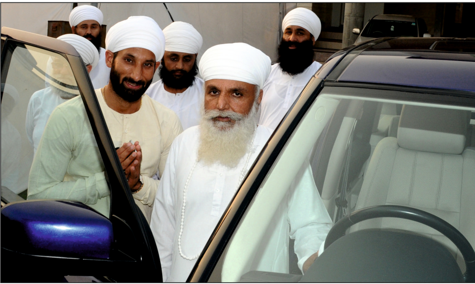
ਸ੍ਰੀ ਸਤਿਗੁਰੂ ਜੀ ਵਲੋਂ ਵਿਸ਼ਵ ਵਿਖਿਆਤ ਹਾਕੀ ਕਪਤਾਨ ਸਰਦਾਰ ਸਿੰਘ ਦੀ ਨਵੀਂ ਗੱਡੀ ਵਿੱਚ ਚਰਨ ਪਾਉਣ ਦੀ ਬਖਸ਼ਿਸ਼