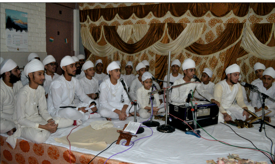
ਦਿੱਲੀ ਵਿਖੇ ਸਤਿਗੁਰੂ ਜੀ ਦੀ ਹਜ਼ੂਰੀ ਵਿੱਚ ਆਸਾ ਦੀ ਵਾਰ ਵਾਰੇ ਦੇ ਰੂਪ ਵਿੱਚ ਗਾਇਨ ਕਰਦੇ ਬੱਚੇ