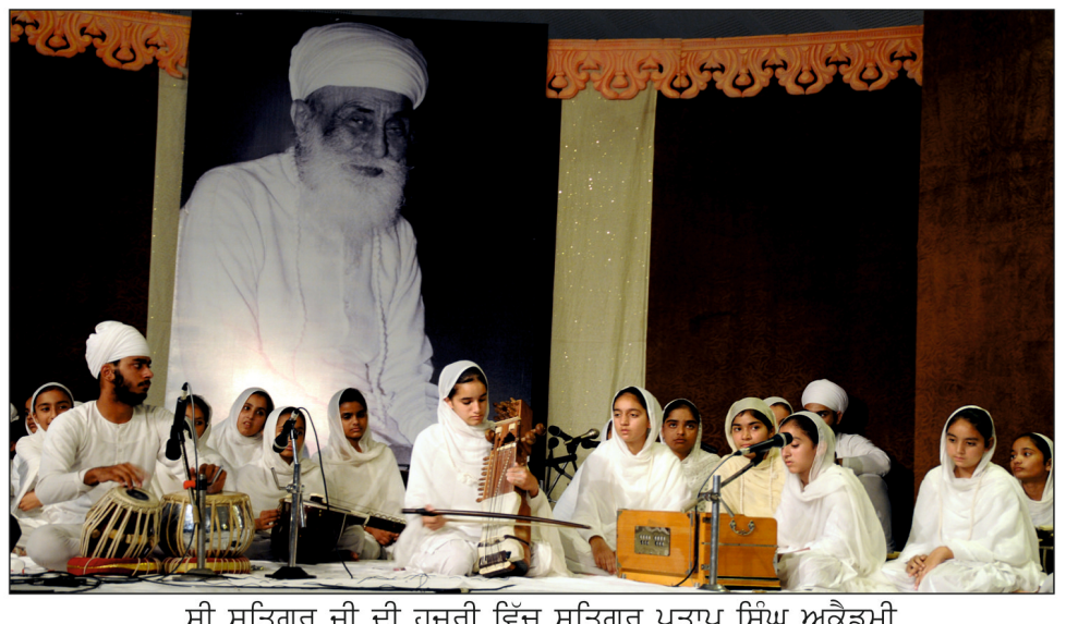
ਸ੍ਰੀ ਸਤਿਗੁਰੂ ਜੀ ਦੀ ਹਜ਼ੂਰੀ ਵਿੱਚ ਸਤਿਗੁਰੂ ਪ੍ਰਤਾਪ ਸਿੰਘ ਅਕੈਡਮੀ ਸ੍ਰੀ ਭੈਣੀ ਸਾਹਿਬ ਦੀਆਂ ਬੱਚੀਆਂ ਕੀਰਤਨ ਕਰਦੀਆਂ ਹੋਇਆ