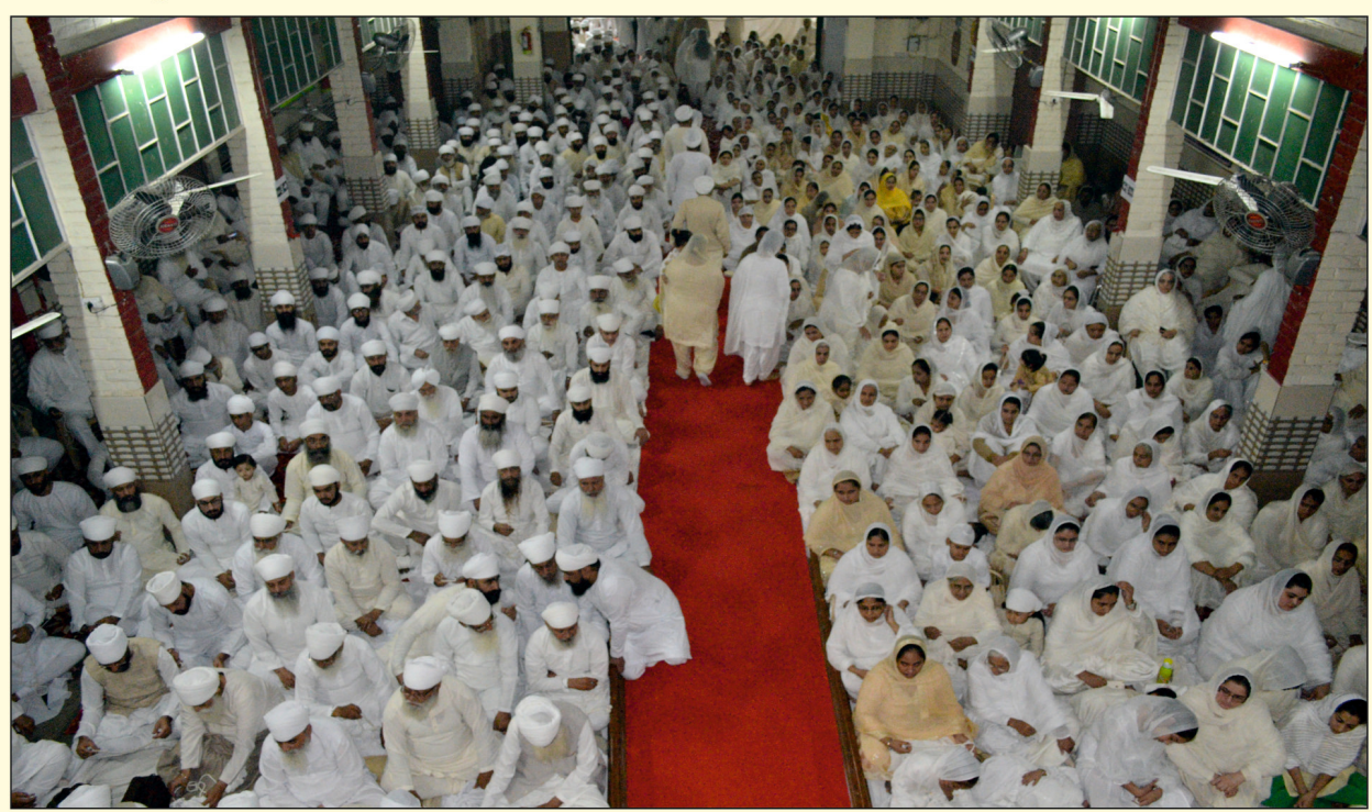
ਦਿੱਲੀ ਵਿਖੇ ਸਤਿਗੁਰੂ ਜੀ ਦੇ ਦਰਸ਼ਨਾਂ ਦਾ ਆਨੰਦ ਮਾਣਦੀ ਸਾਧ ਸੰਗਤ