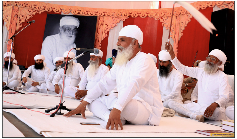
ਅੰਸੂ ਦੇ ਮੇਲੇ ਦੀ ਸਮਾਪਤੀ ਸਮੇਂ ਸ੍ਰੀ ਸਤਿਗੁਰੂ ਜੀ ਨੇ ਸਰਬੱਤ ਦੇ ਭੱਲੇ ਲਈ ਪਾਵਨ ਉਪਦੇਸ਼ ਕਰਨ ਦੀ ਕ੍ਰਿਪਾ ਕੀਤੀ