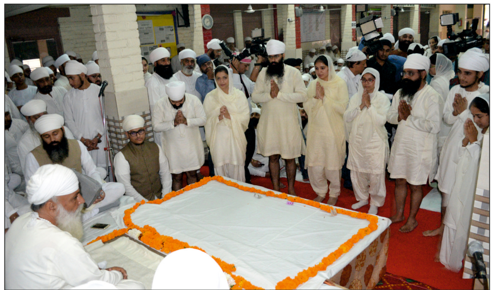
ਸ੍ਰੀ ਸਤਿਗੁਰੂ ਜੀ ਪਾਸੇ ਅਨੰਦ ਕਾਰਜਾਂ ਵਾਲੇ 4 ਜੋੜੇ ਬਖਸ਼ਿਸ਼ ਪ੍ਰਾਪਤ ਕਰਦੇ ਹੋਏ - 1 ਨਵੰਬਰ 2015, ਦਿੱਲੀ