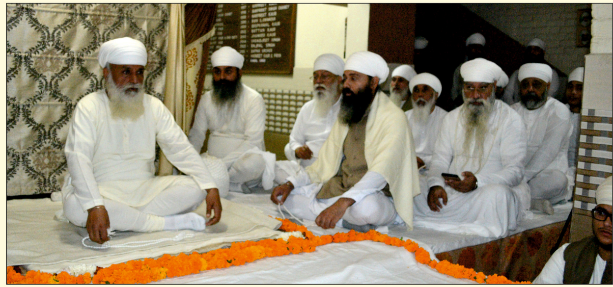
ਸ੍ਰੀ ਸਤਿਗੁਰੂ ਜੀ ਦਿੱਲੀ ਵਿਖੇ ਆਪਣੇ ਆਸਣ ਤੇ ਸੁਸ਼ੋਭਿਤ, ਦਰਸ਼ਨ ਦੇਣ ਦੀ ਕ੍ਰਿਪਾ ਕੀਤੀ ਨਾਲ ਹਨ ਸੇਵਕ ਅਤੇ ਪਤਵੰਤੇ ਸੱਜਣ