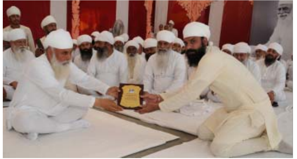
ਸ੍ਰੀ ਸਤਿਗੁਰੂ ਜੀ ਪ੍ਰੋਗਰਾਮ ‘ਸਭ ਕੁਝ ਤੂੰ ਹੀ ਤੂੰ’ ਵਿਚ ਅਵੱਲ ਆਏ ਨੌਜਵਾਨ ਨੂੰ ਸਨਮਾਨਿਤ ਕਰਦੇ ਹੋਏ।