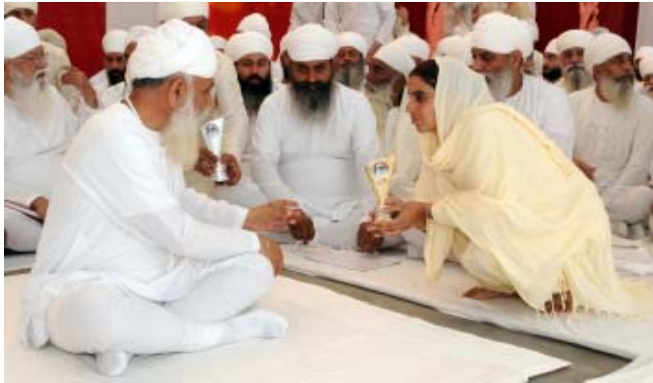
ਸ੍ਰੀ ਸਤਿਗੁਰੂ ਜੀ ਪਾਸੋਂ 'ਸਭ ਕੁਝ ਤੂੰ ਹੀ ਤੂੰ' ਪ੍ਰੋਗਰਾਮ ਵਿਚ ਹਿੱਸਾ ਲੈਣ ਵਾਲੀ ਪ੍ਰਤੀਯੋਗੀ ਇਨਾਮ ਪ੍ਰਾਪਤ ਕਰਦੀ ਹੋਈ।

ਪੜ੍ਹੇ। ਇਸ ਸਮੇਂ ਸਧਾਰਨ ਤੇ ਸ੍ਰੀ ਦਸਮ ਗ੍ਰੰਥ ਸਾਹਿਬ ਜੀ ਦੇ ਪਾਠਾਂ ਦੇ ਭੋਗ ਪਾਏ ਗਏ।