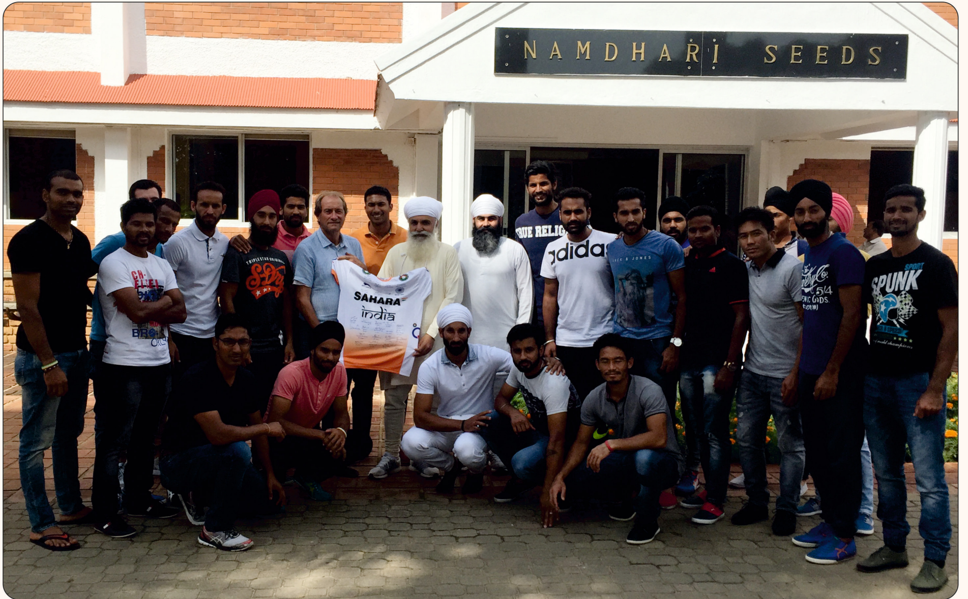
ਬੰਗਲੌਰ ਵਿਖੇ ਇੰਡੀਅਨ ਹਾਕੀ ਟੀਮ 'ਵਰਲਡ ਹਾਕੀ ਪ੍ਰੀਮੀਅਰ ਲੀਗ' ਵਿੱਚ ਖੇਡਣ ਤੋਂ ਪਹਿਲਾਂ ਸ੍ਰੀ ਸਤਿਗੁਰੂ ਜੀ ਦਾ ਅਸ਼ੀਰਵਾਦ ਪ੍ਰਾਪਤ ਕਰਦੀ ਹੋਈ-੧੪ ਨਵੰਬਰ ੨੦੧੫