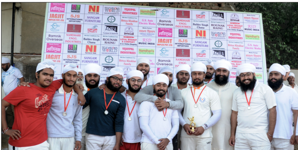
ਕ੍ਰਿਕੇਟ ਮੈਚ ਵਿੱਚ ਆਈ ਅਵੱਲ ਟੀਮ ਪ੍ਰਸੰਨ ਮੁਦਰਾਂ ਵਿੱਚ