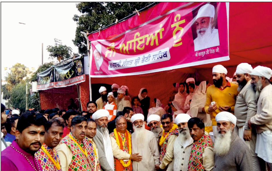
ਸ੍ਰੀ ਸਤਿਗੁਰੂ ਉਦੈ ਸਿੰਘ ਜੀ ਦੇ ਹੁਕਮ ਅਨੁਸਾਰ ਨਾਮਧਾਰੀ ਸੰਗਤ ਲੁਧਿਆਣਾ ਭਗਵਾਨ ਜਗਨਨਾਥ ਰੱਬ ਦਾ ਸਵਾਗਤ ਕਰਦੀ ਹੋਈ।