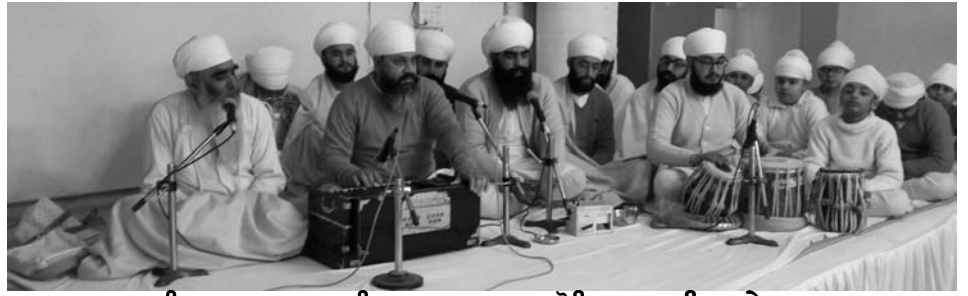
ਆਸਾ ਦੀ ਵਾਰ ਦਾ ਕੀਰਤਨ ਕਰਦਾ ਹੋਇਆ ਲੁਧਿਆਣੇ ਦਾ ਜਥਾ