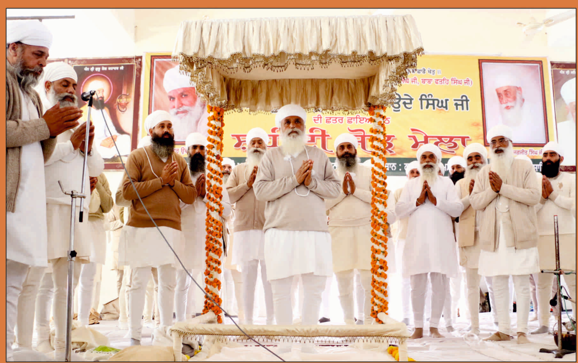
ਫਤਿਹਗੜ੍ਹ ਸਾਹਿਬ ਵਿਖੇ ਮੇਲੇ ਦੀ ਸਮਾਪਤੀ ਸਮੇਂ ਅਰਦਾਸ ਵਿੱਚ ਸ਼ਾਮਿਲ ਸ੍ਰੀ ਸਤਿਗੁਰੂ ਜੀ, ਸਿੱਖ ਸੇਵਕ ਅਤੇ ਸਾਧ-ਸੰਗਤ-27 ਦਸੰਬਰ 2015