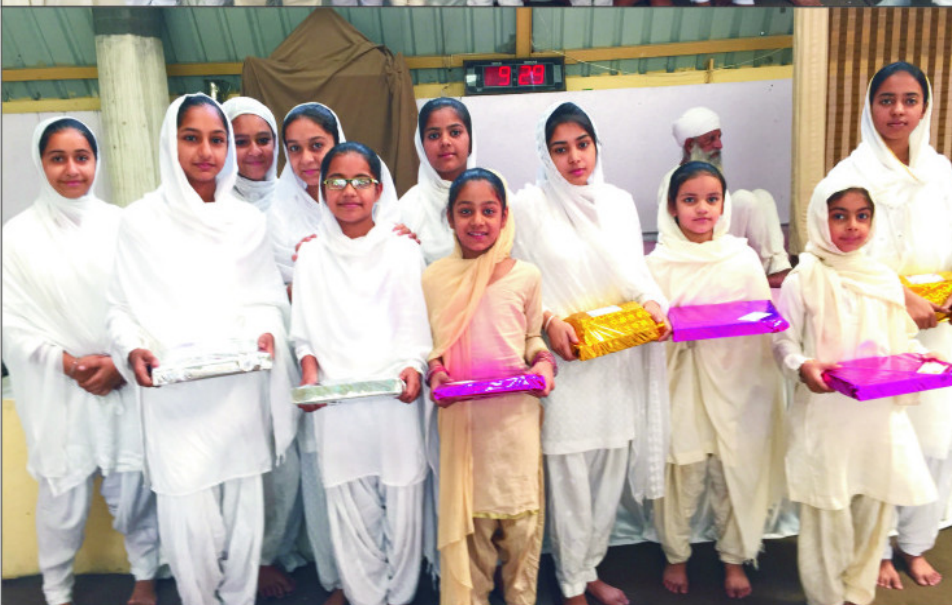
ਨਾਮਧਾਰੀ ਸ਼ਹੀਦੀ ਸਮਾਰਕ ਲੁਧਿਆਣਾ ਵਿਖੇ ਹੋਏ ਚਿਤਰਕਾਰੀ ਪ੍ਰਤਿਯੋਗਿਤਾ ਵਿੱਚ ਹਿੱਸਾ ਲੈਣ ਵਾਲੇ ਬੱਚੇ ਆਪਣੇ ਇਨਾਮਾਂ ਨਾਲ ਗਰੁਪ ਫੋਟੋ ਦੌਰਾਨ ।