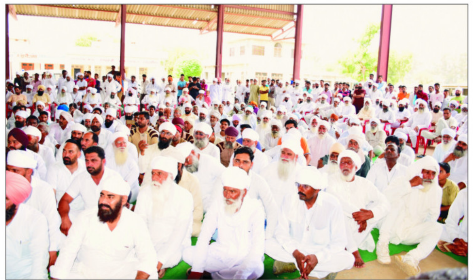
ਸ੍ਰੀ ਜੀਵਨ ਨਗਰ ਦੇ ਇਲਾਕੇ ਨੂੰ ਨਸ਼ਾ ਮੁਕਤ ਕਰਨ ਲਈ ਸ੍ਰੀ ਸਤਿਗੁਰੂ ਜੀ ਦੇ ਹੁਕਮ ਅਨੁਸਾਰ ਕਈ ਗਈ ਰੈਲੀ ਦੌਰਾਨ ਵਡੀ ਗਿਣਤੀ ਵਿੱਚ ਪਹੁੰਚੀ ਸਾਧ-ਸੰਗਤ ।