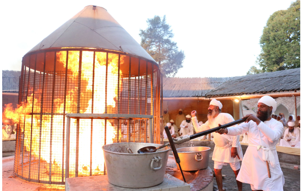
200 ਹਵਨਾਂ ਵਿਚ ਸਮਗਰੀ ਅਤੇ ਘਿਉ ਦੀ ਸੇਵਾ ਕਰਦੇ ਨਾਮਧਾਰੀ ਵਿਦਿਅਕ ਜਥਾ ਸ੍ਰੀ ਭੈਣੀ ਸਾਹਿਬ ਦੇ ਨੌਜਵਾਨ।