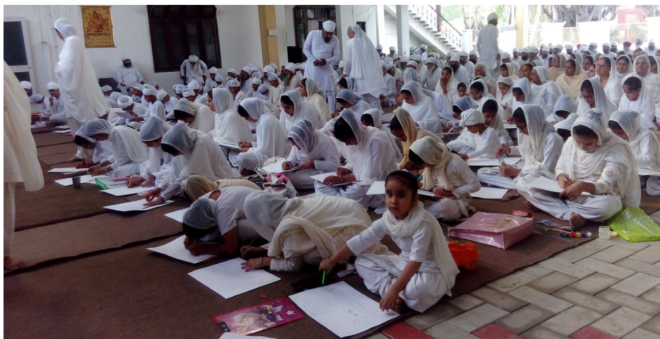
ਪੇਟਿੰਗ ਪ੍ਰਤੀਯੋਗਤਾ ਵਿਚ ਹਿੱਸਾ ਲੈਂਦੇ ਬੱਚੇ।