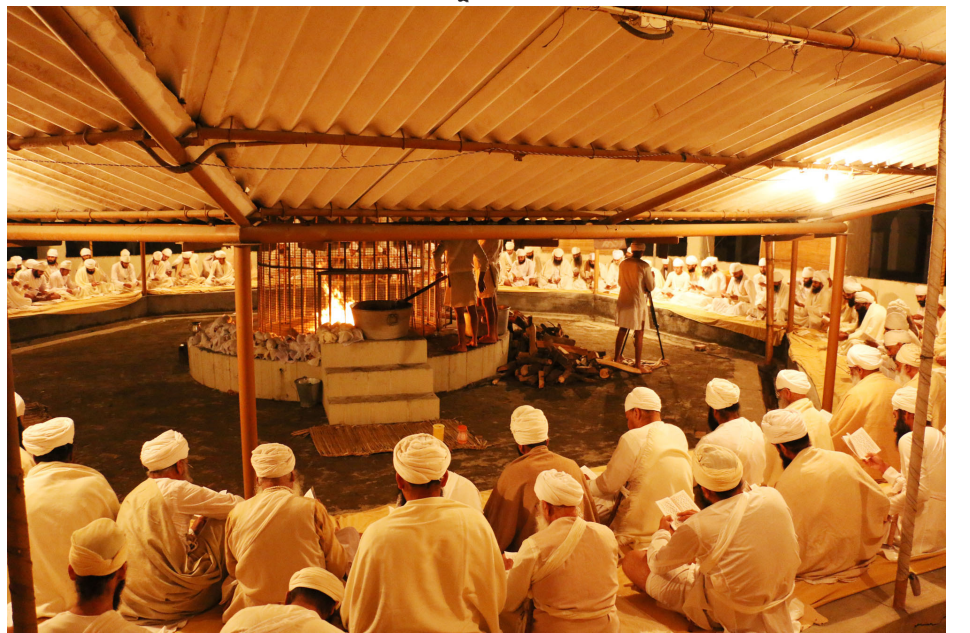
200 ਹਵਨਾਂ ਵਿਚ ਨਾਮਧਾਰੀ ਵਿਦਿਅਕ ਜਥਾ ਸ੍ਰੀ ਭੈਣੀ ਸਾਹਿਬ ਦੇ ਨੌਜਵਾਨ ਆਪਣਾ ਹਿੱਸਾ ਪਾਉਂਦੇ ਹੋਏ।