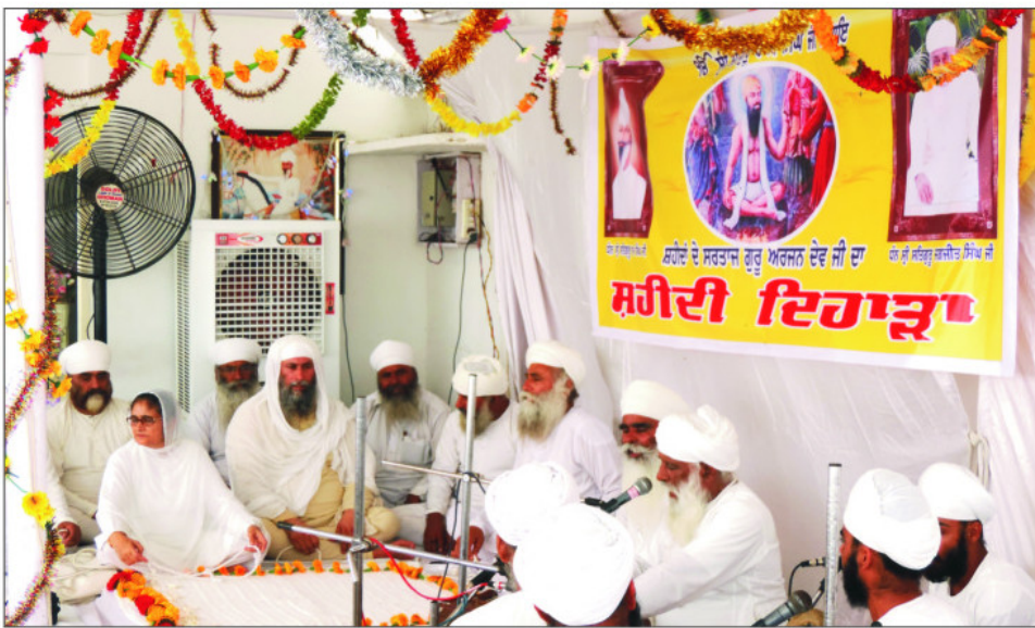
ਪਿੰਡ ਪੱਡੇ ਜ਼ਿਲ੍ਹਾ ਗੁਰਦਾਸਪੁਰ ਵਿਖੇ ਹਰਿ ਜੀ ਦੇ ਡੇਰੇ ਵਿੱਚ ਮਨਾਏ ਸ੍ਰੀ ਗੁਰੂ ਅਰਜਨ ਦੇਵ ਜੀ ਦੇ ਸ਼ਹੀਦੀ ਪੁਰਬ ਮੇਲੇ ਸਮੇਂ ਜਥੇਦਾਰ ਦੀਵਾਨ ਸਜਾਉਂਦੇ ਹੋਏ ।