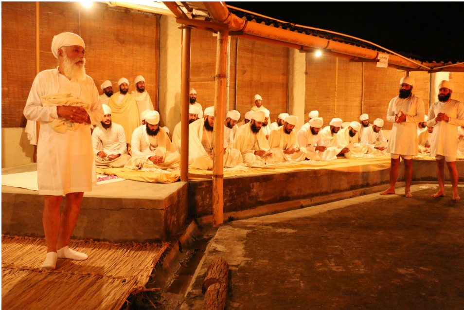
ਵਿਸ਼ਵ ਸ਼ਾਂਤੀ ਵਾਸਤੇ ਕੀਤੇ ਜਾ ਰਹੇ 200 ਹਵਨਾਂ ਵਿਚ ਅੰਮ੍ਰਿਤ ਵੇਲੇ ਸ੍ਰੀ ਸਤਿਗੁਰੂ ਜੀ ਦਰਸ਼ਨ ਦਿੰਦੇ ਹੋਏ।

ਸ੍ਰੀ ਭੈਣੀ ਸਾਹਿਬ-ਸ੍ਰੀ ਸਤਿਗੁਰੂ ਜੀ ਦੇ ਹੁਕਮ ਅਨੁਸਾਰ ਨਾਮਧਾਰੀ ਵਿਦਿਅਕ ਜਥਾ ਸ੍ਰੀ ਭੈਣੀ ਸਾਹਿਬ ਦੇ ਨੌਜਵਾਨਾਂ ਵਲੋਂ ਪਹਿਲੀ ਵਾਰ 200 ਹਵਨ ਕੀਤੇ ਗਏ। ਇਹ ਹਵਨ ਵਿਸ਼ਵ ਸ਼ਾਂਤੀ ਅਤੇ ਸ੍ਰੀ ਸਤਿਗੁਰੂ ਰਾਮ ਸਿੰਘ ਜੀ ਦੇ 200 ਸਾਲਾ ਪ੍ਰਕਾਸ਼ ਦਿਹਾੜੇ ਨੂੰ ਸਮਰਪਿਤ ਸਨ। ਇਹ 2016 ਸਾਲ ਸ੍ਰੀ ਸਤਿਗੁਰੂ ਰਾਮ ਸਿੰਘ ਜੀ ਦਾ 200 ਸਾਲਾ ਪ੍ਰਕਾਸ਼ ਦਿਹਾੜਾ (ਦੂਸਰੀ ਪ੍ਰਕਾਸ਼ ਸ਼ਤਾਬਦੀ) ਨਾਮਧਾਰੀ ਪੰਥ ਵਲੋਂ ਸ਼ਰਧਾ ਤੇ ਪਿਆਰ ਨਾਲ ਮਨਾਇਆ ਜਾ ਰਿਹਾ ਹੈ। ਸ੍ਰੀ ਸਤਿਗੁਰੂ ਰਾਮ ਸਿੰਘ ਜੀ ਨੇ ਨਾਮਧਾਰੀ ਪੰਥ ਦੀ ਜੜ ਪਤਾਲ ਤੋਂ ਲਾਈ ਹੈ। ਇਸ ਮਹਾਨ ਪੰਥ ਨੂੰ ਤੱਤੀ ਵਹ ਨਹੀਂ ਲੱਗ ਸਕਦੀ। ਬੇਸ਼ਕ ਪਿਛਲੇ ਇਤਿਹਾਸ ਤੇ ਝਾਤ ਮਾਰੀਏ ਤਾਂ ਪਤਾ ਲਗਦਾ ਹੈ ਕਿ ਨਾਮਧਾਰੀ ਸਿੱਖਾਂ ਤੇ ਕਿੰਨੀਆਂ ਸਖਤੀਆਂ ਤੇ ਪਾਬੰਦੀਆਂ ਸਨ। ਇੰਨੀਆਂ ਕਠਿਨਾਈਆਂ ਦੇ ਬਾਵਜੂਦ ਨਾਮਧਾਰੀ ਪੰਥ ਸਦਾ ਹੀ ਚੜ੍ਹਦੀ ਕਲਾ ਵਿਚ ਰਿਹਾ ਕਿਉਂਕਿ ਸਤਿਗੁਰੂ ਰਾਮ ਸਿੰਘ ਜੀ ਨੇ ਇਸ ਦੀ ਜੜ ਬਹੁਤ ਮਜ਼ਬੂਤ ਰਖੀ ਹੋਈ ਹੈ।