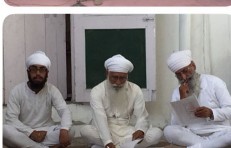
ਪ੍ਰਤੀਯੋਗਤਾ ਦੇ ਜੱਜ ਸਾਹਿਬਾਨ ਆਪਣੇ ਵਿਚਾਰ ਸਾਂਝੇ ਕਰਦੇ ਹੋਏ।