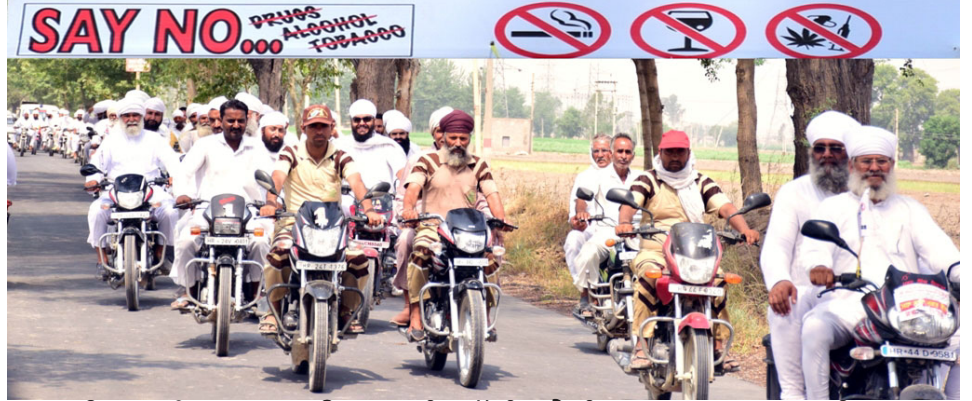
ਨਸ਼ਿਆਂ ਤੇ ਠਲੂ ਪਾਉਣ ਲਈ ਕੱਢੀ ਰੈਲੀ ਦੌਰਾਨ ਨੌਜਵਾਨ ਵਿਸ਼ਾਲ ਜਲਸੇ ਦੇ ਰੂਪ ਵਿਚ।

ਸ੍ਰੀ ਸਤਿਗੁਰੂ ਜਗਜੀਤ ਸਿੰਘ ਜੀ ਵੀ ਪਿੰਡ ਵਸਾ ਕੇ ਆਪਣੇ ਸਿਖਾਂ ਦੀ ਸੁਖ ਸਾਂਦ ਪੁਛਣੀ ਤੇ ਲੋੜਵੰਦਾਂ ਨੂੰ ਜ਼ਰੂਰੀ ਸਮਗਰੀ ਦੇਣੀ। ਸ੍ਰੀ ਸਤਿਗੁਰੂ ਜੀ ਦੀ ਦਿਲੀ ਇਛਾ ਹੁੰਦੀ ਸੀ ਕਿ ਮੇਰੇ ਸਿਖਾਂ ਕੋਲ ਸੁਖ ਦੇ ਸਾਰੇ ਸਾਧਨ ਹੋਣ। ਜੇ ਸੁਖਨਾ ਸ੍ਰੀ ਸਤਿਗੁਰੂ ਪ੍ਰਤਾਪ ਸਿੰਘ ਜੀ ਨੇ ਸਿਰਜਿਆ ਸੀ ਉਹ ਸ੍ਰੀ ਸਤਿਗੁਰੂ ਜਗਜੀਤ ਸਿੰਘ ਜੀ ਨੇ ਸੱਚ ਕਰ ਵਿਖਾਇਆ। ਇਹ ਸਾਰਾ ਇਲਾਕਾ ਮੀਟ ਸਰਾਬ ਤੇ ਤਮਾਕੂ ਰਹਿਤ ਕੀਤਾ। ਸ੍ਰੀ ਸਤਿਗੁਰੂ ਜਗਜੀਤ ਸਿੰਘ ਜੀ ਨੇ ਇਸ ਧਰਤੀ ਤੇ ਕਿੰਨੇ ਹੀ ਹੋਲੇ, ਕਿੰਨੇ ਹੀ ਅੱਸੂ ਦੇ ਮੇਲੇ, ਅਖੰਡ ਪਾਠ ਤੇ ਸਧਾਰਨ ਪਾਠਾਂ ਦੇ ਭੋਗ ਪੁਆਏ। ਨਾਮ ਬਾਣੀ ਦਾ ਐਸਾ ਪਰਵਾਰ ਚਲਾਇਆ ਸਾਰੀ ਸੰਗਤ ਨਾਮ ਦੀ ਰੰਗਤ ਵਿਚ ਰੰਗੀ ਰਹਿੰਦੀ ਸੀ। ਸ੍ਰੀ ਸਤਿਗੁਰੂ ਜੀ ਦੀ ਆਪਣੀ ਰਜ਼ਾ ਅਨੁਸਾਰ ਸੇਹਤ ਢਿਲੀ ਹੋਣ ਕਰਕੇ ਸ੍ਰੀ ਭੈਣੀ ਸਾਹਿਬ ਵਿਖੇ ਹੀ ਰਹਿੰਦੇ। ਇਕ ਲੰਮੇ ਸਮੇਂ ਸ੍ਰੀ ਜੀਵਨ ਨਗਰ ਇਲਾਕਾ ਵਿਖੇ ਦਰਸ਼ਨ ਨਾ ਦੇਣ ਕਰਕੇ ਇਥੋਂ ਦੀ ਨੌਜਵਾਨ ਪੀੜ੍ਹੀ ਵਿਚ ਫਿਰ ਉਹ ਕੁਰੀਤੀਆਂ ਆ ਗਈਆਂ ਜੋ ਕਿ ਇਕ ਚਿੰਤਾ ਦਾ ਵਿਸ਼ਾ ਹੈ: