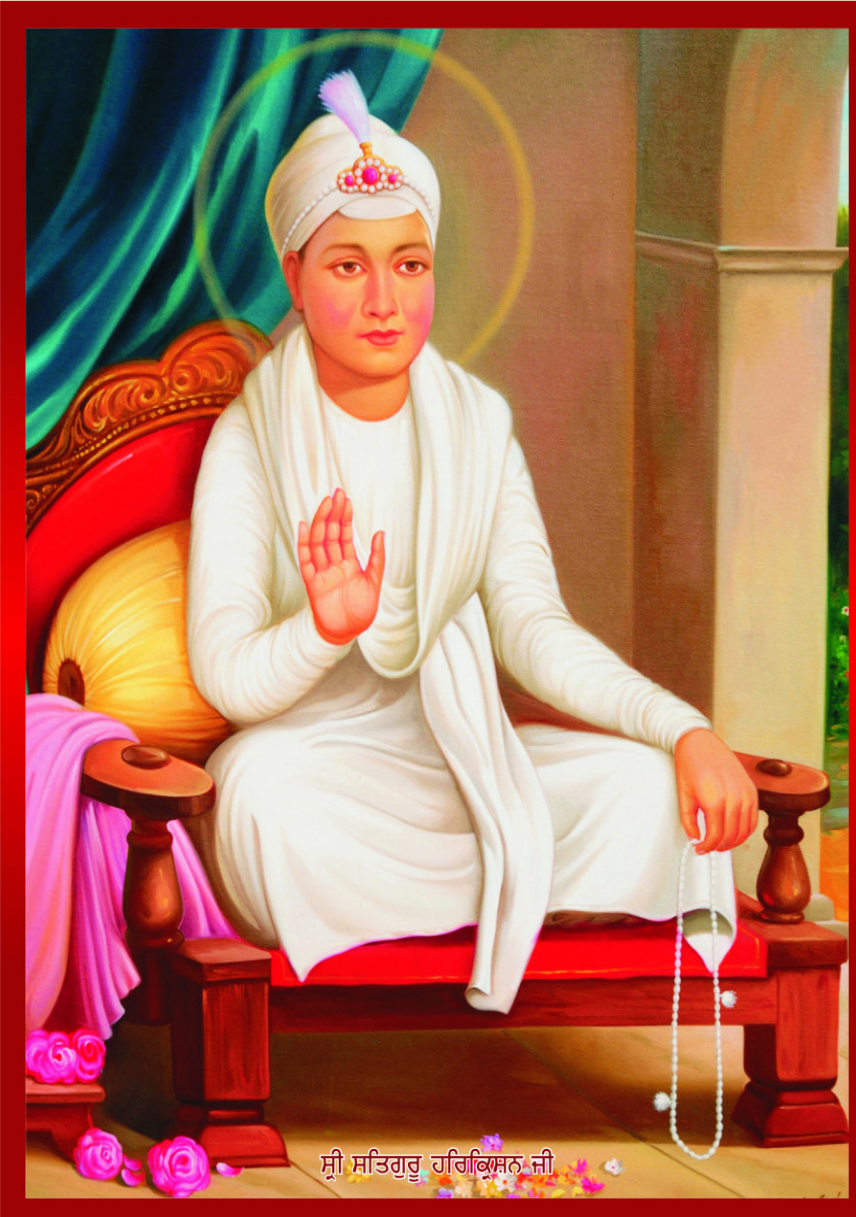
ਸ੍ਰੀ ਸਤਿਗੁਰੂ ਹਰਿਕ੍ਰਿਸ਼ਨ ਜੀ