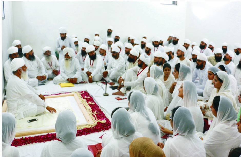
ਸ੍ਰੀ ਸਤਿਗੁਰੂ ਜੀ ਨੇ ਵਿਦਿਅਕ ਜਥਿਆ ਦੇ ਸੰਮੇਲਨ ਦੌਰਾਨ ਸ੍ਰੀ ਸਤਿਗੁਰੂ ਜਗਜੀਤ ਸਿੰਘ ਜੀ ਦੇ ਪ੍ਰਵਚਨਾਂ ਨੂੰ ਇੰਗਲਿਸ਼ ਵਿੱਚ ਟਰਾਂਸਲੇਟ ਕੀਤੀ ਪੁਸਤਕ Sri Satguru Jagjit Singh Ji - Discourses ਰਲੀਜ਼ ਕਰਨ ਦੀ ਕ੍ਰਿਪਾ ਕੀਤੀ । ਸੰਮੇਲਨ ਦੌਰਾਨ ਹੀ ਸ੍ਰੀ ਸਤਿਗੁਰੂ ਜੀ ਦੀ ਹਜ਼ੂਰੀ ਵਿੱਚ ਹੋਈ ਮੀਟਿੰਗ ਸਮੇਂ ਹਿੰਸਾ ਲੈਂਦੇ ਪੜੇ ਲਿਖੇ ਨੌਜਵਾਨ ਅਤੇ ਬੀਬੀਆਂ ।