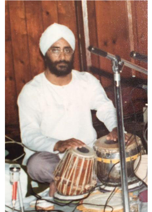
Dhami Ji on Tabla