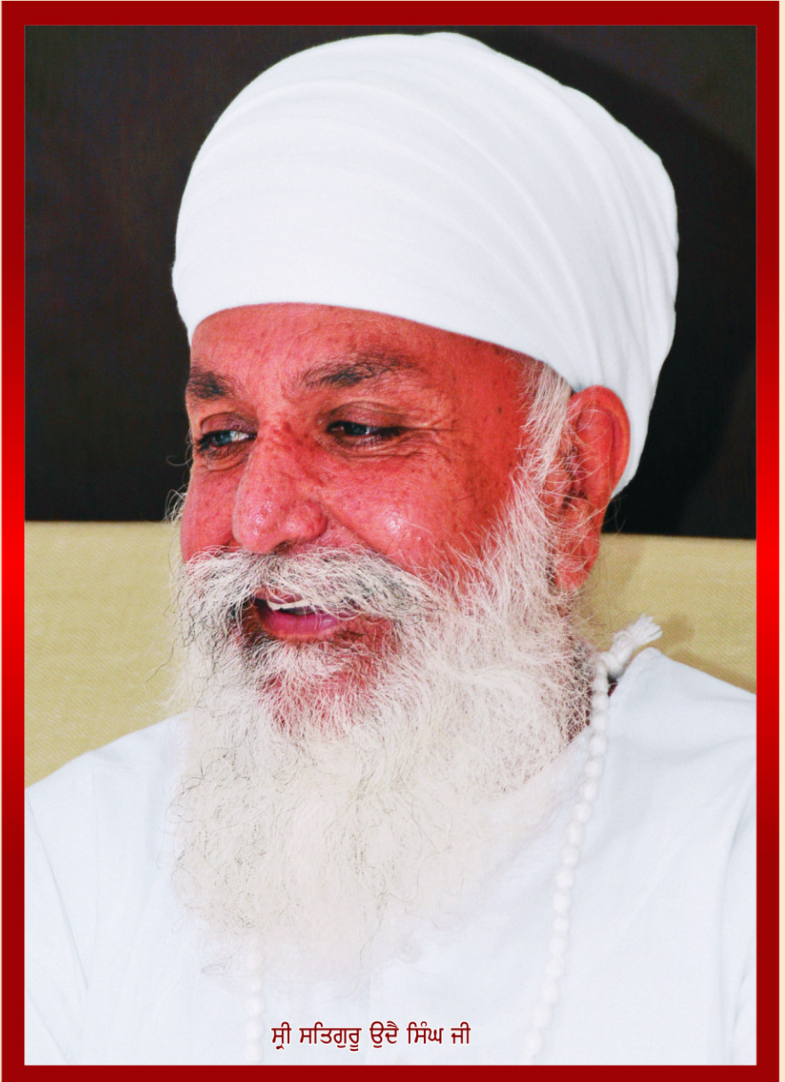
ਸ੍ਰੀ ਸਤਿਗੁਰੂ ਉਦੈ ਸਿੰਘ ਜੀ