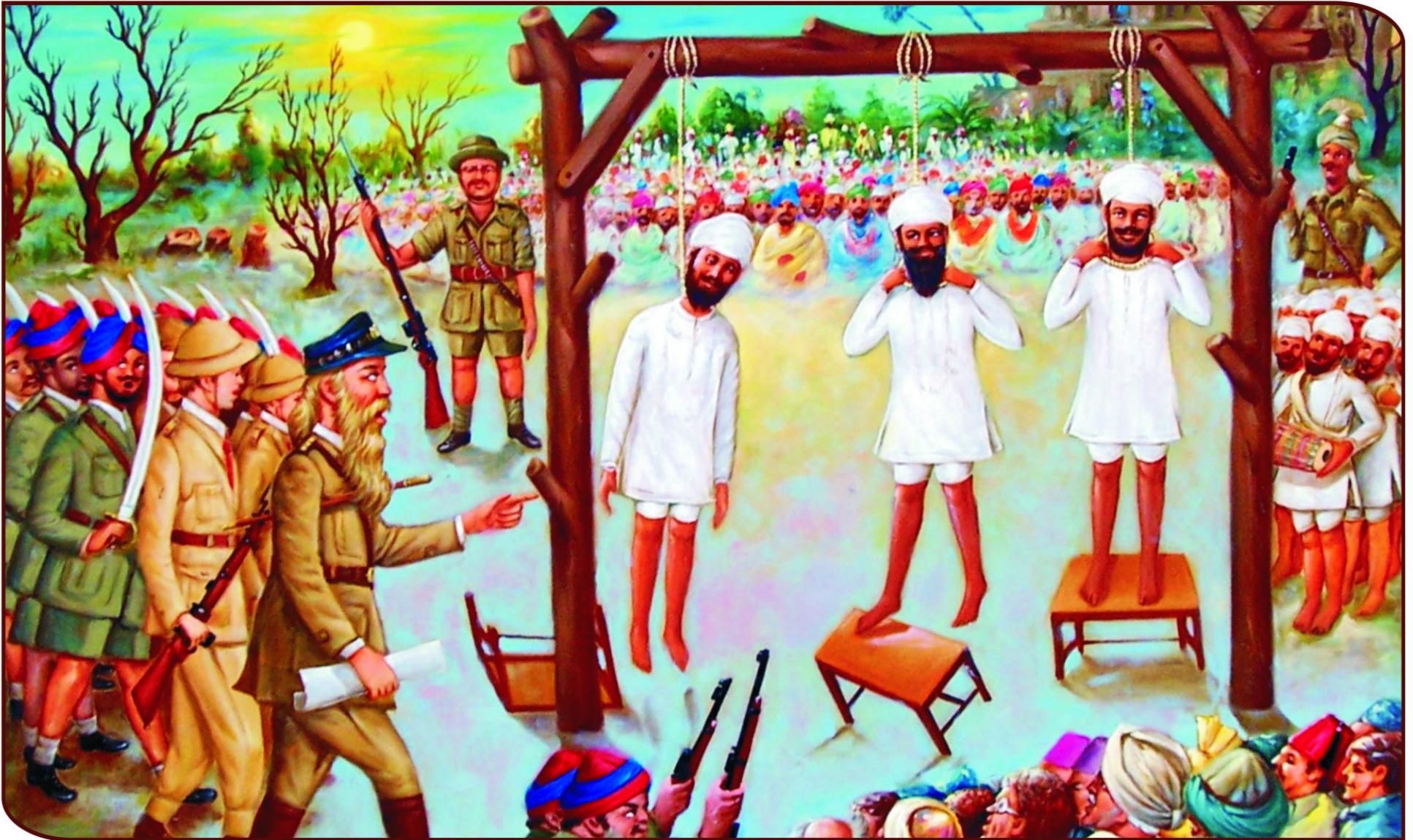
ਸਤਿਗੁਰੂ ਰਾਮ ਸਿੰਘ ਜੀ ਦੁਆਰਾ ਦੱਸੇ ਮਾਰਗ ਤੇ ਚਲਦਿਆ ਦੇਸ਼ ਦੀ ਆਜ਼ਾਦੀ ਅਤੇ ਗੁਰੂ ਦੀ ਰੱਖਿਆ ਹਿੱਤ ਆਪਣੀ ਜਾਨ ਨਿਛਾਵਰ ਕਰਨ ਵਾਲੇ ਤਿੰਨ ਮਹਾਨ ਯੋਧੇ ਸ਼ਹੀਦ ਸੰਤ ਗੁਰਮੁਖ ਸਿੰਘ, ਸੰਤ ਮੰਗਲ ਸਿੰਘ ਅਤੇ ਸੰਤ ਮਸਤਾਨ ਸਿੰਘ ਰਾਏਕੋਟ ਵਿਖੇ ਆਪਣੇ ਗਲਾਂ ਵਿੱਚ ਰੋਸ਼ਮੀ ਰੱਸੇ ਪਾ ਫਾਂਸੀ ਦੇ ਫੰਦਿਆ ਨੂੰ ਚੁੰਮਦੇ ਹੋਏ ।