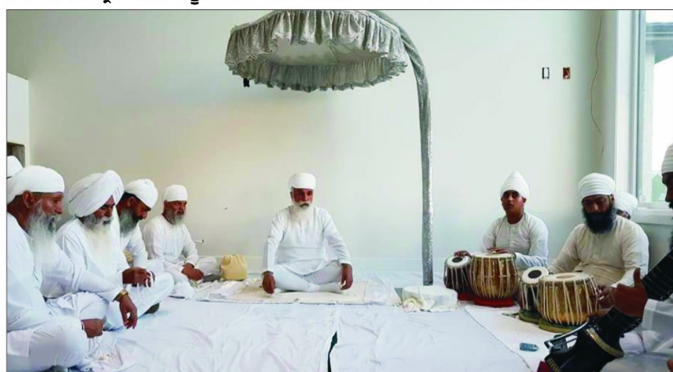
ਅਮਰੀਕਾ ਵਿਖੇ ਸ੍ਰੀ ਸਤਿਗੁਰੂ ਜੀ ਵਲੋਂ ਲੰਮੇ ਸਮੇਂ ਤੋਂ ਇੰਤਜਾਰ ਕਰਦੀ ਸੰਗਤ ਦੇ ਮਨਾਂ ਵਿੱਚ ਠੰਢ ਪਾਉਣ ਦੀ ਕਿਰਪਾ ।