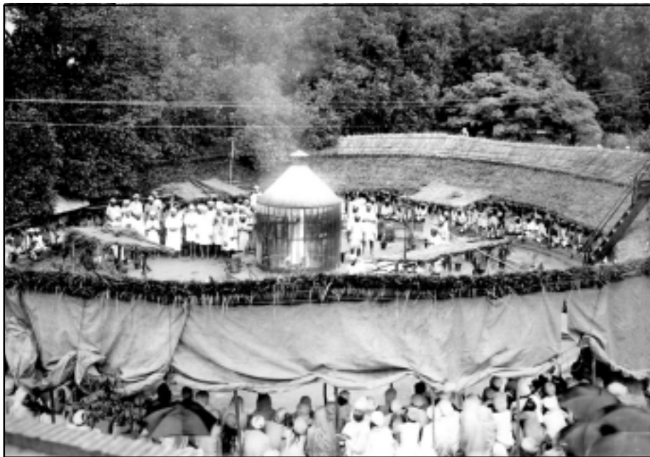
ਲਾਹੌਰ ਬੁੱਚੜਖਾਨਾ ਲੱਗਣ ਤੋਂ ਰੋਕਣ ਲਈ 1937 ਈ: ਵਿੱਚ ਸ੍ਰੀ ਭੈਣੀ ਸਾਹਿਬ ਵਿਖੇ ਕੀਤੇ ਗਏ ਮਹਾਨ ਯੱਗ ਦਾ ਇੱਕ ਦ੍ਰਿਸ਼।

ਉਸ ਪਰਮ ਦਿਆਲੂ ਤੇ ਕਿਰਪਾਲੂ ਸਤਿਗੁਰੂ ਪਾਸ ਜੋ ਵੀ ਥੋੜ੍ਹੀ ਜਿਹੀ ਵੀ ਸ਼ਰਧਾ ਲੈ ਕੇ ਆਇਆ, ਰੱਬ ਰੂਪ ਸਤਿਗੁਰੂ ਨੇ ਉਸ ਦੇ ਪਿਛਲੇ ਗੁਨਾਹ ਨਹੀਂ ਵੇਖੇ, ਮਿਹਰ ਦੀ ਨਜ਼ਰ ਨਾਲ ਸਭ ਪੁੱਠੀਆਂ ਲਿਖੀਆਂ ਲਕੀਰਾਂ ਸਿੱਧੀਆਂ ਕਰ ਦਿੱਤੀਆਂ।