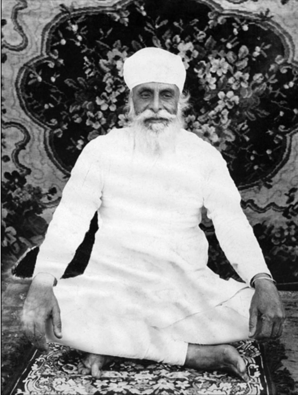
ਸ੍ਰੀ ਸਤਿਗੁਰੂ ਪ੍ਰਤਾਪ ਸਿੰਘ ਜੀ (1890-1959 ਈ.)