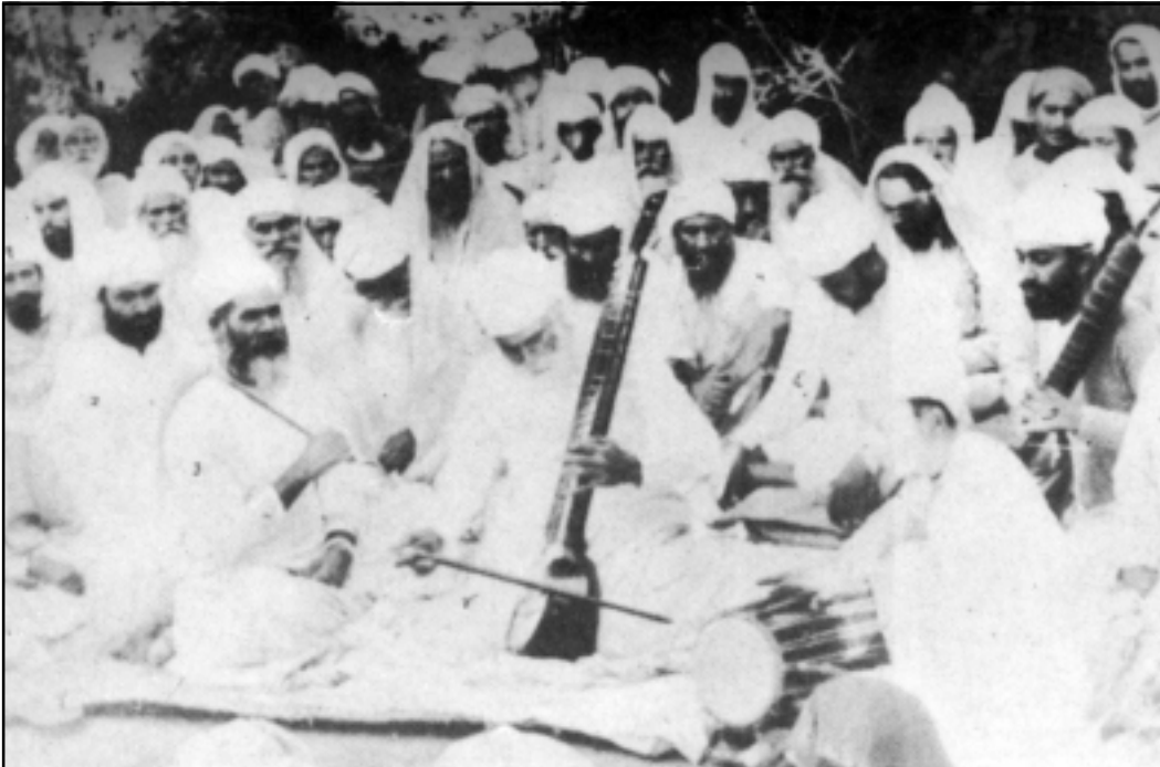
ਦਿਲਰੁਬਾ ਵਜਾਉਂਦੇ ਹੋਏ ਸ੍ਰੀ ਸਤਿਗੁਰੂ ਜੀ। ਸੱਜੇ ਪਾਸੇ ਸਾਥ ਦੇ ਰਹੇ ਹਨ, ਵਰਤਮਾਨ ਸਤਿਗੁਰੂ ਜਗਜੀਤ ਸਿੰਘ ਜੀ।

ਸ੍ਰੀ ਸਤਿਗੁਰੂ ਜੀ ਸੁਰ-ਤਾਲ ਲੈਅ ਨੂੰ ਬੜੀ ਬਾਰੀਕੀ ਨਾਲ ਪਰਖਦੇ ਸਨ। ਕਵੀ-ਦਰਬਾਰ, ਸੰਗੀਤ ਸੰਮੇਲਨ, ਕਰਕੇ ਆਪ ਕਲਾਕਾਰਾਂ ਨੂੰ ਖਾਸ ਉਤਸ਼ਾਹ ਦਿੰਦੇ ਅਤੇ ਚੰਗੀ