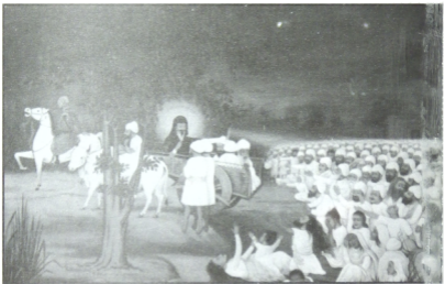
ਸ੍ਰੀ ਸਤਿਗੁਰੂ ਰਾਮ ਸਿੰਘ ਜੀ ਨੂੰ ਦੇਸ਼ ਨਿਕਾਲਾ, "ਇਕ ਨਾ ਬੁਝਣ ਵਾਲੀ ਜਵਾਲਾ"