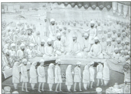
ਸ੍ਰੀ ਸਤਿਗੁਰੂ ਰਾਮ ਸਿੰਘ ਜੀ ਨੇ ਸਾਦਾ ਤੇ ਸਸਤੇ ਅੰਤਰਜਾਤੀ ਅਨੰਦ-ਵਿਆਹਾਂ ਦੀ ਰਸਮ ਪਿੰਡ ਖੋਟੇ (ਜਿ: ਫਰੀਦਕੋਟ) ਵਿਖੇ ਹਾੜ ਵਦੀ ਦੂਜ, 1920 ਬਿ: (3 ਜੂਨ, 1863 ਈ:) ਨੂੰ ਤੋਰਿਆ।