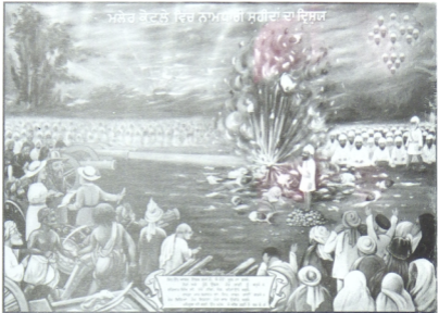
ਮਲੇਰਕੋਟਲੇ ਦੇ ਰਕੜ ਵਿੱਚ 17-18 ਜਨਵਰੀ ਸੰਨ 1872 ਈ: ਨੂੰ 66 ਨਾਮਧਾਰੀ ਸੂਰਬੀਰ ਸਿੰਘਾਂ ਨੇ ਤੋਪਾਂ ਸਾਂਹਵੇ ਖੜਕੇ, ਛਾਤੀਆਂ ਤਾਣ ਕੇ ਸ਼ਹੀਦੀ ਜਾਮ ਪੀਤੇ ।