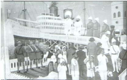
ਸ੍ਰੀ ਸਤਿਗੁਰੂ ਰਾਮ ਸਿੰਘ ਜੀ ਨੂੰ ਕਲਕੱਤੇ ਤੋਂ ਸਮੁੰਦਰੀ ਜਹਾਜ਼ ਰਾਹੀਂ ਰੰਗੂਨ (ਬਰਮਾ) ਜਲਾਵਤਨ ਕਰਨ ਦੀ ਤਸਵੀਰ