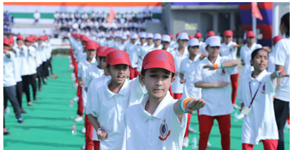
Bishanians Displayed self Defence Technique