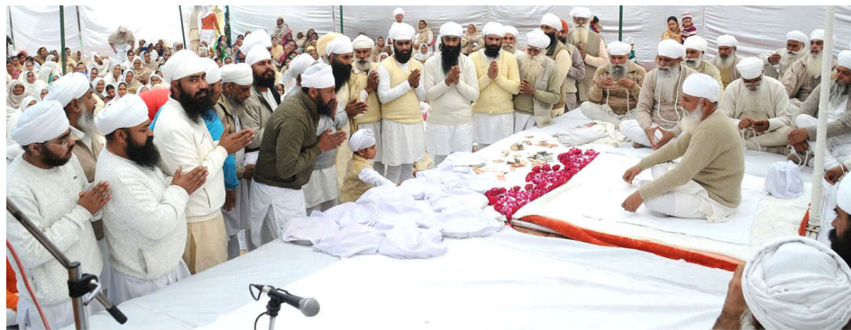
ਰਾਮਪੁਰਾ ਫੂਲ ਮੇਲੇ ਦੀ ਸੇਵਾ ਕਰਾਉਣ ਵਾਲੇ ਨੌਜਵਾਨ ਸ੍ਰੀ ਸਤਿਗੁਰੂ ਜੀ ਤੋਂ ਬਖਸ਼ਿਸ਼ ਮੰਗਦੇ ਹੋਏ।