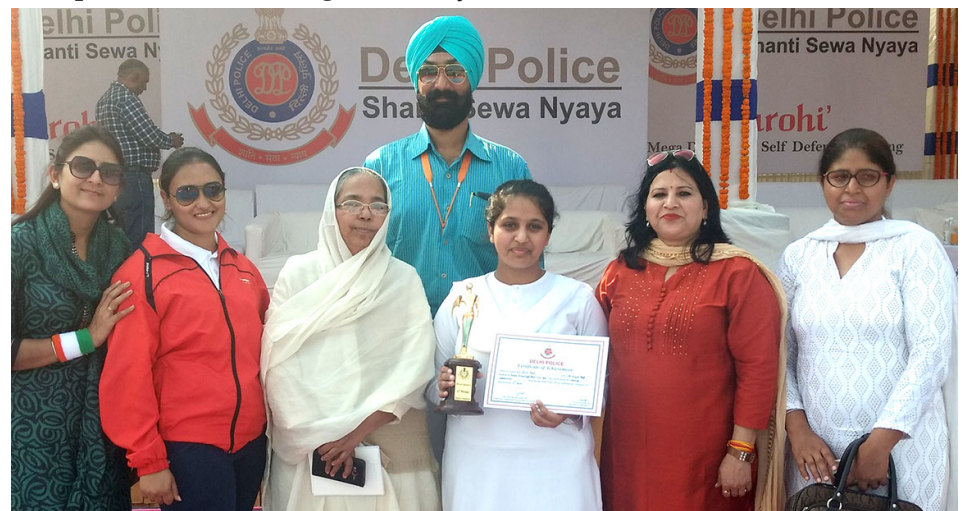
SBSM Team of Self Defence.