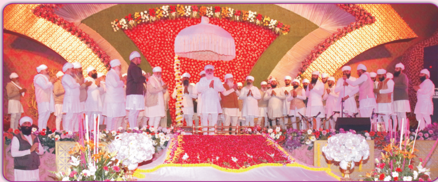
ਦਿੱਲੀ ਵਿਖੇ ਮਨਾਏ ਬਸੰਤ ਪੰਚਮੀ ਮੇਲੇ ਸਮੇਂ ਸਾਧ-ਸੰਗਤ ਸ੍ਰੀ ਸਤਿਗੁਰੂ ਜੀ ਦੇ ਦਰਸ਼ਨਾਂ ਦਾ ਆਨੰਦ ਮਾਣਦੀ ਹੋਈ ।