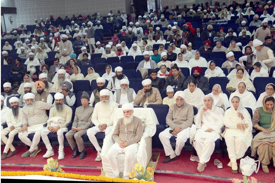
ਸ੍ਰੀ ਸਤਿਗੁਰੂ ਜੀ ਅਤੇ ਦਰਸ਼ਕ ਸੰਗੀਤ ਸੰਮੇਲਨ ਦਾ ਅਨੰਦ ਮਾਣਦੇ ਹੋਏ।