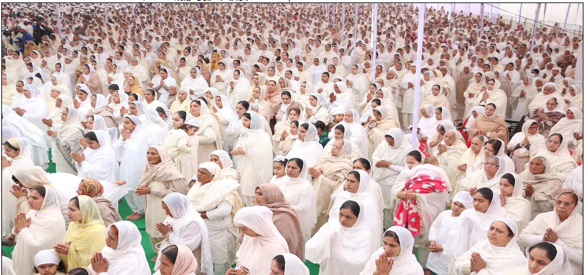
ਹੋਲੇ ਮਹੱਲੇ 2017 ਦੇ ਆਖਰੀ ਦਿਨ ਆਪਣੀ ਹਾਜ਼ਰੀ ਲੁਆਉਂਦੀਆਂ ਬੀਬੀਆਂ।