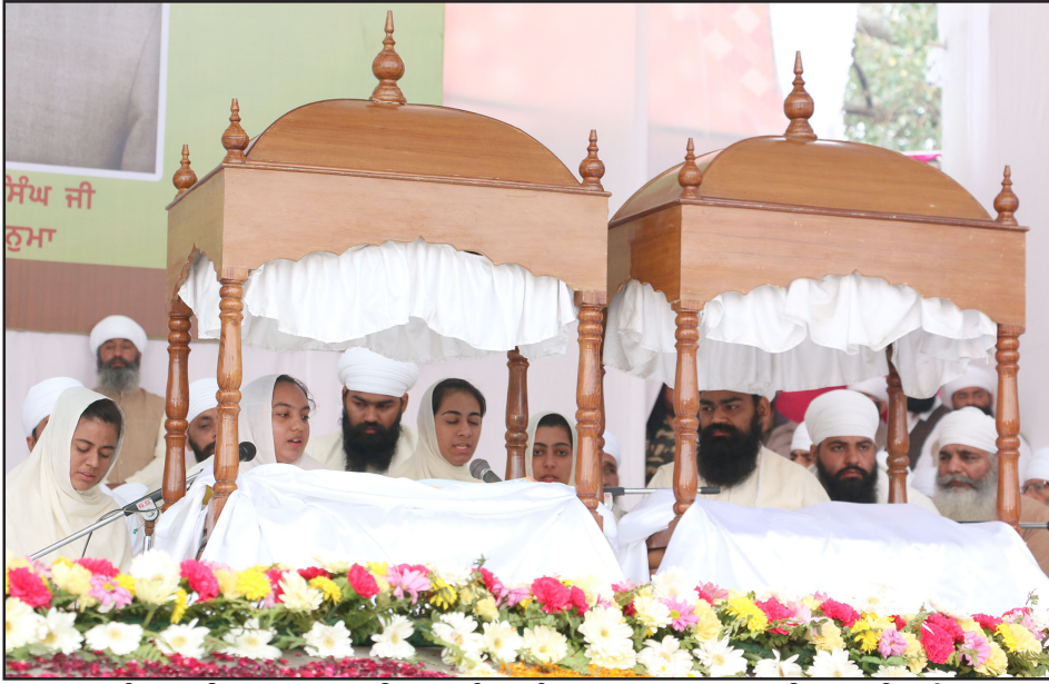
ਸ੍ਰੀ ਆਦਿ ਗ੍ਰੰਥ ਸਾਹਿਬ ਜੀ ਸ੍ਰੀ ਦਸਮ ਗ੍ਰੰਥ ਸਾਹਿਬ ਜੀ ਦੇ ਪਾਠਾਂ ਦੇ ਭੋਗ ਪਾਉਂਦੇ ਪਾਠੀ ਸਿੰਘ।

ਉਡਯੋ ਏਕ ਬਰ ਹੀ ਗੁਲਾਲ ਲਾਲ ਘਟਾ ਮਨੋ ਰੰਗਨ ਕੀ ਬੁੰਦ ਬਰਖਤ ਚੀਨਿਉ। ਰੰਗਦਾਰ ਅੰਬਰ ਕੈ, ਰੰਗਦਾਰ ਅੰਬਰ ਕੈ ਮੂਠ ਭਰ ਮਾਰੇ ਰੰਗ, ਡਾਰਤ ਨਵੀਨਿਉ।। ਇਸ ਤਰ੍ਹਾਂ ਗੁਰੂ ਗੋਬਿੰਦ ਸਿੰਘ ਜੀ ਆਪ ਸਿੰਘ ਸੂਰਮਿਆਂ ਨਾਲ ਹੋਲੀ ਖੇਡਦੇ। ਸ੍ਰੀ ਗੁਰੂ ਗੋਬਿੰਦ ਸਿੰਘ ਜੀ ਤੋਂ ਬਾਅਦ ਸ੍ਰੀ ਸਤਿਗੁਰੂ ਰਾਮ ਸਿੰਘ ਜੀ ਨੇ ਇਸ ਪ੍ਰੰਪਰਾ ਨੂੰ ਤੋਰਿਆ।। ਉਹਨਾਂ ਨੇ ਸਭ ਤੋਂ ਪਹਿਲਾਂ ਸਿਖੀ ਨੂੰ ਮੁੜ ਸੁਰਜੀਤ ਕਰਕੇ ਹੋਲੇ ਦੀ ਮਹਾਨਤਾ ਨੂੰ ਵਧਾਇਆ।