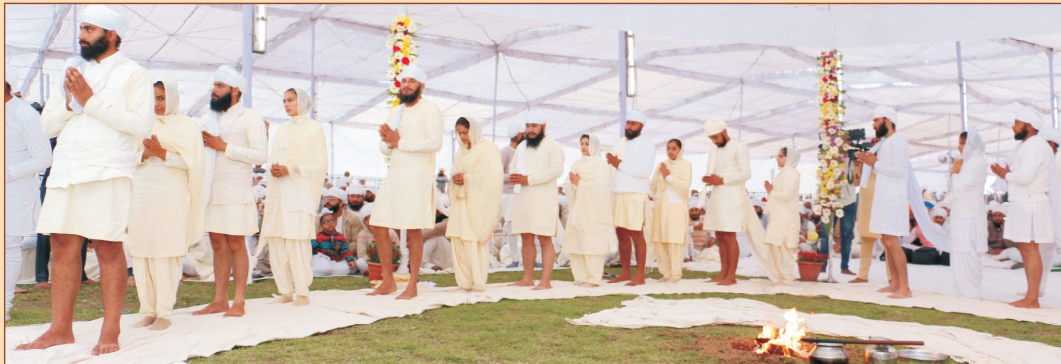
ਸ੍ਰੀ ਸਤਿਗੁਰੂ ਰਾਮ ਸਿੰਘ ਜੀ ਦੀ ਦੱਸੀ ਮਰਿਯਾਦਾ ਅਤੇ ਦਾਜ ਦਰੋਜ ਰਹਿਤ ਹੋਏ 11 ਅਨੰਦ ਕਾਰਜਾਂ ਦਾ ਦ੍ਰਿਸ਼ - 16 ਮਾਰਚ 2017 ਸ੍ਰੀ ਭੈਣੀ ਸਾਹਿਬ