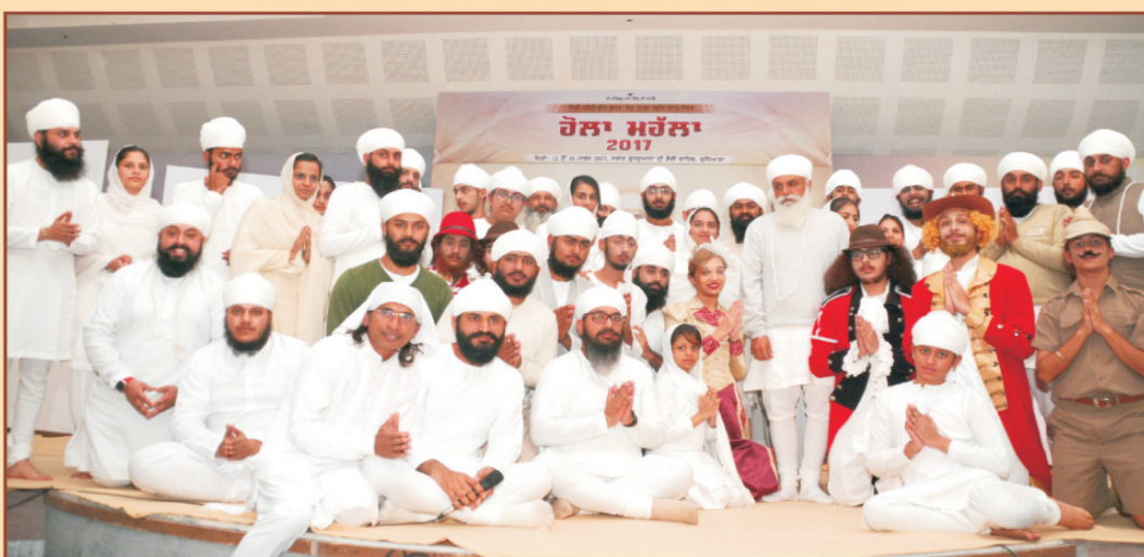
ਹੋਲੇ ਮਹੱਲੇ ਸਮੇਂ ਨਾਟਕ ਦੌਰਾਨ ਬਾਈਲੈਂਡ ਦੀ ਸੰਗਤ ਨੇ 'ਸਤਿਗੁਰੂ ਰਾਮ ਸਿੰਘ ਜੀ ਦਾ ਵਿਛੋੜਾ' ਬੜੇ ਮਾਰਮਿਕ ਢੰਗ ਨਾਲ ਸਾਧ-ਸੰਗਤ ਸਾਹਮਣੇ ਪੇਸ਼ ਕੀਤਾ । ਉਸ ਵਿੱਚ ਹਿੱਸਾ ਲੈਣ ਵਾਲੇ ਸਿੰਘ ਅਤੇ ਬੀਬੀਆਂ ਨਾਲ ਸ੍ਰੀ ਸਤਿਗੁਰੂ ਜੀ ।