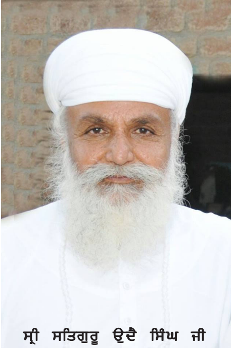
ਸ੍ਰੀ ਸਤਿਗੁਰੂ ਉਦੈ ਸਿੰਘ ਜੀ

ਕਰੋੜਾਂ ਹਿਰਦਿਆਂ ਦੇ ਸਮਰਾਟ, ਕੁਲ ਸ਼ਿਸ਼ਟੀ ਦੇ ਮਾਲਕ ਸ੍ਰੀ ਸਤਿਗੁਰੂ ਜਗਜੀਤ ਸਿੰਘ ਜੀ ਨੇ 13 ਦਸੰਬਰ 2012 ਨੂੰ ਆਪਣੀ ਰਜਾ ਅਨੁਸਾਰ ਆਪਣੇ ਸਰੀਰ ਨੂੰ ਸਮੇਟ ਲਿਆ। ਹਰ ਪਾਸੇ ਸੁੰਨ, ਸੰਨਾਟਾ ਛਾ ਗਿਆ। ਕਿਸੇ ਦੀ ਰਸਨਾ ਤੇ ਕੋਈ ਬੋਲ ਨਹੀਂ ਸਨ ਨਿਕਲ ਰਹੇ। ਬੱਸ ਅੱਖਾਂ ਚੋਂ ਹੰਝੂ ਨਿਕਲ ਰਹੇ ਸਨ। ਪੰਛੀਆਂ, ਜਾਨਵਰਾਂ ਨੇ ਵੀ ਚੁੱਪ ਵੱਟ ਲਈ ਸੀ। ਇੰਜ ਜਾਪੇ ਕਿ ਇਕ ਯੁਗ ਦਾ ਅੰਤ ਹੋ ਗਿਆ ਹੈ। ਦਿਮਾਗ ਸੁੰਨ ਸਨ। ਅਗੇ ਪਿਛੇ ਕੁਝ ਨਜ਼ਰ ਨਹੀਂ ਸੀ ਆ ਰਿਹਾ। ਹਰ ਕੋਈ ਇਹੀ ਸੋਚੇ ਕਿ ਹੁਣ ਸਾਡਾ ਜਿਉਣਾ ਵਿਅਰਥ ਹੈ।