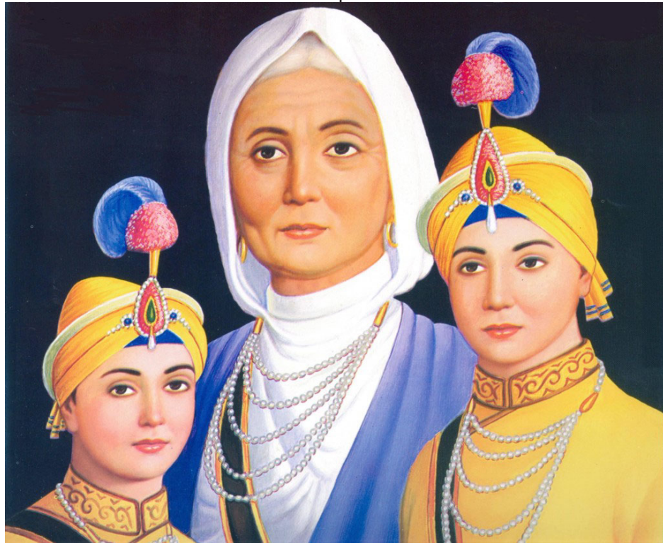
ਛੋਟੇ ਸਾਹਿਬਜ਼ਾਦੇ ਮਾਤਾ ਗੁਜਰੀ ਜੀ ਨਾਲ