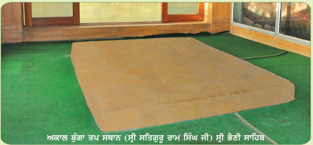
ਅਕਾਲ ਬੁੰਗਾ ਤਪ ਸਥਾਨ (ਸ੍ਰੀ ਸਤਿਗੁਰੂ ਰਾਮ ਸਿੰਘ ਜੀ) ਸ੍ਰੀ ਭੈਣੀ ਸਾਹਿਬ