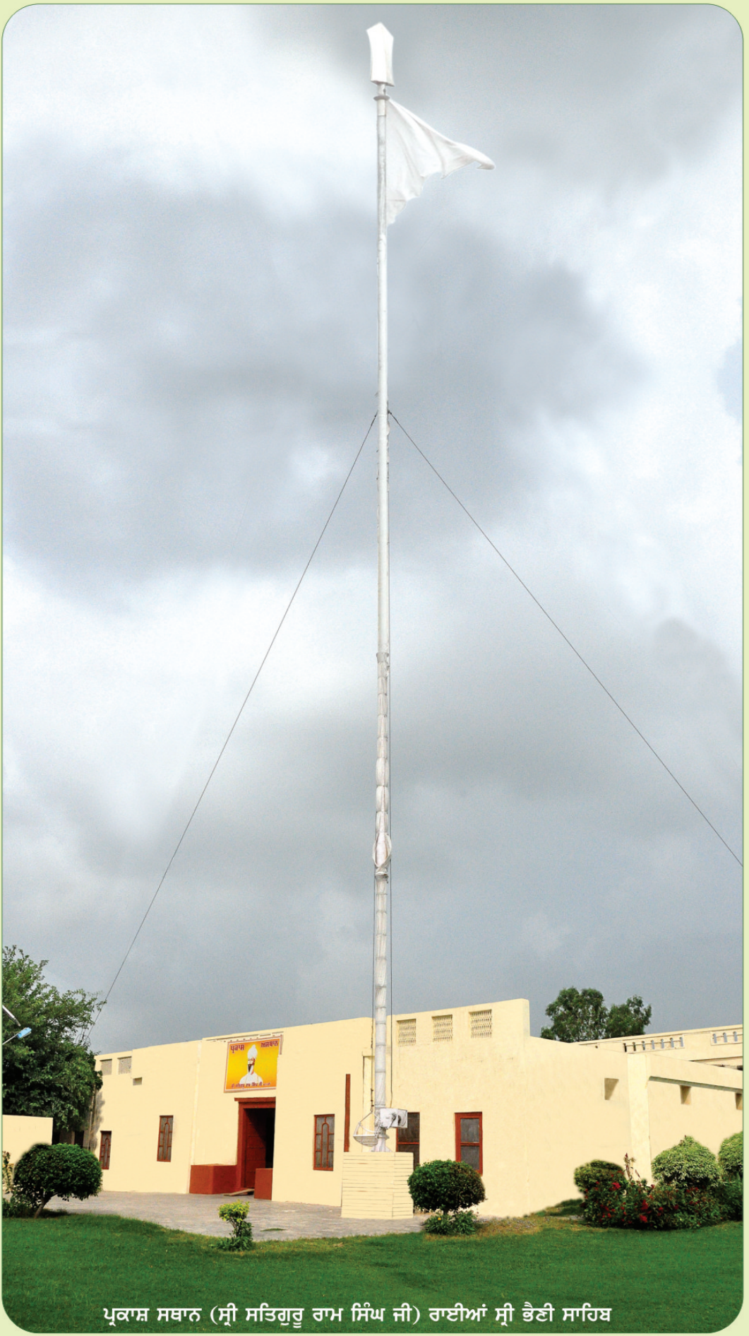
ਪ੍ਰਕਾਸ਼ ਸਥਾਨ (ਸ੍ਰੀ ਸਤਿਗੁਰੂ ਰਾਮ ਸਿੰਘ ਜੀ) ਰਾਈਆਂ ਸ੍ਰੀ ਭੈਣੀ ਸਾਹਿਬ