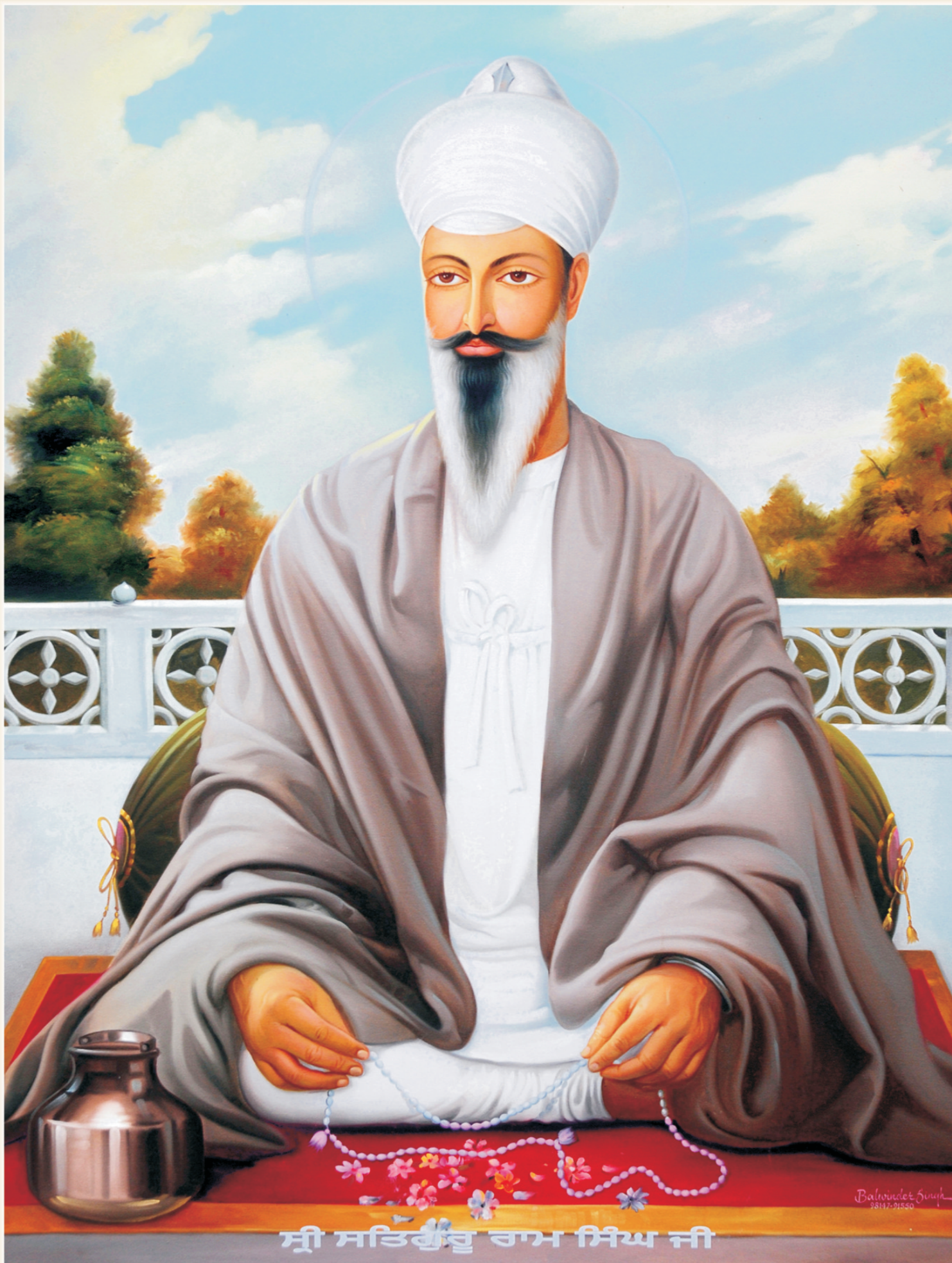
ਸ੍ਰੀ ਸਤਿਗੁਰੂ ਰਾਮ ਸਿੰਘ ਜੀ