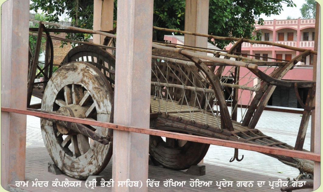
ਰਾਮ ਮੰਦਰ ਕੰਪਲੈਕਸ (ਸ੍ਰੀ ਭੈਣੀ ਸਾਹਿਬ) ਵਿੱਚ ਰੱਖਿਆ ਹੋਇਆ ਪ੍ਰਦੇਸ ਗਵਨ ਦਾ ਪ੍ਰਤੀਕ ਗੱਡਾ