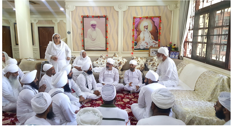
ਸ੍ਰੀ ਸਤਿਗੁਰੂ ਜੀ ਦੇ ਦਰਸ਼ਨ ਕਰਨ ਆਏ ਗੁਰਦੁਆਰਾ ਸਿੰਘ ਸਭਾ (ਬੰਕੋਕ) ਦੇ ਰਾਗੀ ਸਿੰਘ।

- ਹਮ ਘਰਿ ਸਾਜਨ ਆਏ ਸਾਰੇ ਮੇਲ ਮਿਲਾਏ।। - ਲਾਲ ਮੇਰੇ ਆਏ ਹੈਂ।।