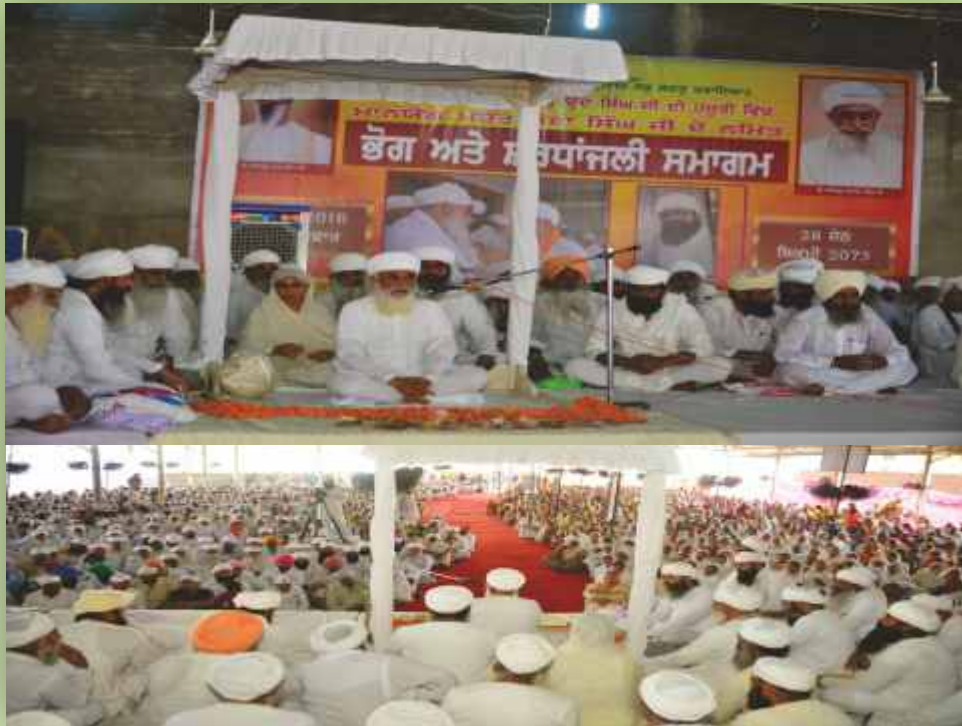
ਸਤਿਗੁਰੂ ਜੀ ਪ੍ਰਵਚਨ ਕਰਦੇ ਹੋਏ