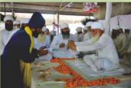
ਗੁਰੂ ਕੀਆਂ ਲਾਡਲੀਆਂ ਫ਼ੌਜਾਂ: ਨਿਹੰਗ ਸਿੰਘ ਸਮਾਗਮ 'ਚ ਹਾਜ਼ਰੀ ਭਰਦੇ ਹੋਏ