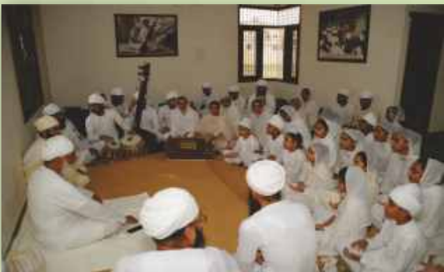
ਕਲਾ ਕੇਂਦਰ ਸ੍ਰੀ ਭੈਣੀ ਸਾਹਿਬ ਦੇ ਬੱਚਿਆਂ ਨਾਲ ਸ੍ਰੀ ਸਤਿਗੁਰੂ ਜੀ