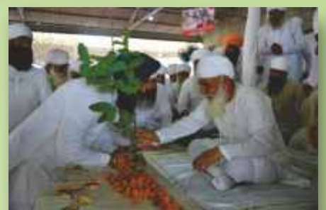
ਸਤਿਗੁਰੂ ਜੀ ਬੂਟਿਆਂ ਦਾ ਪ੍ਰਸ਼ਾਦ ਵੰਡਦੇ ਹੋਏ