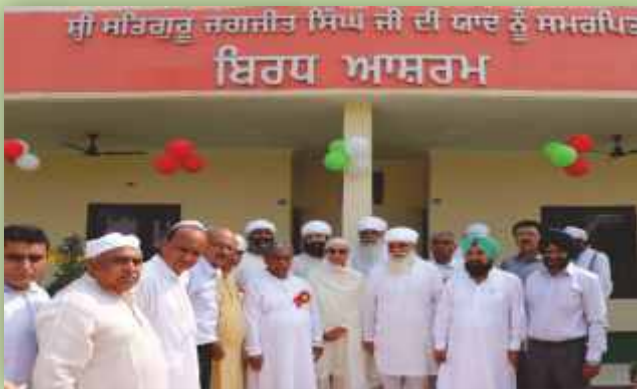
ਰਾਜਪੁਰਾ ਵਿਖੇ ਬਿਰਧ ਆਸ਼ਰਮ ਦੇ ਉਦਘਾਟਨ ਸਮੇਂ (ਰਿਪੋਰਟ ਸਫ਼ਾ 23 ਤੇ)