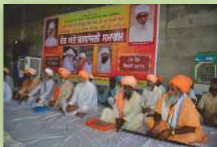
ਸੰਤ-ਸਮਾਜ ਦੀ ਸਮਾਗਮ ਵਿਚ ਹਾਜ਼ਰੀ