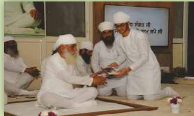
ਸ੍ਰੀ ਸਤਿਗੁਰੂ ਜੀ ਹੋਣਹਾਰ ਬੱਚਿਆਂ ਨੂੰ ਨਿਵਾਜ਼ਦੇ ਹੋਏ (ਰਿਪੋਰਟ ਸਫ਼ਾ 24 ਤੇ)