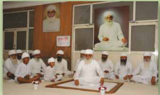
ਦਸਤਾਰ ਸਜਾਉਣ ਤੋਂ ਬਾਅਦ ਸਤਿਗੁਰੂ ਜੀ ਦੇ ਚਰਨਾਂ ਵਿੱਚ