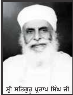
ਸ੍ਰੀ ਸਤਿਗੁਰੂ ਪ੍ਰਤਾਪ ਸਿੰਘ ਜੀ

ਸ਼ੇਖੂਪੁਰੇ ਸੰਨ 1947 ਦੇ ਹੋਏ ਹੋਲੇ ਸਮੇਂ ਸ੍ਰੀ ਸਤਿਗੁਰੂ ਪ੍ਰਤਾਪ ਸਿੰਘ ਜੀ ਨੇ ਸਾਧ-ਸੰਗਤ ਵਿੱਚ ਖੜੋਕੇ ਇਹ ਆਪਣੇ ਮੁਖਾਰ-ਬਿੰਦ ਤੋਂ ਐਲਾਨ ਕੀਤਾ “ਆਪਣੇ ਬਾਲ-ਬੱਚਿਆਂ ਨੂੰ ਬਚਾਉਣ ਲਈ ਰਾਵੀ ਦਰਿਆ ਤੋਂ ਪਾਰ ਹੋ ਜਾਉ ਤੇ ਆਪਣਾ ਘਰਬਾਰ ਵੇਚ ਕੇ ਮਾਇਆ ਵੀ ਬਚਾ ਲਉ।” ਇਹ ਖਬਰਾਂ ਸੁਣ ਕੇ ਸਭ ਦਾ ਧਿਆਨ