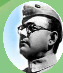
ਸੁਭਾਸ਼ ਚੰਦਰ ਬੋਸ