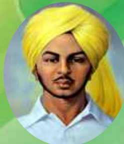
ਸ਼ਹੀਦ ਭਗਤ ਸਿੰਘ