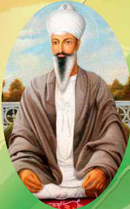
ਸ੍ਰੀ ਸਤਿਗੁਰੂ ਰਾਮ ਸਿੰਘ ਜੀ