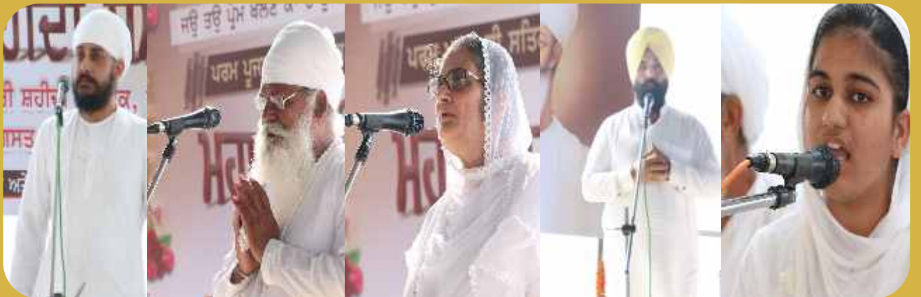
ਰਾਏਕੋਟ ਮੇਲੇ ਤੇ ਵੱਖ-ਵੱਖ ਬੁਲਾਰੇ ਸ਼ਹੀਦਾਂ ਨੂੰ ਸ਼ਰਧਾਂਜਲੀ ਦਿੰਦੇ ਹੋਏ।