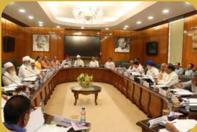
ਸ੍ਰੀ ਸਤਿਗੁਰੂ ਰਾਮ ਸਿੰਘ ਜੀ ਦੇ 200 ਸਾਲਾ ਨੂੰ ਰਾਸਟਰੀ ਪੱਧਰ ਤੇ ਮਨਾਉਣ ਸੰਬੰਧੀ ਭਾਰਤ ਸਰਕਾਰ ਨਾਲ ਮੀਟਿੰਗ।