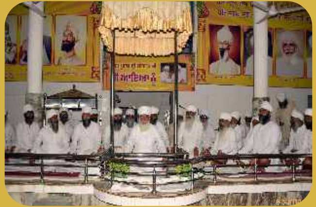
ਸ੍ਰੀ ਸਤਿਗੁਰੂ ਜੀ ਐਲਨਾਵਾਦ ਵਿਖੇ ਜੱਪ ਪ੍ਰਯੋਗ ਦੇ ਸ਼ੁਭ ਆਰੰਭ ਤੇ ਦਰਸ਼ਨ ਦਿੰਦੇ ਹੋਏ।