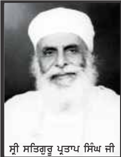
ਸ੍ਰੀ ਸਤਿਗੁਰੂ ਪ੍ਰਤਾਪ ਸਿੰਘ ਜੀ