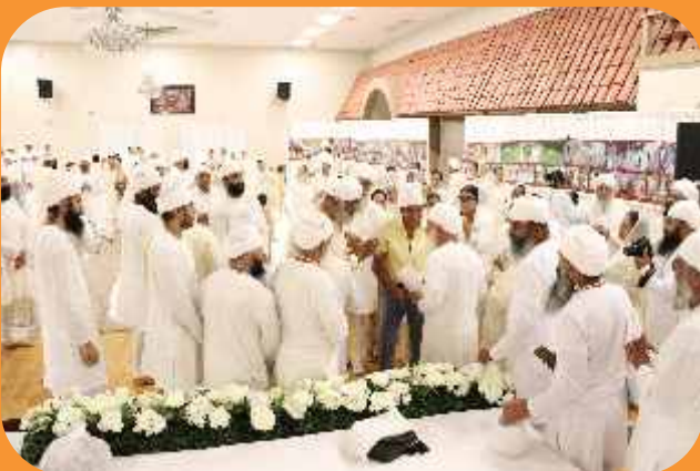
ਸ੍ਰੀ ਸਤਿਗੁਰੂ ਜੀ ਸਿੱਖਾਂ, ਸੇਵਕਾਂ ਨਾਲ ਬਚਨ ਬਿਲਾਸ ਕਰਦੇ ਹੋਏ।