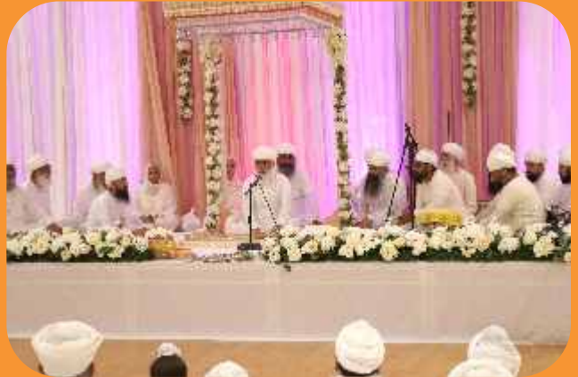
ਸ੍ਰੀ ਸਤਿਗੁਰੂ ਜੀ ਉਪਦੇਸ਼ ਦਿੰਦੇ ਹੋਏ।