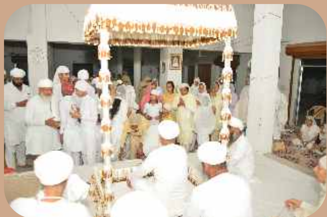
ਵੱਖ-ਵੱਖ ਸਥਾਨਾਂ ਤੇ ਨਾਮ ਸਿਮਰਨ ਜਪ-ਪ੍ਰਯੋਗ