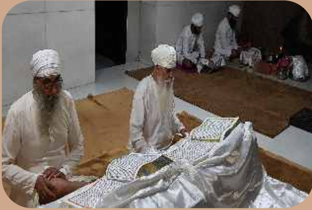
ਜਗਜੀਤ ਮੰਦਰ, ਸ੍ਰੀ ਭੈਣੀ ਸਾਹਿਬ ਅਖੰਡ ਪਾਠਾਂ ਦਾ ਦ੍ਰਿਸ਼