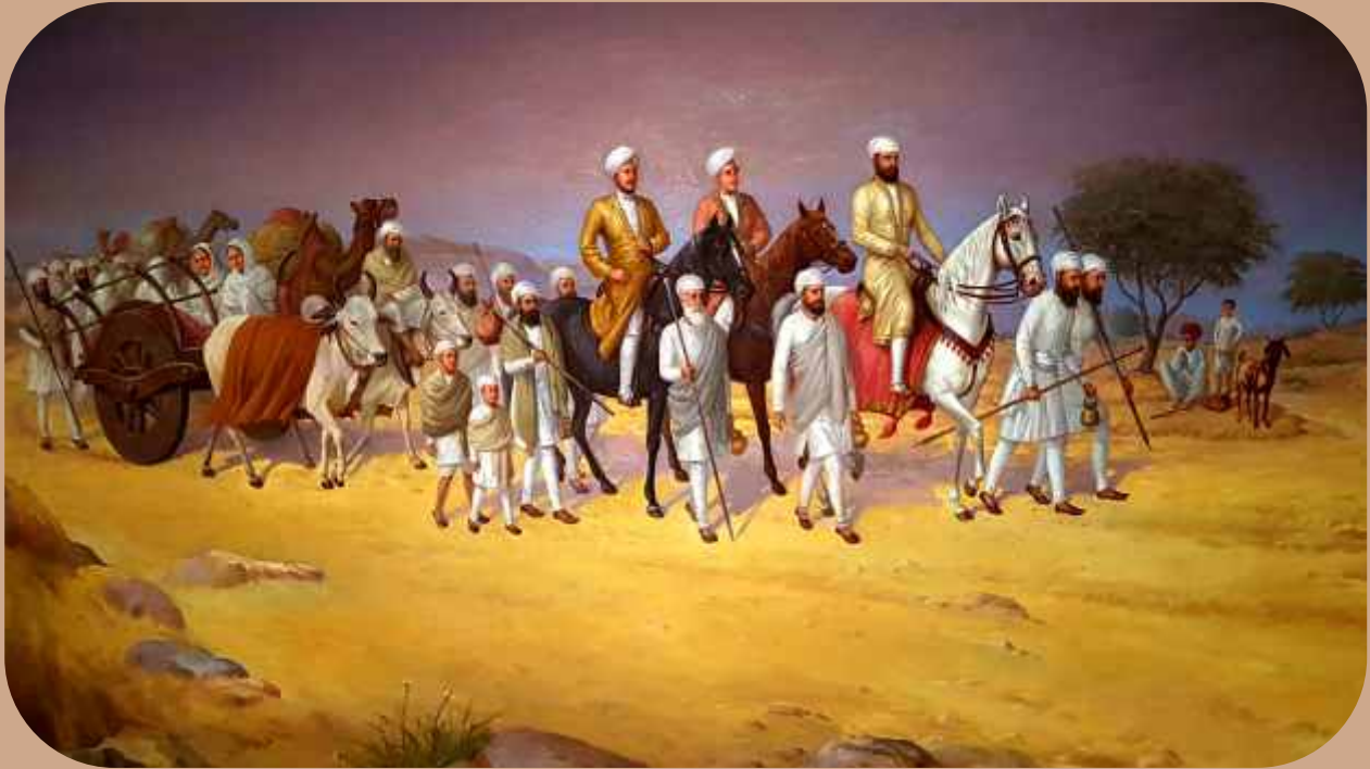
ਪੇਂਟਿੰਗ: ਸ੍ਰੀ ਸਤਿਗੁਰੂ ਪ੍ਰਤਾਪ ਸਿੰਘ ਜੀ ਸਿੱਖਾਂ ਸੇਵਕਾਂ, ਛੋਟੇ ਭਰਾਵਾਂ ਅਤੇ ਮਾਤਾਵਾਂ ਸਹਿਤ ਗੁਰੂਸਰ (ਗੱਦਾਂ ਡੋਬ-ਫਾਜ਼ਿਲਕਾ), ਜਾ ਰਹੇ ਅਟੱਲ ਪ੍ਰਤਾਪੀ ਜੀ ਦੀ ਜੰਝ ਦਾ ਅਲੌਕਿਕ ਦ੍ਰਿਸ਼। Painting By: R.M. Singh