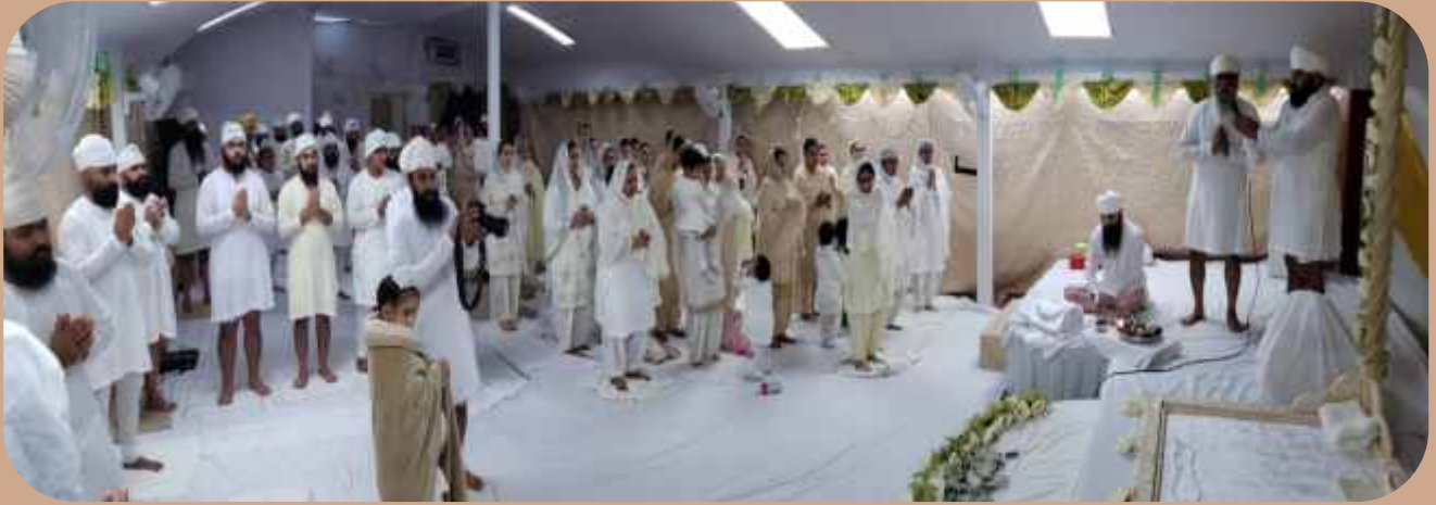
ਸਤੰਬਰ 2018 ਨਿਊਯਾਰਕ ਨਾਮ ਸਿਮਰਨ ਜਪ ਪ੍ਰਯੋਗ ਦੀ ਅਰੰਭਤਾ ਦੀ ਅਰਦਾਸ।