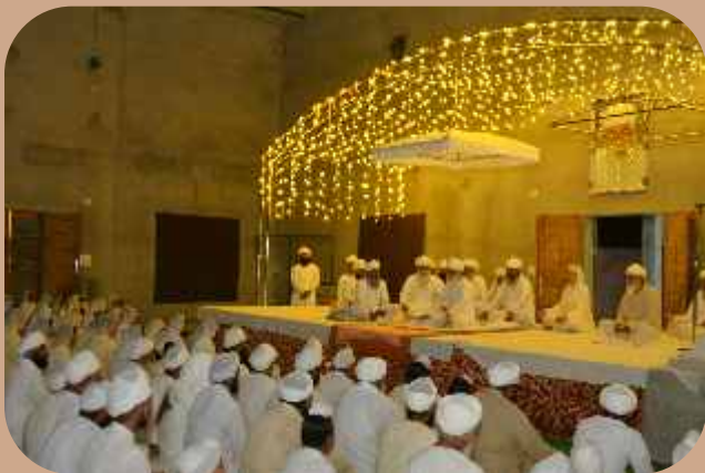
ਸ੍ਰੀ ਜੀਵਨ ਨਗਰ