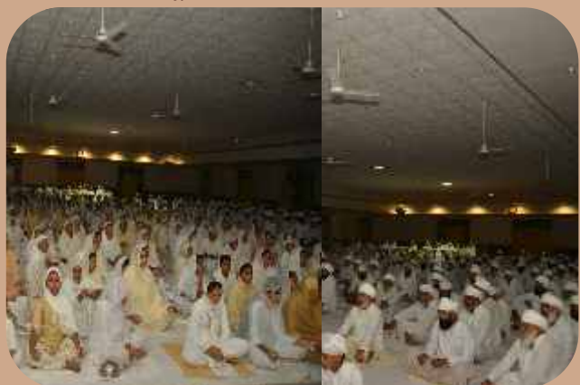
ਪ੍ਰਤਾਪ ਮੰਦਰ-ਸੰਤ ਨਗਰ