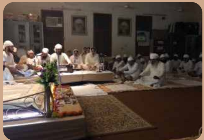
(ਹੈਦਰਾਬਾਦ ) ਅਤੇ (ਜੰਮੂ)