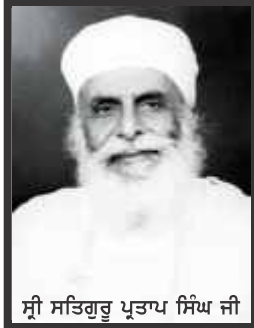
ਸ੍ਰੀ ਸਤਿਗੁਰੂ ਪ੍ਰਤਾਪ ਸਿੰਘ ਜੀ

ਇਸ ਦੌਰੇ ਸਮੇਂ ਸਤਿਗੁਰੂ ਜੀ ਨੇ ਕੁਝ ਦਿਨਾਂ ਲਈ ਲੰਪਾਛ ਤੇ ਚੰਗਮਈ ਦੀ ਸੰਗਤ ਨੂੰ ਵੀ ਦਰਸ਼ਨ ਦੇਣ ਦੀ ਕ੍ਰਿਪਾਲਤਾ ਕੀਤੀ। ਇਕ ਦਿਨ ਸ੍ਰੀ ਹਜ਼ੂਰ ਜੀ ਨੇ ਆਪਣੇ ਉਪਦੇਸ਼ਾਂ ਵਿੱਚ ਇਹ ਫੁਰਮਾਇਆ: “ਜੇ ਕੋਈ ਸਿੱਖ ਆਪਣੇ ਸਮੇਂ ਵਿਚੋਂ ਇੱਕ ਘੰਟਾ ਵਕਤ ਕੱਢ ਕੇ ਪੰਥਕ ਸੇਵਾ ਲਈ ਰੋਜ਼ ਪ੍ਰਤੀ ਲਾਵੇ ਤਾਂ ਕਿਤਨਾ ਫ਼ਾਇਦਾ ਹੋ ਸਕਦਾ ਹੈ।” ਪਰ ਇਸ ਵਾਸਤੇ ਬਹੁਤ ਘੱਟ ਧਿਆਨ ਦਿੱਤਾ ਗਿਆ ਹੈ। ਉਨ੍ਹਾਂ ਇਹ ਵੀ ਹੁਕਮ ਕੀਤਾ ਕਿ “ਇਸ ਕਮੇਟੀ ਦੇ ਜੋ ਮੈਂਬਰ ਬਣਾਏ ਗਏ ਹਨ, ਉਹ ਕਿਸੇ ਦੇ ਉੱਤੇ ਹੁਕਮ ਚਾੜ੍ਹਨ ਵਾਲੇ ਬਣ ਕੇ ਨਾ ਰਹਿਣ, ਜੇ ਹਕੂਮਤ ਕਰਨ ਵਾਲੇ ਬਣਨਗੇ ਤਾਂ ਫੇਰ ਕਿਸੇ ਨੇ ਨਹੀਂ ਪੁੱਛਣਾ, ਖਾਸ ਕਰਕੇ ਬੱਚਿਆਂ ਨੂੰ ਵਿਦਿਆ ਦੀ ਬੜੀ ਲੋੜ ਹੈ, ਇਸ ਪਾਸੇ ਜ਼ਰੂਰ ਧਿਆਨ ਦਿਉ।” ਇਨ੍ਹਾਂ ਦਿਨਾਂ ਵਿੱਚ ਸ੍ਰੀ ਸਤਿਗੁਰੂ ਜੀ ਸਰੀਰ ਦੀ ਕਮਜ਼ੋਰੀ ਕਰਕੇ ਕਈ ਵਾਰ ਨਿੱਤਨੇਮ ਆਪਣਾ ਵੱਖਰਾ ਡੇਰੇ ਵਿਖੇ ਹੀ ਕਰ ਲੈਂਦੇ ਤੇ ਬਚਨ ਕਰਦੇ, “ਹੁਣ ਚੋਖਾ ਚਿਰ ਨਹੀਂ ਬੈਠਾ ਜਾਂਦਾ।” ਇਹ ਸਭ ਕੁਝ ਜੋ ਆਪ ਫੁਰਮਾਇਆ, ਇਨ੍ਹਾਂ ਸਤਰਾਂ ਦਾ ਲੇਖਕ ਵੀ ਪਾਸ ਹੀ ਬੈਠਾ ਹੁੰਦਾ ਸੀ।