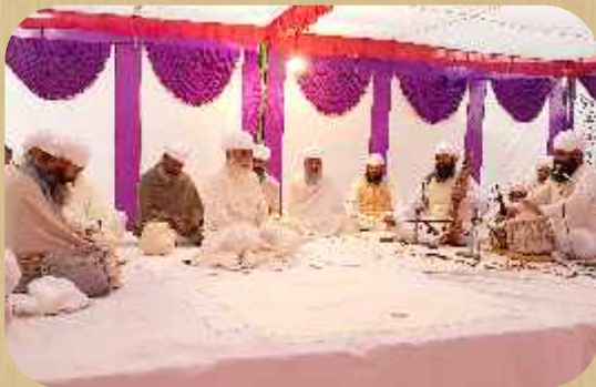
ਸੁਹੇਵਾ ਸਾਹਿਬ ਵਿਖੇ ਆਸਾ ਦੀ ਵਾਰ ਦੌਰਾਨ ਸ੍ਰੀ ਸਤਿਗੁਰੂ ਜੀ ਦਰਸ਼ਨ ਦਿੰਦੇ ਹੋਏ।