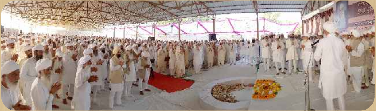
ਮਸਤਾਨਗੜ੍ਹ (ਸਿਰਸਾ) ਵਿਖੇ ਸਤਿਗੁਰੂ ਨਾਨਕ ਦੇਵ ਜੀ ਦੇ 550 ਵੇਂ ਪ੍ਰਕਾਸ਼ ਪੁਰਬ ਦੀ ਖੁਸ਼ੀ ਵਿੱਚ ਮੇਲਾ।