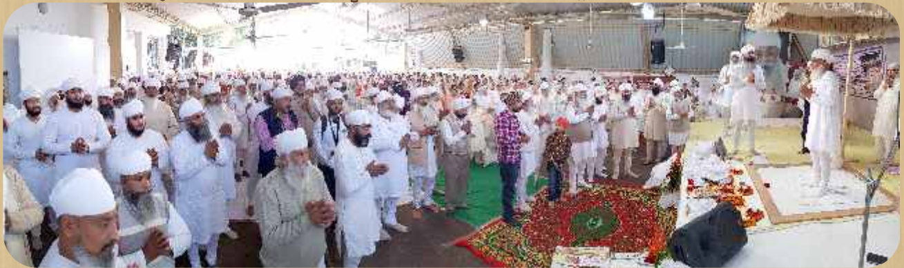
25 ਨਵੰਬਰ 2018: ਲੁਧਿਆਣਾ ਵਿਖੇ ਸ਼ਹੀਦੀ ਮੇਲੇ ਦਾ ਦਿਸ਼।