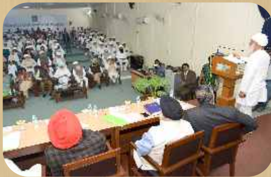
ਸ੍ਰੀ ਸਤਿਗੁਰੂ ਜੀ ਸੈਮੀਨਾਰ ਦੌਰਾਨ ਸੰਬੋਧਿਤ ਕਰਦੇ ਹੋਏ।