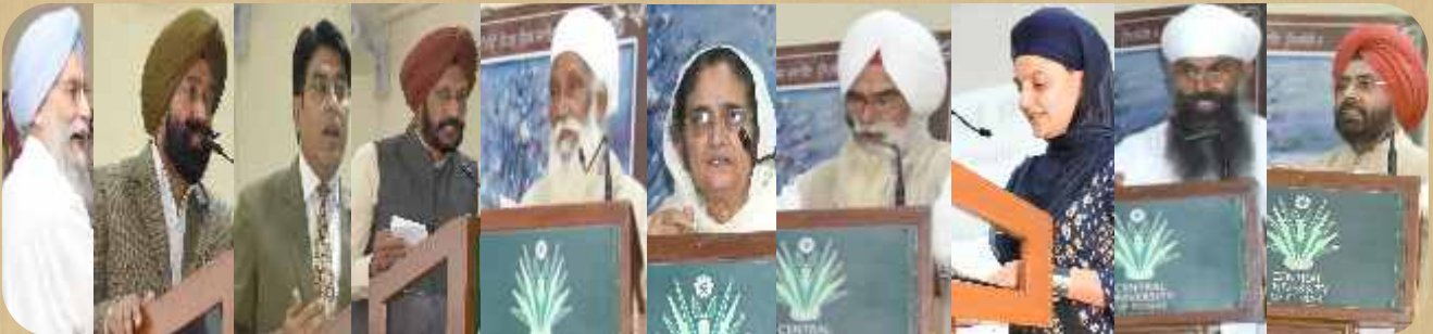
ਵੱਖ-ਵੱਖ ਬੁਲਾਰੇ ਸੈਮੀਨਾਰ ਦੌਰਾਨ ਸੰਬੋਧਨ ਕਰਦੇ ਹੋਏ।