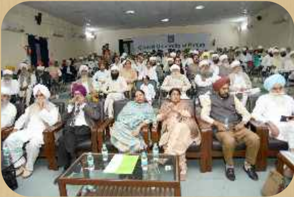
ਸੈਮੀਨਾਰ ਦੌਰਾਨ ਹਾਜ਼ਰੀਨ ਪਤਵੰਤੇ ਸੱਜਣ।