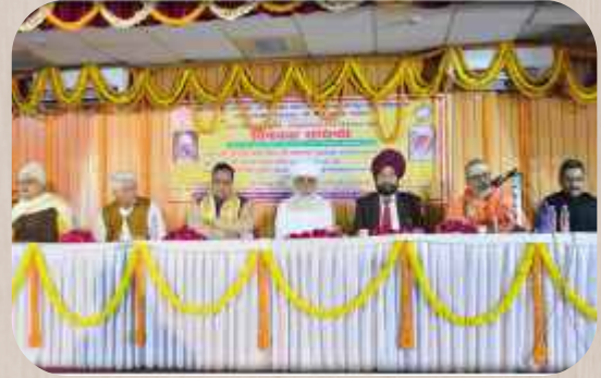
ਮੰਚ ਤੇ ਸੁਭਾਇਮਾਨ: ਸ੍ਰੀ ਸਤਿਗੁਰੂ ਜੀ, ਉਪ ਕੁਲਪਤੀ ਅਤੇ ਪਤਵੰਤੇ ਸੱਜਣ