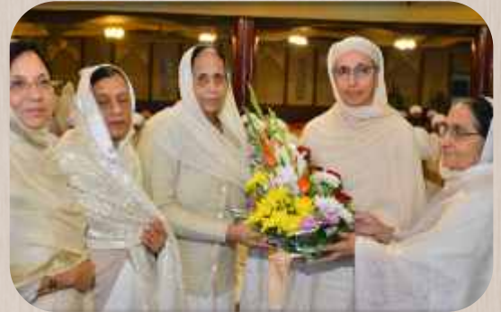
ਸ੍ਰੀ ਮਾਤਾ ਜੀ ਨੂੰ ਫੁੱਲ ਭੇਟ ਕਰਕੇ ਜੀ ਆਇਆਂ....