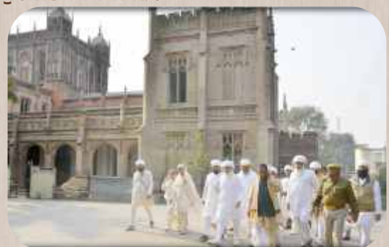
ਵਿਦਿਆਲਾ ਦੇ ਕੰਪਲੈਕਸ ਵਿੱਚ ਸ੍ਰੀ ਸਤਿਗੁਰੂ ਜੀ ਨਾਲ ਉਪ ਕੁਲਪਤੀ ਜੀ ਅਤੇ ਸੇਵਕ