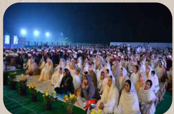
ਸੰਗੀਤ ਸੰਮੇਲਨ ਦੌਰਾਨ ਸ਼੍ਰੋਤਾ ਮੰਡਲ ਅਨੰਦ ਮਾਣਦੇ ਹੋਏ