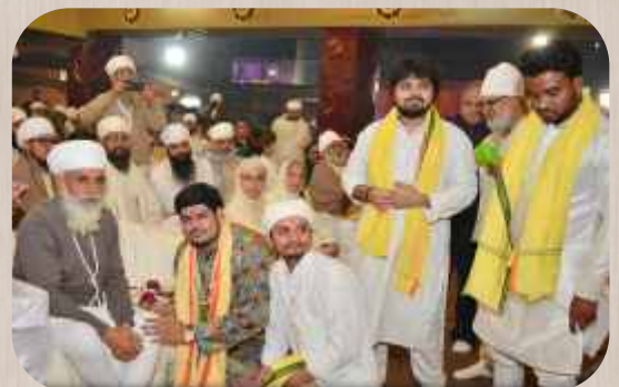
ਸਿਤਾਰ ਵਾਦਨ ਤੇ ਉਨ੍ਹਾਂ ਦਾ ਸਾਥੀ ਅਸ਼ੀਰਵਾਦ ਪ੍ਰਾਪਤ ਕਰਦੇ ਹੋਏ