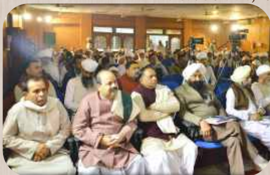
ਸੈਮੀਨਾਰ ਦੌਰਾਨ ਸ਼੍ਰੋਤਾ ਮੰਡਲ