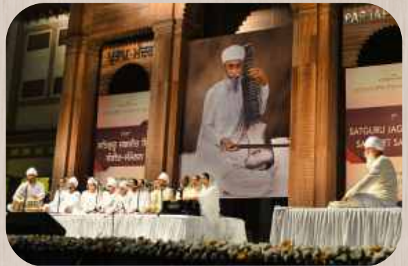
ਸ੍ਰੀ ਭੈਣੀ ਸਾਹਿਬ ਦੇ ਸੰਗੀਤ ਵਿਦਿਆਰਥੀ ਬੱਚੇ