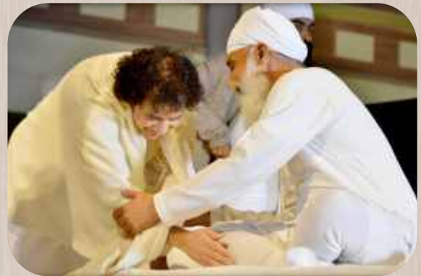
ਸ੍ਰੀ ਸਤਿਗੁਰੂ ਜੀ ਉਸਤਾਦ ਜ਼ਾਕਿਰ ਹੁਸੈਨ ਨਾਲ ਬਚਨ-ਬਿਲਾਸ ਕਰਦੇ ਹੋਏ