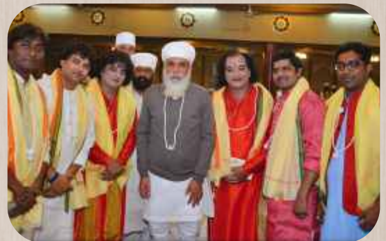
ਕੱਥਕ ਨ੍ਰਿਤ ਤੇ ਉਨ੍ਹਾਂ ਦਾ ਸਾਥੀ ਅਸ਼ੀਰਵਾਦ ਪ੍ਰਾਪਤ ਕਰਦੇ ਹੋਏ