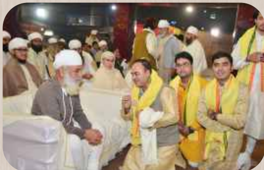
ਅਸ਼ੀਰਵਾਦ ਪ੍ਰਾਪਤ ਕਰਦੇ ਹੋਏ ਸੰਗੀਤਕਾਰ