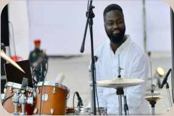
ਮਸ਼ਹੂਰ ਡਰੱਮ ਮਾਸਟਰ ਮਾਰਕਸ ਗਿਲਮੋਰ