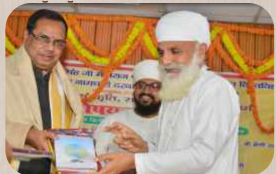
ਸ੍ਰੀ ਸਤਿਗੁਰੂ ਜੀ ਦੁਆਰਾ ਉਪ ਕੁਲਪਤੀ ਨੂੰ ਸਿਰਪਾਓ