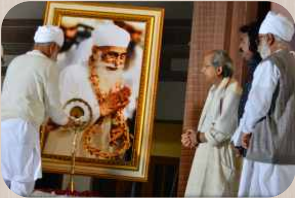
ਸ੍ਰੀ ਸਤਿਗੁਰੂ ਉਦੇ ਸਿੰਘ ਜੀ ਜੋਤ ਪੂਜਵਲਿਤ ਕਰਦੇ ਹੋਏ