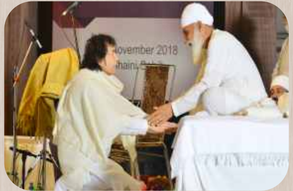
ਉਸਤਾਦ ਜ਼ਾਕਿਰ ਹੁਸੈਨ ਅਸ਼ੀਰਵਾਦ ਪ੍ਰਾਪਤ ਕਰਦੇ ਹੋਏ