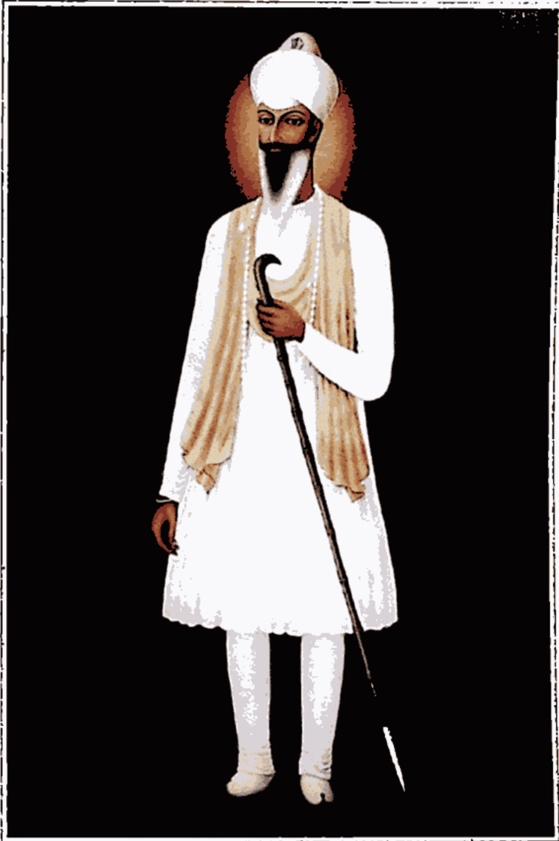
ਸ਼੍ਰੀ ਸਤਿਗੁਰੂ ਰਾਮ ਸਿੰਘ ਜੀ