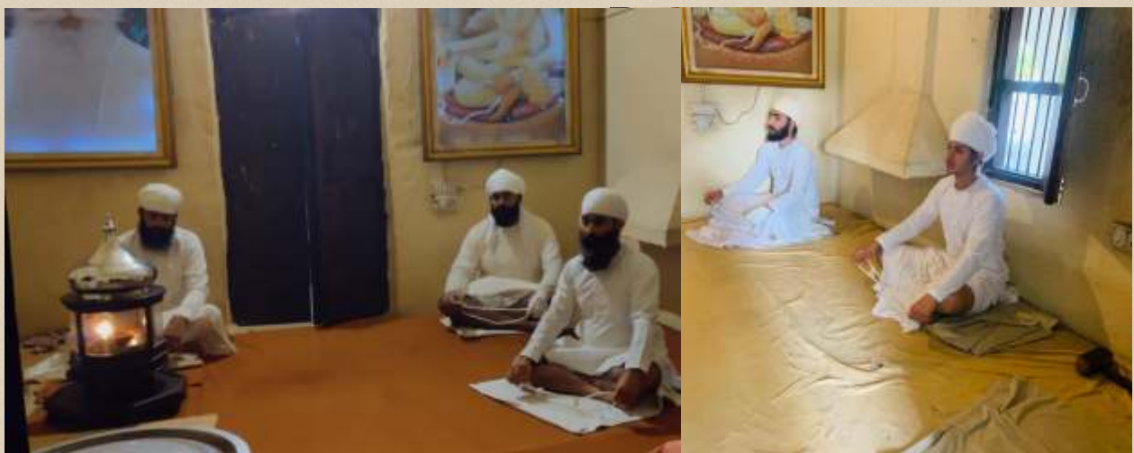
ਸ੍ਰੀ ਭੈਣੀ ਸਾਹਿਬ ਵਿਖੇ ਨੌਜੁਆਨ ਅਖੰਡ ਵਰਨੀ ਵਿੱਚ ਸੇਵਾ ਨਿਭਾਉਂਦੇ ਹੋਏ।