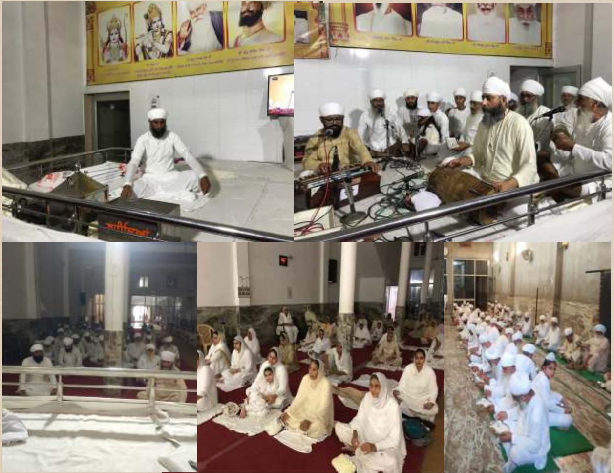
16 ਅਗਸਤ, ਭਾਦਰੋਂ ਦੀ ਸੰਗਰਾਂਦ ਵਾਲੇ ਦਿਨ ਐਲਨਬਾਦ ਵਿਖੇ ਸੰਗਤ ਵਾਲੇ ਸਲਾਨਾ ਜਪ ਪ੍ਰਯੋਗ ਦੀ ਸ਼ੁਰੂਆਤ ਕੀਤੀ ਗਈ