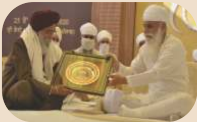
ਪਦਮ ਸ੍ਰੀ ਸੁਰਜੀਤ ਪਾਤਰ।