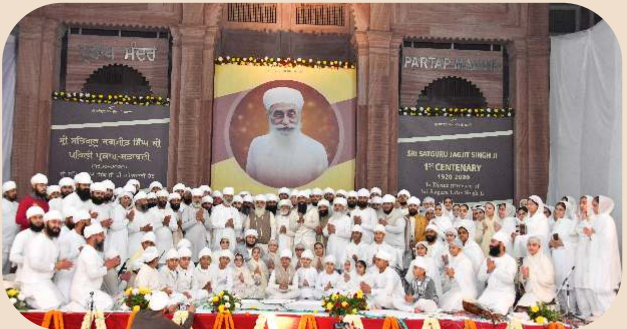
ਸ੍ਰੀ ਸਤਿਗੁਰੂ ਉਦੇ ਸਿੰਘ ਜੀ ਨਾਲ ਸੰਗੀਤਕਾਰਾਂ ਦੀ ਯਾਦਗਾਰੀ ਤਸਵੀਰ।