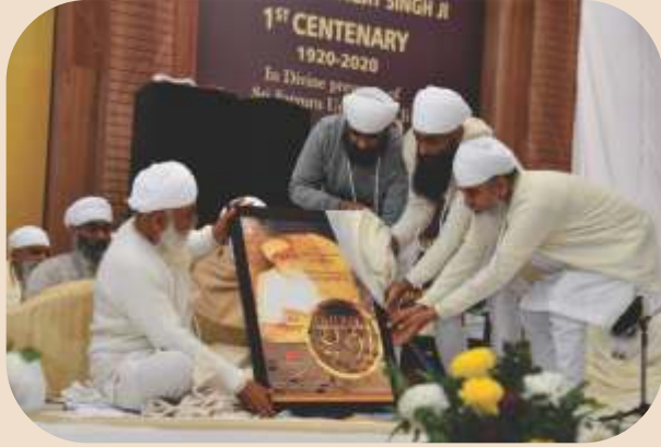
ਵਾਰਾਂ ਦੀਆਂ ਧੁਨੀਆਂ ਦੀ ਵੀਡੀਓ ਰਿਲੀਜ਼