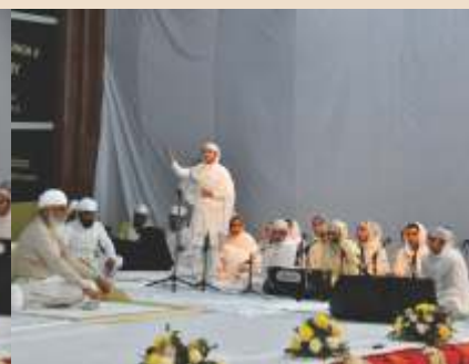
ਹੱਲੇ ਦਾ ਦੀਵਾਨ