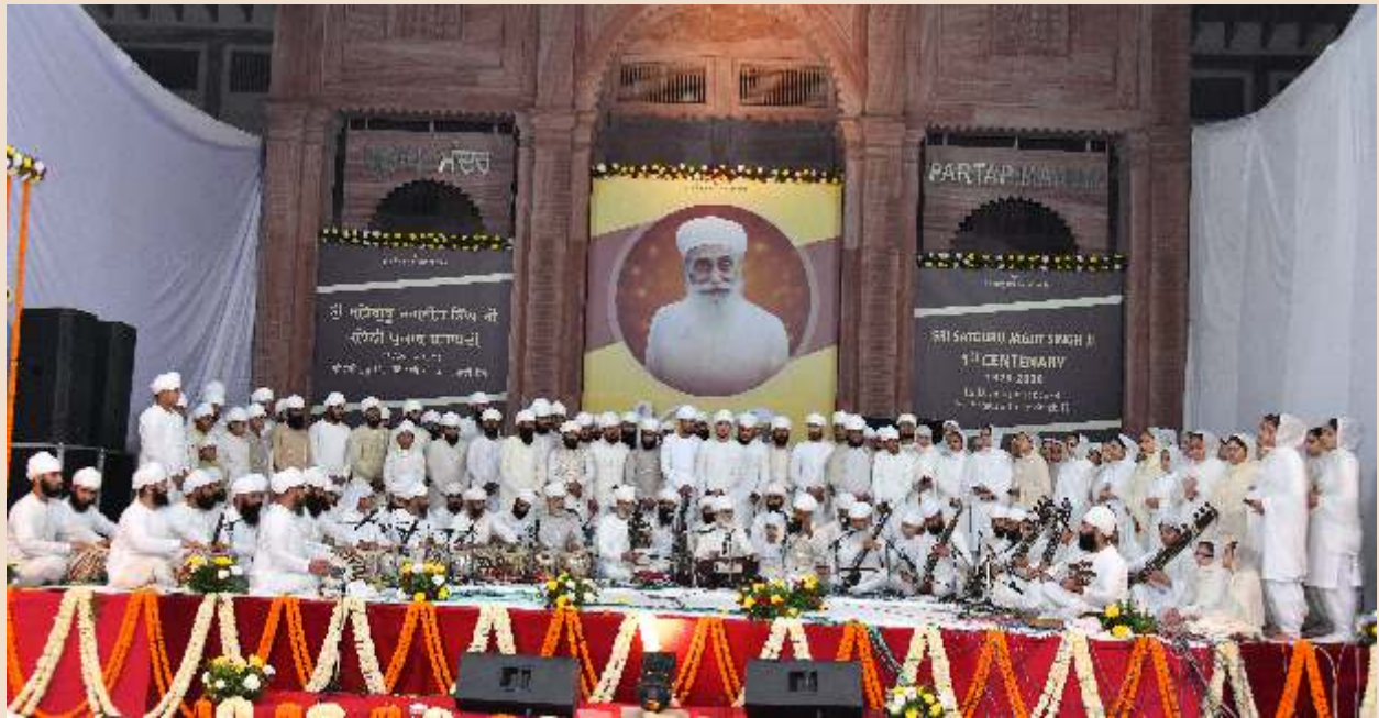
ਸ੍ਰੀ ਸਤਿਗੁਰੂ ਜਗਜੀਤ ਸਿੰਘ ਜੀ ਦੇ 100 ਵੇਂ ਪ੍ਰਕਾਸ਼ ਵਰ੍ਹੇ ਤੇ 100 ਸੰਗੀਤਕਾਰਾਂ ਵੱਲੋਂ ਆਰਕੈਸਟਰਾ ਅਤੇ ਸ਼ਬਦ ਗਾਇਨ।