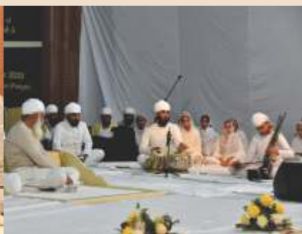
ਸੰਗੀਤ-ਤਾਰ ਸ਼ਹਿਨਾਈ ਵਾਦਨ