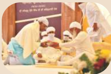
ਸ੍ਰੀ ਅਲੋਕ ਕੁਮਾਰ ਜੀ (ਪ੍ਰਧਾਨ ਵਿਸ਼ਵ ਹਿੰਦੂ ਪ੍ਰੀਸ਼ਦ)