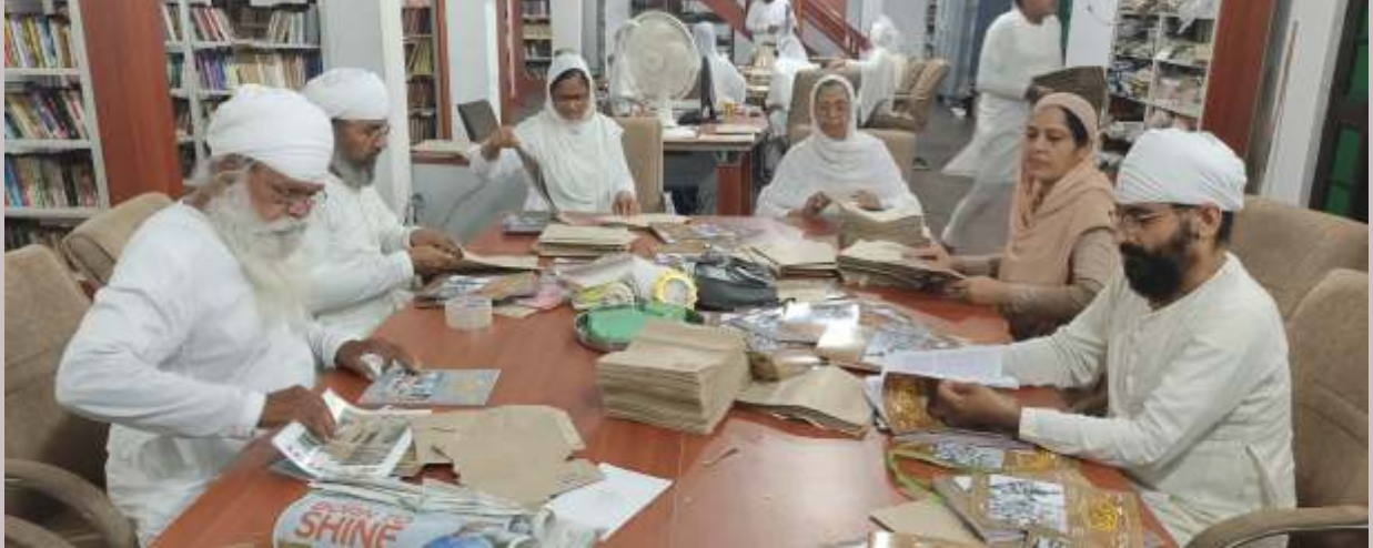
ਸਤਿਜੁਗ ਦਫਤਰ ਵਿੱਚ ਸੇਵਾ ਕਰਦੀ ਹੋਈ ਸਾਧ ਸੰਗਤ