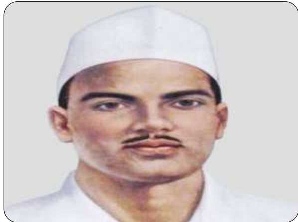
ਸ਼ਹੀਦ ਸ਼ਿਵਰਾਮ ਹਰੀ ਰਾਜਗੁਰੂ

ਸ਼ਿਵਰਾਮ ਰਾਜਗੁਰੂ ਦਾ ਬੜਬੋਲਾਪਣ ਅਤੇ ਲੋੜੋਂ ਵੱਧ ਸੌਣਾ ਸਾਥੀਆਂ ਨੂੰ ਚੁੱਭਦਾ ਸੀ, ਇਸੇ ਕਾਰਨ ਉਹ ਅਕਸਰ ਹੀ ਸਾਥੀਆਂ ਦੇ ਹਾਸੇ ਮਖੌਲ ਦਾ ਸ਼ਿਕਾਰ ਬਣਦਾ ਪਰ ਉਹ ਕਿਸੇ ਵੀ ਗੱਲ ਦਾ ਗੁੱਸਾ ਨਹੀਂ ਸੀ ਕਰਦਾ ਸਗੋਂ ਉਹ ਆਪ ਵੀ ਆਪਣੇ ਚਿਹਰੇ ਮੋਹਰੇ ਅਤੇ ਹੋਰ ਆਦਤਾਂ ਨੂੰ ਸਾਥੀਆਂ ਦੇ ਮਜ਼ਾਕ ਦਾ ਕੇਂਦਰ ਬਣਾ ਕੇ ਮਜ਼ਾ ਲੈਂਦਾ। ਇਨਕਲਾਬੀ ਕਾਰਜ ਪ੍ਰਤੀ ਸੁਹਿਰਦਤਾ, ਦ੍ਰਿੜਤਾ ਅਤੇ ਸਮਰਪਣ ਕਾਰਨ ਉਹ ਥੋੜ੍ਹੇ ਸਮੇਂ ਵਿੱਚ ਹੀ ਆਗੂਆਂ ਦੇ ਦਿਲ ਵਿੱਚ ਵੱਸ ਗਿਆ। ਸ਼ਿਵ ਵਰਮਾ ਅਨੁਸਾਰ ਉਸ ਨੂੰ ਇਸ ਗੱਲ ਦਾ ਫਿਕਰ ਲੱਗਾ ਰਹਿੰਦਾ ਕਿ ਕਿਤੇ ਇਸ ਦੌੜ ਵਿਚ ਭਗਤ ਸਿੰਘ ਪਹਿਲਾਂ ਸ਼ਹੀਦ ਨਾ ਹੋ ਜਾਵੇ। ਪਾਰਟੀ ਸਾਹਮਣੇ ਹਮੇਸ਼ਾ ਉਸ ਦੀ ਇਕੋ ਹੀ ਮੰਗ ਰਹਿੰਦੀ ਕਿ “ਹਰ ਕੰਮ ਵਿਚ ਅੱਗੇ ਵਧ ਕੇ ਪਹਿਲੀ ਗੋਲੀ ਚਲਾਉਣ ਦਾ ਮੌਕਾ ਉਸ ਨੂੰ ਮਿਲਣਾ ਚਾਹੀਦਾ ਹੈ।” ਲਾਹੌਰ ਵਿਚ ਪੁਲੀਸ ਅਫਸਰ ਸਾਂਡਰਸ ਨੂੰ ਮਾਰਨ ਸਮੇਂ ਉਸ ਨੇ ਸਤਿਜੁਗ