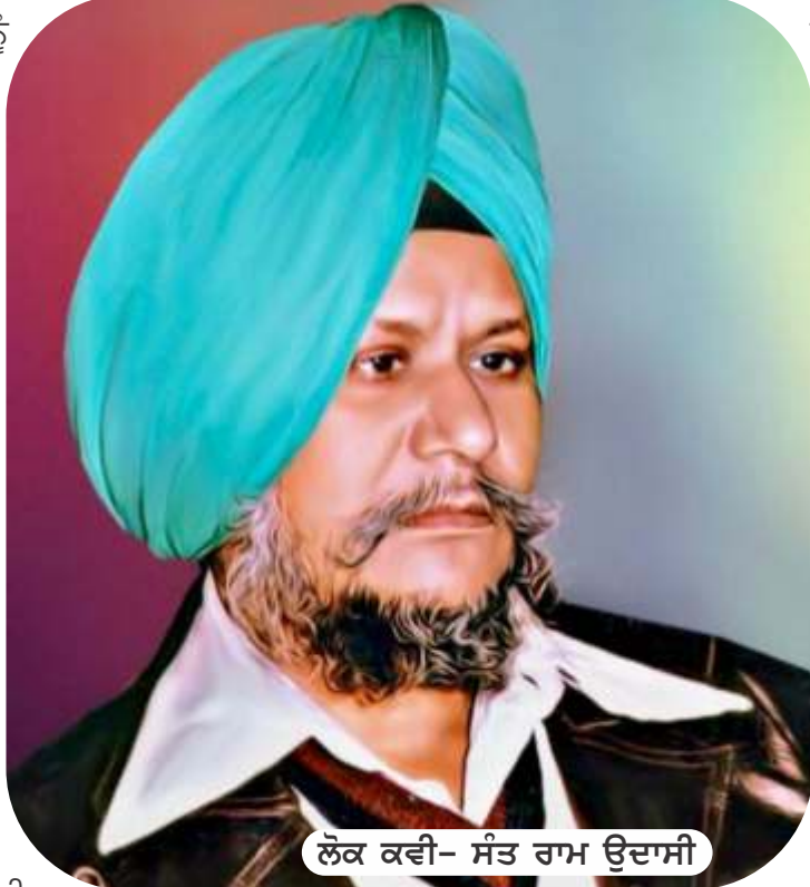
ਲੋਕ ਕਵੀ- ਸੰਤ ਰਾਮ ਉਦਾਸੀ

ਆਪਣੇ ਈਮਾਨ ਤੇ ਪਹਿਰਾ ਦੇਣ ਵਾਲੇ ਉਦਾਸੀ ਨੂੰ ਉਸਦੇ ਵਿੱਤ ਤੋਂ ਵੱਡਾ ਗਿਣਨ ਵਾਲੇ ਸੱਜਣਾਂ ਨੇ ਬਾਦ ‘ਚ ਉਸਨੂੰ ਛੱਜ ‘ਚ ਪਾ ਕੇ ਛੱਟਿਆ। ਉਸਦੀ ਸ਼ਾਇਰੀ ਤਾਂ ਇਹੀ ਦੱਸਦੀ ਹੈ ਕਿ ਉਹ ਸਿਧਾਂਤਕਾਰ ਨਹੀਂ ਸੀ, ਕੇਵਲ ਸ਼ਬਦ ਸਾਧਕ ਸੀ, ਸੁੱਚਾ ਸੁਥਰਾ ਜਜ਼ਬਾ ਪੇਸ਼ ਕਰਨ ਵਾਲਾ ਸ਼ਾਇਰ। ਉਹ ਕਦੇ ਕਹਿੰਦਾ ਸੀ ਕਿ ਮੈਂ ਸਿਧਾਂਤਕਾਰ ਹਾਂ, ਉਹ ਤਾਂ ਆਪਣੇ ਵਰਗੇ ਅਤੇ