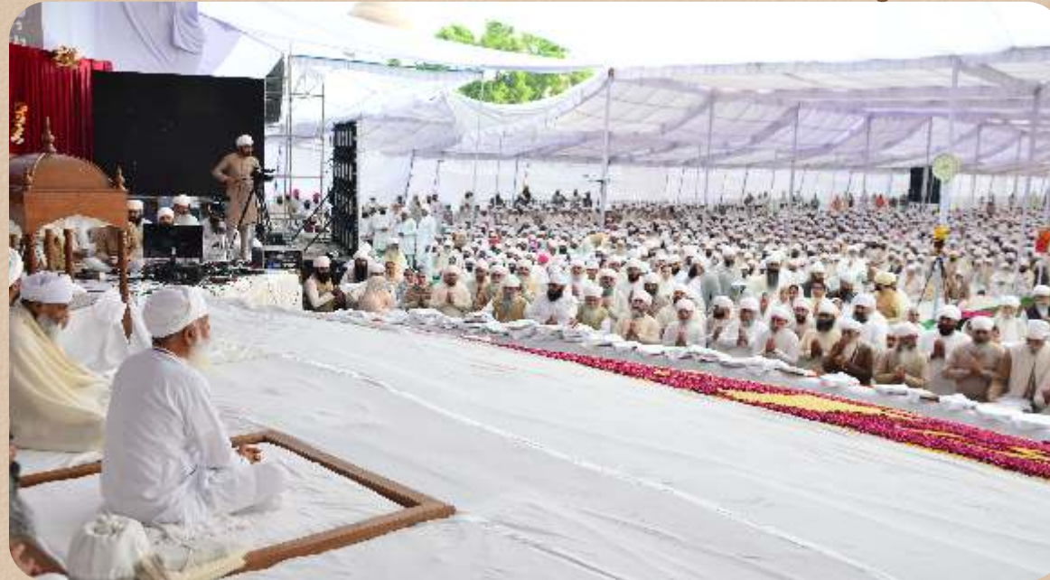
ਸ੍ਰੀ ਸਤਿਗੁਰੂ ਜੀ- ਸੰਗਤਾਂ ਵਿੱਚ ਸੁਭਾਇਮਾਨ।