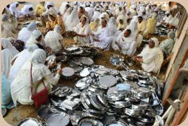
ਭਾਂਡਿਆਂ ਦੀ ਸੇਵਾ ਕਰਦੀ ਸਾਧ-ਸੰਗਤ।