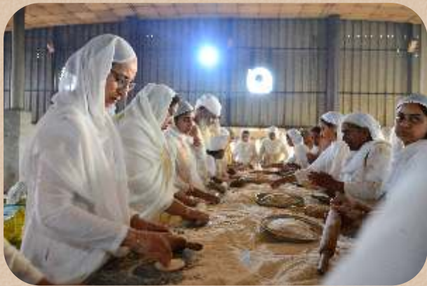
ਮਾਤਾ ਜੀ ਮੇਲੇ ਦੌਰਾਨ ਸੇਵਾ ਕਰਦੇ ਹੋਏ।