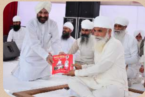
ਸਰਬਸ਼ਕਤੀਮਾਨ ਜੀ ਵਰਤਮਾਨ ਹਿੰਦੁਸਤਾਨ ਭੇਟ ਕਰਦੇ ਹੋਏ।