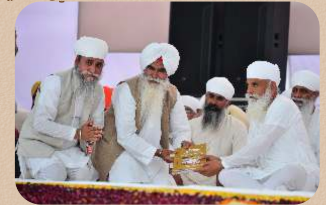
ਸਤਿਜੁਗ ਦਾ ਹੋਲਾ ਅੰਕ ਭੇਟ ਸ੍ਰੀ ਸਤਿਗੁਰੂ ਜੀ ਨੂੰ।