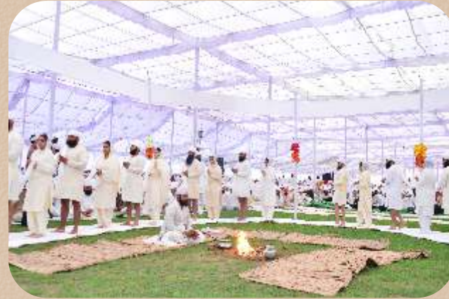
ਹੋਲੇ ਮਹੱਲੇ ਸਮੇਂ: ਸਮੂਹਿਕ ਅਨੰਦ ਕਾਰਜ।