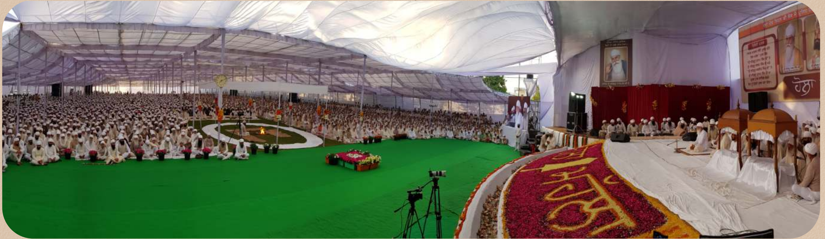
ਅਤਿ ਉਚਾ ਤਾਕਾ ਦਰਬਾਰਾ