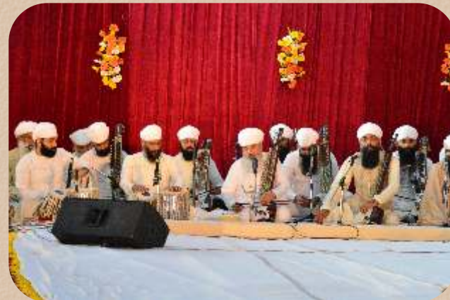
ਹਜ਼ੂਰੀ ਰਾਗੀ ਕੀਰਤਨ ਕਰਦੇ ਹੋਏ।