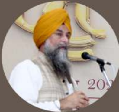
ਕੁਲਤਾਰ ਸਿੰਘ ਸੰਧਵਾਂ ਪੰਜਾਬ ਵਿਧਾਨ ਸਭਾ ਦੇ ਸਪੀਕਰ