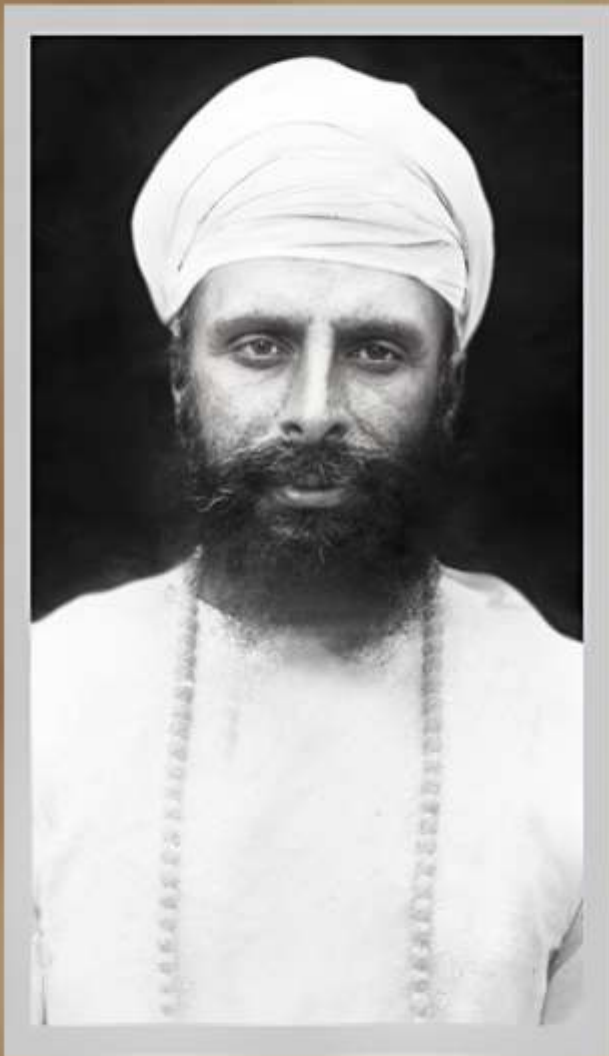
ਸ੍ਰੀ ਸਤਿਗੁਰੂ ਪ੍ਰਤਾਪ ਸਿੰਘ ਜੀ