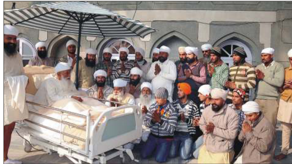
ਸ੍ਰੀ ਸਤਿਗੁਰੂ ਜਗਜੀਤ ਸਿੰਘ ਜੀ ਦੀ ਦੇਹ ਅਰੋਗਤਾ ਲਈ ਹੋਏ ਸ੍ਰੀ ਆਦਿ ਗ੍ਰੰਥ ਸਾਹਿਬ ਜੀ ਦੇ ਅਖੰਡ ਪਾਠਾਂ ਦੌਰਾਨ ਬਾਲਣ ਦੀ ਸੇਵਾ ਕਰਨ ਵਾਲੇ ਸੇਵਾਦਾਰ ਆਪ ਜੀ ਦੀ ਹਜ਼ੂਰੀ ਵਿੱਚ।