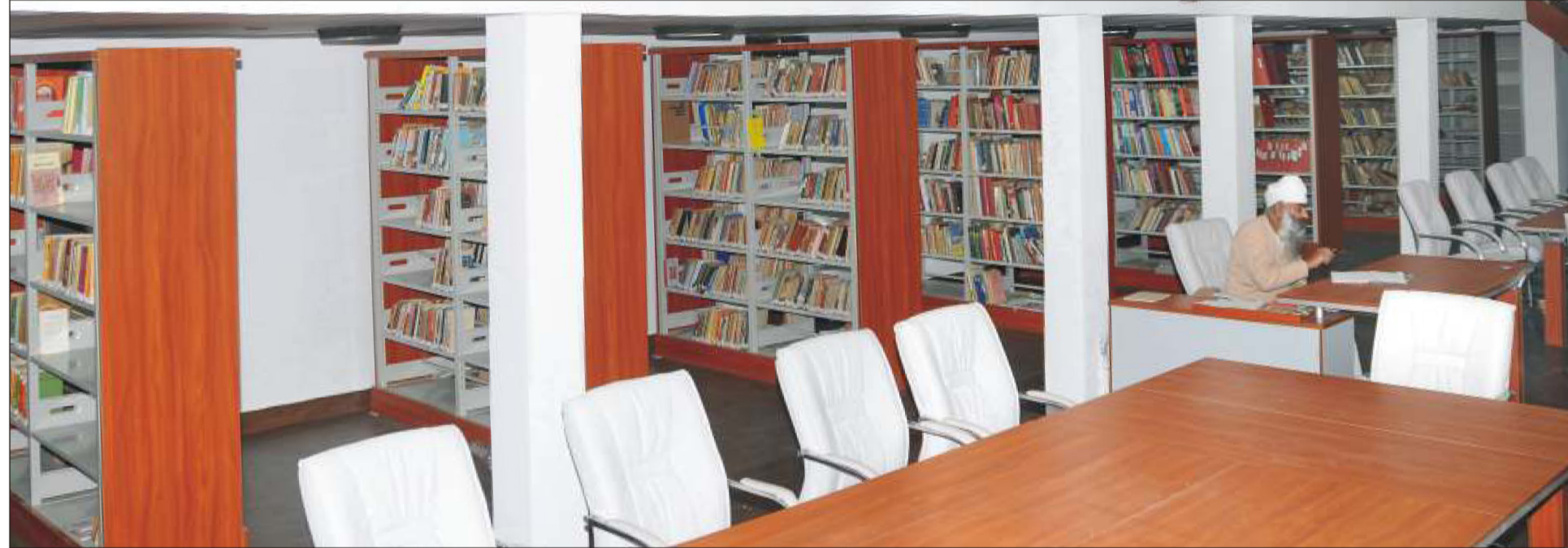
ਸ੍ਰੀ ਭੈਣੀ ਸਾਹਿਬ ਵਿਖੇ ਬਹੁਤ ਸੁੰਦਰ ਅਤੇ ਆਕਰਸ਼ਕ ਬਣਾਈ ਗਈ 'ਸਤਿਗੁਰੂ ਜਗਜੀਤ ਸਿੰਘ ਲਾਇਬਰੇਰੀ' ਦਾ ਅੰਦਰਲਾ ਦ੍ਰਿਸ਼ ਜਿਸ ਵਿੱਚ ਖੋਜਕਾਰਾਂ, ਵਿਦਵਾਨਾਂ ਅਤੇ ਪਾਠਕਾਂ ਲਈ ਸਾਹਿਤ, ਇਤਿਹਾਸ ਨਾਲ ਸੰਬੰਧਤ ਸਮਗਰੀ ਰੱਖੀ ਗਈ ਹੈ।