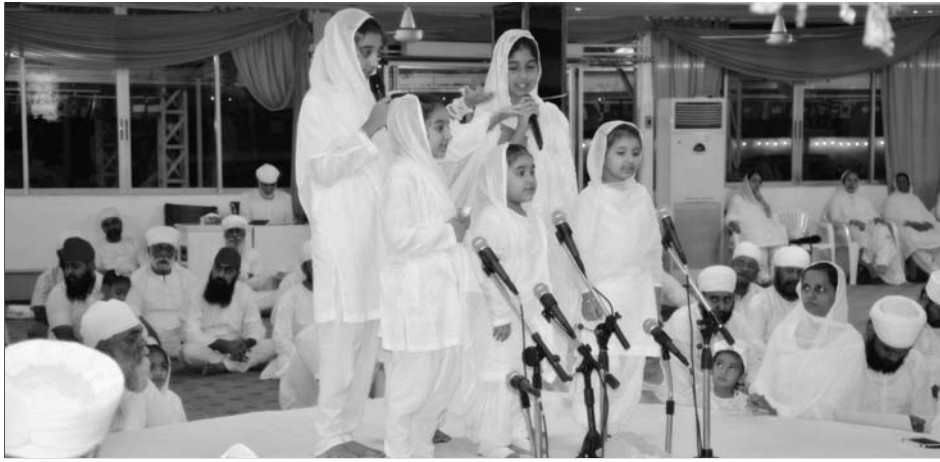
ਸ੍ਰੀ ਸਤਿਗੁਰੂ ਜੀ ਦੀ ਹਜ਼ੂਰੀ ਵਿਚ ਬੱਚੀਆਂ ਕਵਿਤਾ 'ਭੈਣੀ ਸਾਹਿਬ ਦੇਖੋ ਜਾਕੇ ਸਵਰਗਾ ਸਮਾਨ ਹੈ' ਪੜ੍ਹਦੀਆਂ ਹੋਈਆਂ।