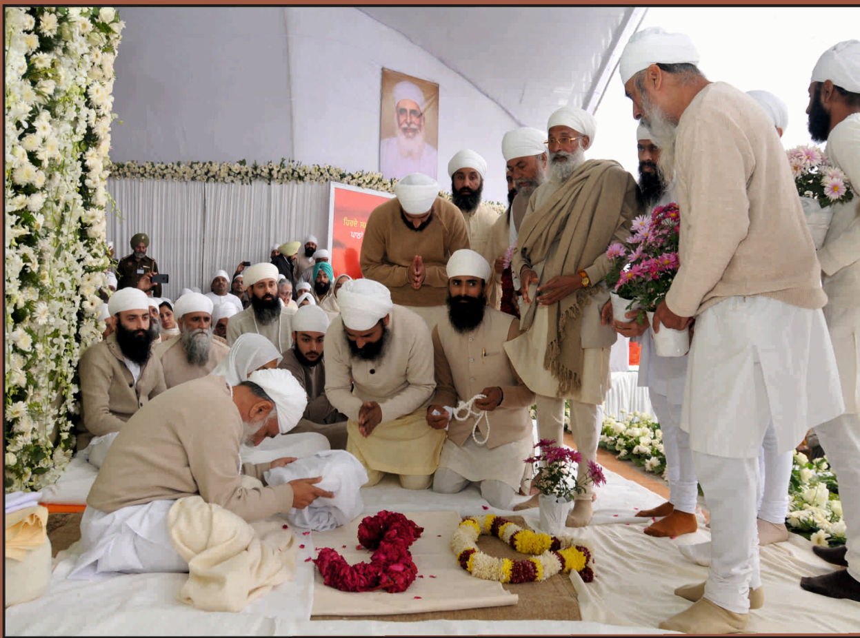
ਸ੍ਰੀ ਸਤਿਗੁਰੂ ਜਗਜੀਤ ਸਿੰਘ ਜੀ ਦੇ ਨਿਜੀ ਸੇਵਕਾਂ ਤੋਂ ਸ੍ਰੀ ਸਤਿਗੁਰੂ ਜੀ ਦੀ ਦਸਤਾਰ ਸਵੀਕਾਰ ਕਰਦੇ ਹੋਏ ਸ੍ਰੀ ਸਤਿਗੁਰੂ ਉਦੈ ਸਿੰਘ ਜੀ - ਸ੍ਰੀ ਭੈਣੀ ਸਾਹਿਬ, 23 ਦਸੰਬਰ 2012