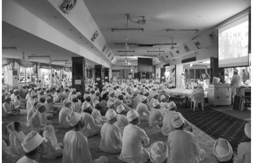
ਸ੍ਰੀ ਸਤਿਗੁਰੂ ਜਗਜੀਤ ਸਿੰਘ ਜੀ ਤੇ ਬਣੀ ਡਾਕੂਮੈਂਟਰੀ ਸ੍ਰੀ ਸਤਿਗੁਰੂ ਉਦੈ ਸਿੰਘ ਜੀ ਦੀ ਹਜ਼ੂਰੀ ਵਿਚ ਵੇਖਦੀ ਤੇ ਨਿਤਨੇਮ ਕਰਦੀ ਬੰਕੋਕ ਦੀ ਸਾਧ ਸੰਗਤ।