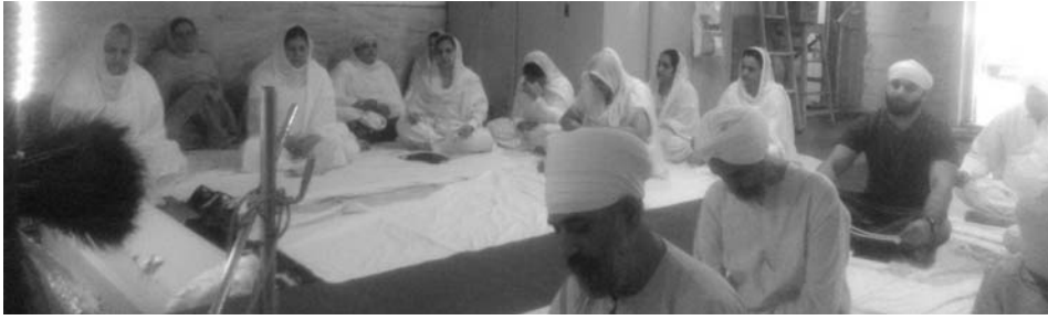
ਮੁੰਬਈ ਦੀ ਸਾਧ ਸੰਗਤ ਨਾਮ ਸਿਮਰਨ ਕਰਦੀ ਹੋਈ।

● ਮੁੰਬਈ, 13.12.2015: ਸਾਰੇ ਵਿਸ਼ਵ ਵਿੱਚ ਸ੍ਰੀ ਸਤਿਗੁਰੂ ਉਦੈ ਸਿੰਘ ਜੀ ਦੀ ਕਿਰਪਾ ਸਦਕਾ, ਬੇਅੰਤ ਪਾਤਸ਼ਾਹ ਸ੍ਰੀ ਸਤਿਗੁਰੂ ਜਗਜੀਤ ਸਿੰਘ ਜੀ ਦੀ ਯਾਦ-ਚ-ਸਾਧ ਸੰਗਤ ਨੇ ਜੁੜਨ ਦਾ ਉਪਰਾਲਾ ਕੀਤਾ। ਮੁੰਬਈ ਨਾਮਧਾਰੀ ਸਾਧ-ਸੰਗਤ ਨੇ 13 ਦਸੰਬਰ 2015 ਵਾਲੇ ਦਿਨ ਮਾਟੁੰਗਾ ਧਰਮਸ਼ਾਲਾ ਵਿਖੇ, ਅੰਮ੍ਰਿਤ ਵੇਲੇ ਆਸਾ ਦੀ ਵਾਰ ਤੋਂ ਉਪਰਾਂਤ ਇਕ ਘੰਟਾ ਨਾਮ ਸਿਮਰਨ, ਸਤਿਗੁਰੂ ਜਗਜੀਤ ਸਿੰਘ ਜੀ ਦੇ ਰਿਕਾਰਡ ਹੋਏ ਬਚਨ ਸਰਵਣ ਕਰਦਿਆਂ ਸੰਪਨ ਕੀਤਾ।