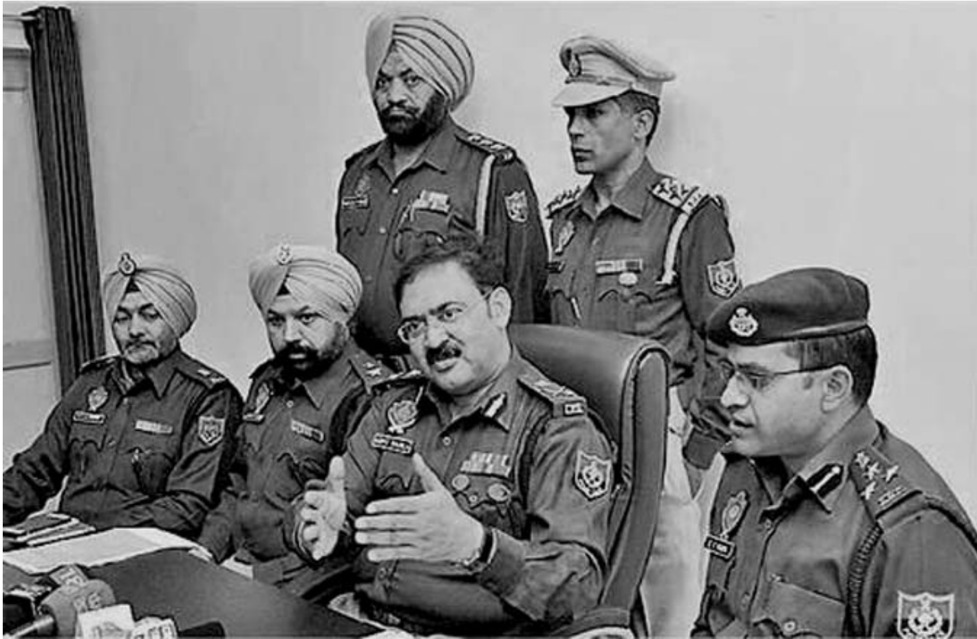
पुलिस अधिकारी जांच के बारे में खुलासा करते हुए।