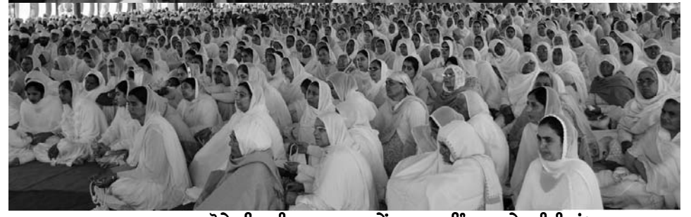
ਮਸਤਾਨਗੜ੍ਹ ਹੋਏ ਸਿਮ੍ਰਤੀ ਸਮਾਗਮ ਸਮੇਂ ਹਾਜ਼ਰ ਸਿੰਘ ਅਤੇ ਬੀਬੀਆਂ।

ਗੋਰਿਆਂ ਵੱਲੋਂ। ਜ਼ਰਾ ਵੇਖੀਏ ਰੜ ਪਿੰਡ ਵਿਚ 68 ਨਾਮਧਾਰੀਆਂ (ਦੋ ਔਰਤਾਂ ਸਹਿਤ) ਨੇ ਆਪਣੇ ਆਪ ਨੂੰ ਬਿਨਾਂ ਕਿਸੇ ਉਜ਼ਰ ਦੇ ਸ਼ੇਰਪੁਰ ਦੇ ਥਾਣੇਦਾਰ ਦੇ ਹਵਾਲੇ ਕਰ ਦਿੱਤਾ ਸੀ ਅਤੇ ਸਾਰੇ ਹਥਿਆਰ, ਡਾਗਾਂ, ਟਕੂਏ, ਤਲਵਾਰਾਂ ਵੀ ਥਾਣੇ ਵਾਲਿਆਂ ਨੂੰ ਦੇ ਦਿੱਤੇ ਸਨ। ਇਸ ਤੱਥ ਦੀ ਪੁਸ਼ਟੀ ਕਾਵਨ, ਫੋਰਸਿੰਥ ਪੱਤਰ ਅਤੇ ਹੋਰ ਸਰਕਾਰੀ ਦਸਤਾਵੇਜ਼ ਵੀ ਕਰਦੇ ਹਨ। ਇਹਨਾਂ 68 ਨਾਮਧਾਰੀਆਂ ਚੋਂ 23 ਸਿੰਘ ਜ਼ਖਮੀ ਸਨ ਅਤੇ 7 ਤਾਂ ਮਾਰੂ ਫੱਟੜਾਂ ਵਾਲੇ ਸਨ, ਜੋ ਹੁਣ ਤੁਰ ਫਿਰ ਵੀ ਨਹੀਂ ਸਨ ਸਕਦੇ। ਸਰਕਾਰ ਇਹ ਵੀ ਮੰਨਦੀ ਸੀ ਹੁਣ ਉਹ ਕੁਝ ਕਰ ਵੀ ਨਹੀਂ ਸਨ ਸਕਦੇ, ਭੁੱਖੇ ਥੱਕੇ ਹੋਏ ਸਨ। ਹੁਣ ਉਹ ਹੋਰ ਅੱਗੇ ਕੋਈ ਨੁਕਸਾਨ ਨਹੀਂ ਸਨ ਕਰ ਸਕਦੇ। ਫੇਰ ਕੀ ਜਲਦੀ ਪਈ ਸੀ, ਝੱਟ ਹੀ ਅਗਲੇ ਦਿਨ 17 ਜਨਵਰੀ ਵਾਲੇ ਦਿਨ ਉਨ੍ਹਾਂ ਸਿੰਘਾਂ ਨੂੰ ਬਿਨਾ ਕੋਈ ਪੜਤਾਲ ਕੀਤਿਆਂ ਤੋਪਾਂ ਨਾਲ ਉੱਡਾ ਦਿਤਾ, ਕਿਉਂ? ਜਦੋਂ ਗਰਿਫ਼ਤਾਰ ਸਿੰਘ ਕਿਸੇ ਵੀ ਤਰ੍ਹਾਂ ਦਾ ਨੁਕਸਾਨ ਨਹੀਂ ਸਨ ਪਹੁੰਚਾ ਸਕਦੇ ਤਾਂ ਫੇਰ ਆਰਾਮ ਨਾਲ