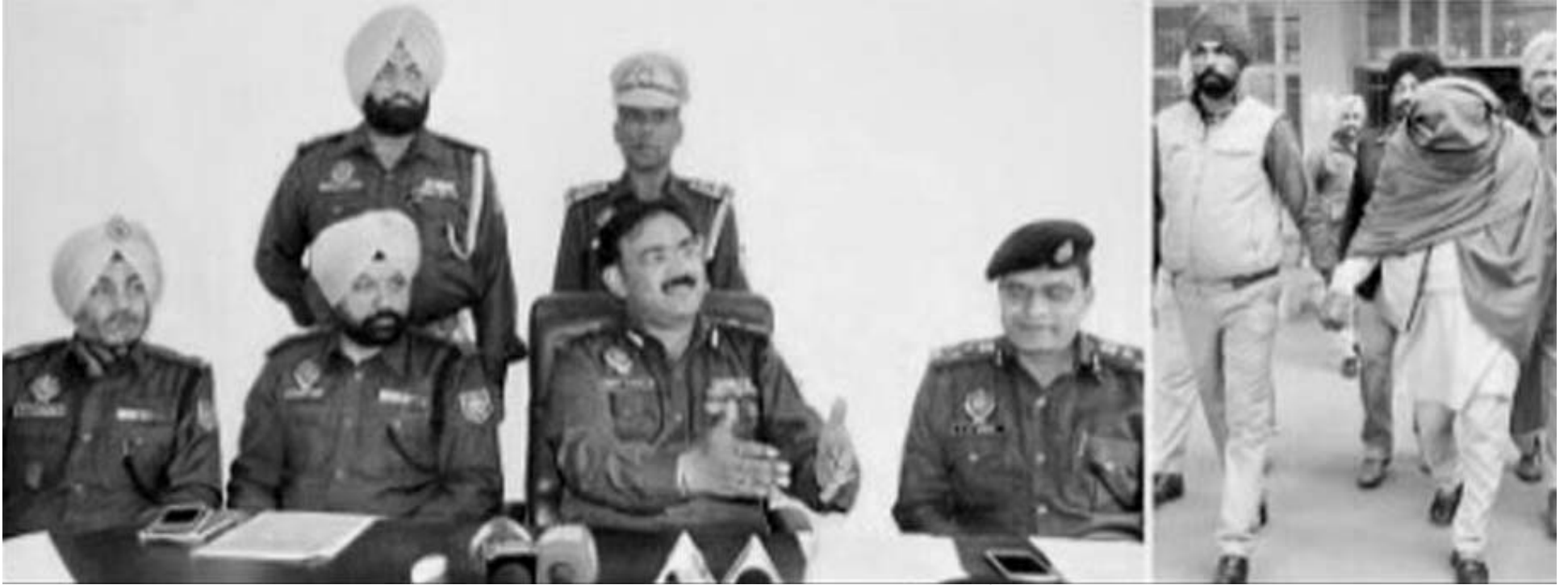
ਜਾਣਕਾਰੀ ਦਿੰਦੇ ਪੁਲਿਸ ਅਧਿਕਾਰੀ ਅਤੇ ਸਜੇ ਮੁਲਜ਼ਿਮ ਨੂੰ ਫੜ ਕੇ ਲੈ ਜਾਂਦੀ ਪੁਲਿਸ।

❖ ਸੰਗੀਤ ਸਮੇਲਨ 'ਚ ਸ਼ਾਮਲ ਹੋਣ ਵਾਲੇ ਧਾਰਮਿਕ ਗੁਰੂ ਸਨ ਟਾਰਗੈਟ