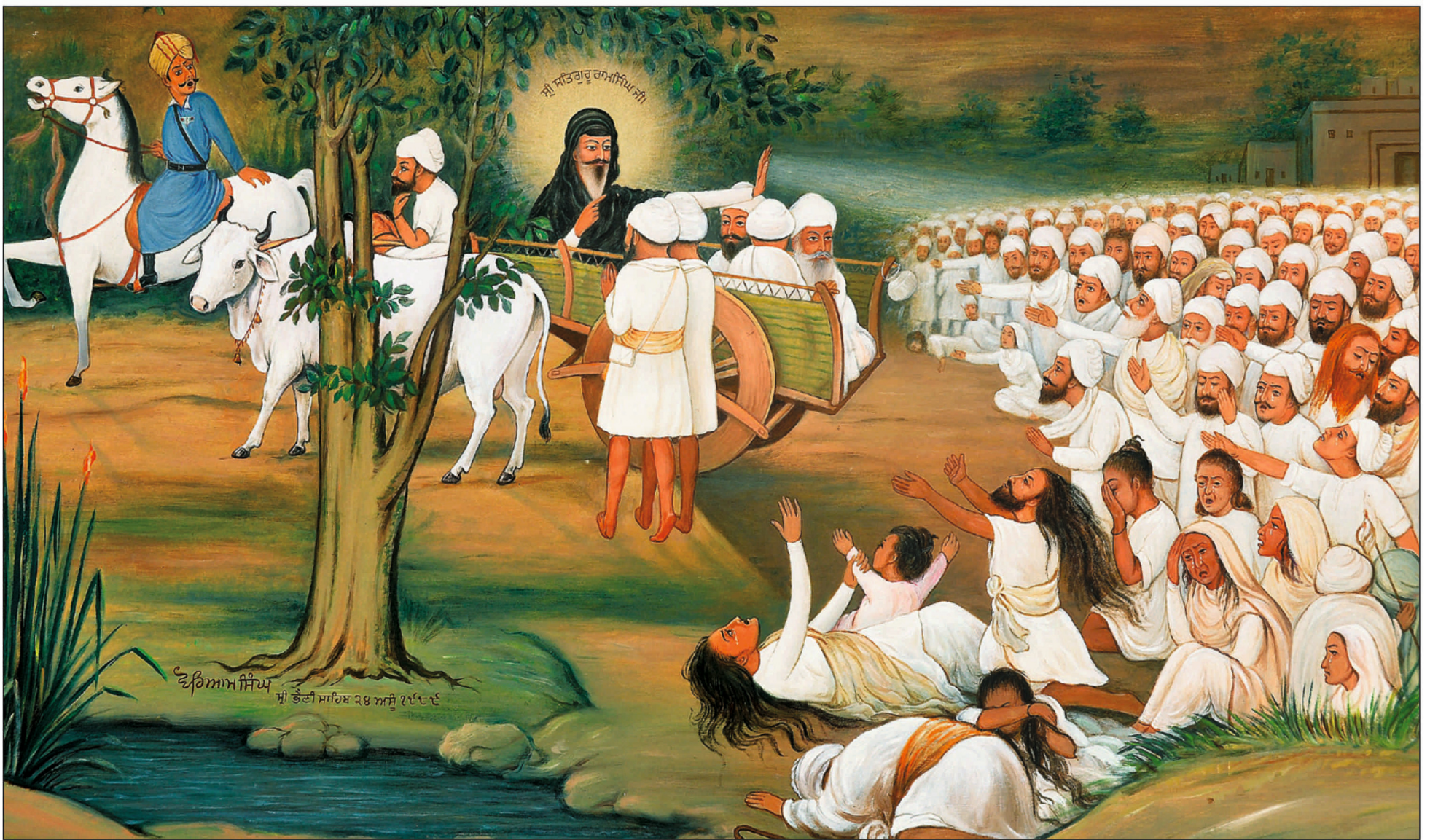
ਸ੍ਰੀ ਸਤਿਗੁਰੂ ਰਾਮ ਸਿੰਘ ਜੀ ਵਲੋਂ ਅੰਗਰੇਜ਼ ਹਕੂਮਤ ਵਿਰੁੱਧ ਆਜ਼ਾਦੀ ਦਾ ਬਿਗੁਲ ਵਜਾਉਣ ਕਾਰਨ ਸਰਕਾਰ ਬਹੁਤ ਡਰ ਗਈ ਸੀ, ਜਿਸ ਕਾਰਨ 17-18 ਜਨਵਰੀ 1872 ਦੀ ਵਿਚਕਾਰਲੀ ਰਾਤ ਨੂੰ ਜਲਾਵਤਨੀ ਦੇ ਸਰਕਾਰੀ ਹੁਕਮ ਅਨੁਸਾਰ ਸ੍ਰੀ ਭੈਣੀ ਸਾਹਿਬ ਤੋਂ ਰਵਾਨਗੀ ਸਮੇਂ ਗੱਡੇ ਤੇ ਸਵਾਰ ਹੋ ਕੇ ਕੁੱਝ ਸੂਬਿਆਂ ਸਹਿਤ ਲੁਧਿਆਣਾ ਲਈ ਜਾਂਦੇ ਹੋਏ।

ਅੰਗਰੇਜ਼ ਸਰਕਾਰ ਵਲੋਂ ਸਤਿਗੁਰੂ ਰਾਮ ਸਿੰਘ ਜੀ ਨੂੰ ਸ੍ਰੀ ਭੈਣੀ ਸਾਹਿਬ ਤੋਂ ਲੁਧਿਆਣਾ, ਪ੍ਰਯਾਗਰਾਜ ਅਤੇ ਹਾਵੜਾ (ਕਲਕੱਤਾ) ਤੋਂ ਸਮੁੰਦਰੀ ਜਹਾਜ਼ (ਮਯਾਂਮਾਰ) ਭੇਜ ਦਿੱਤਾ ਗਿਆ।