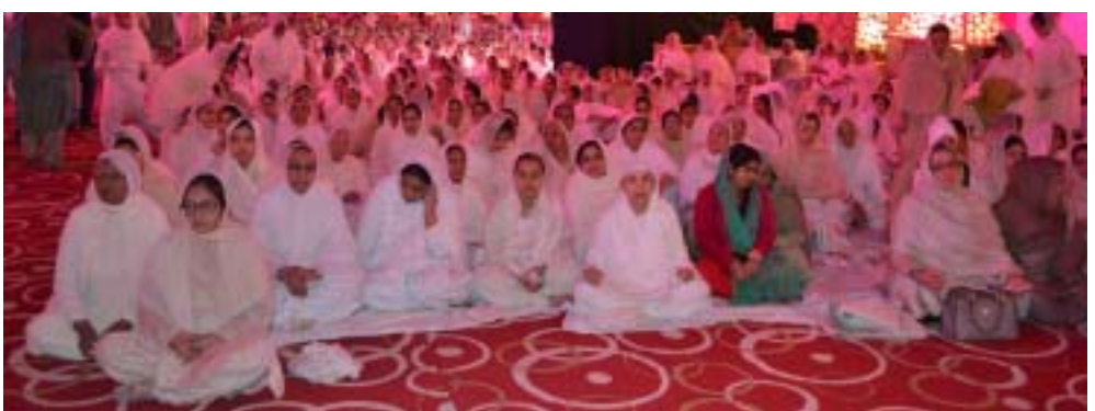
ਦਿੱਲੀ ਵਿਖੇ ਮਨਾਏ ਸ੍ਰੀ ਸਤਿਗੁਰੂ ਰਾਮ ਸਿੰਘ ਜੀ ਦੇ 200ਵੇਂ ਪ੍ਰਕਾਸ਼ ਪੁਰਬ ਮੇਲੇ ਸਮੇਂ ਹਾਜ਼ਰ ਸਾਧ ਸੰਗਤ।