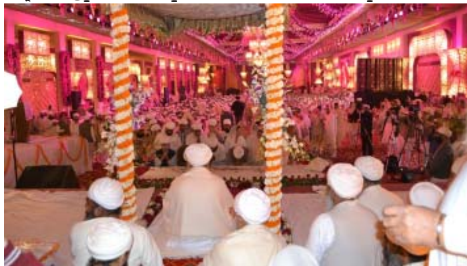
ਸ੍ਰੀ ਸਤਿਗੁਰੂ ਜੀ ਦੇ ਦਰਸ਼ਨਾਂ ਦਾ ਅਨੰਦ ਪ੍ਰਾਪਤ ਕਰਦੀ ਸਾਧ ਸੰਗਤ।