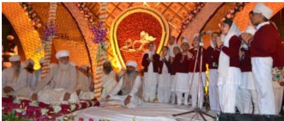
ਸ੍ਰੀ ਸਤਿਗੁਰੂ ਜੀ ਦੀ ਹਜ਼ੂਰੀ ਵਿਚ ਗੀਤ ਪੇਸ਼ ਕਰਦੇ ਸਕੂਲ ਦੇ ਬੱਚੇ।