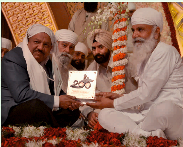
ਡਾ. ਹਰਸ਼ਵਰਧਨ ਕੈਬਿਨਟ ਮੰਤਰੀ (ਭਾਰਤ ਸਰਕਾਰ)