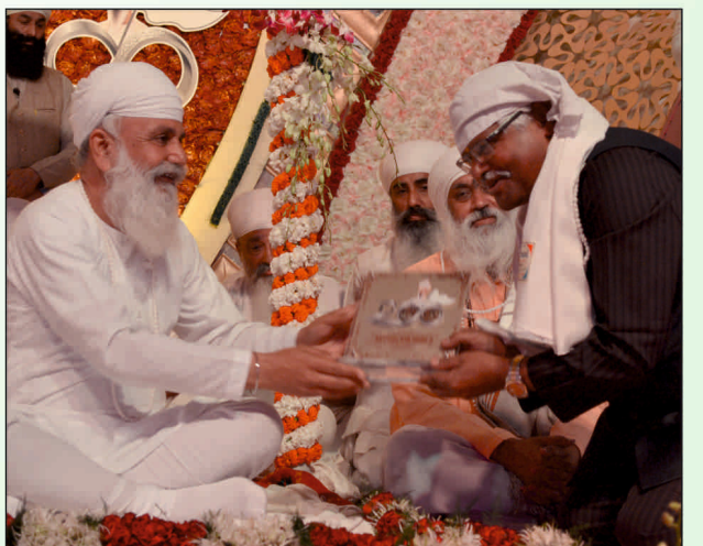
ਸ੍ਰੀ ਮਹਾਬਲ ਮਿਸ਼ਰਾ ਸਾਬਕਾ ਐਮ. ਪੀ