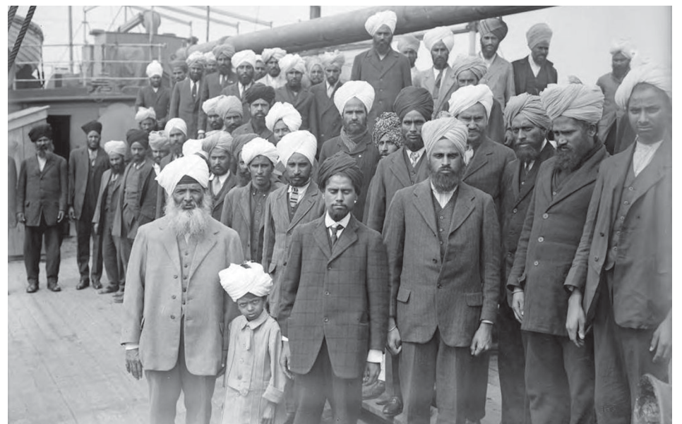
Passengers who travelled in Komagata Maru Ship in 1914

For that – and to you – we apologise. Just as we apologise for past wrongs, so too must we commit ourselves to positive action – to learning from the mistakes of the past, and to making sure that we never repeat them. That is unique promise and potential of Canada. Trudeau's apology is a historic moment for Canadian Sikhs and recognises the dark chapter the Komagata Maru tragedy marks in Canada's