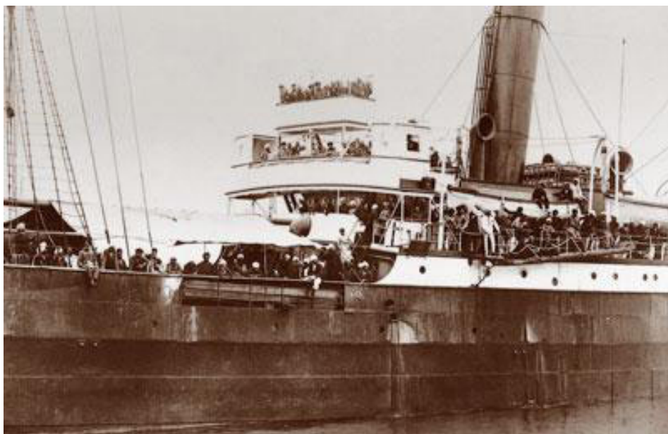
Komagata Maru Ship in Vancouver.

The Namdhari Sikhs would, therefore, seek similar large heartedness from the United Kingdom government to offer an apology to the descendants of the Namdhari Martyrs, recognising the dark chapter of the history which occurred 144 years ago in 1872 in Malerkotla.