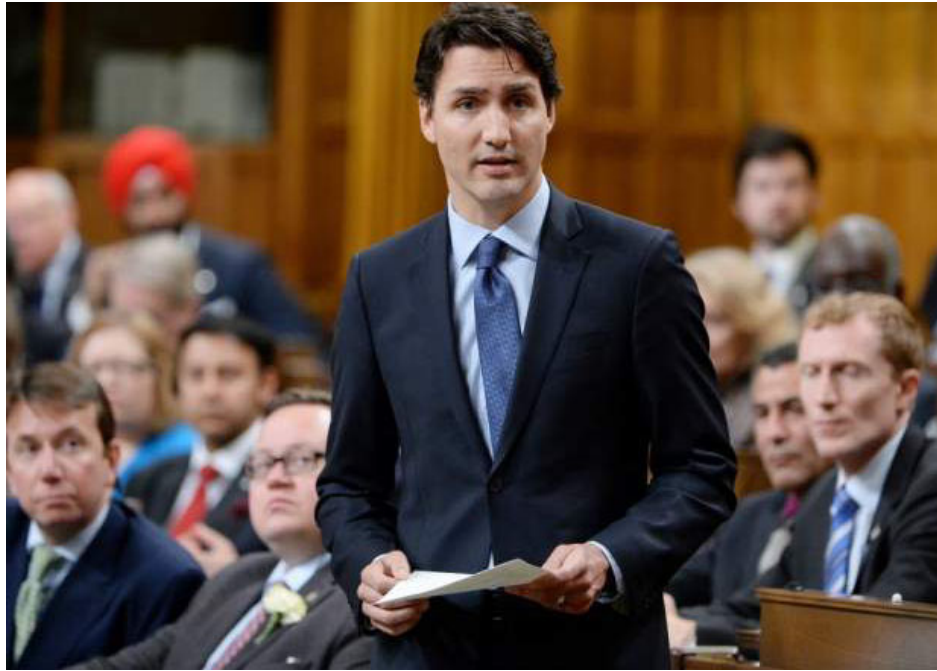
Canada's Prime Minister Justin Trudeau delivers a formal apology for the Komagata Maru incident in the House of Commons on Parliament Hill in Ottawa, Canada, on May 18, 2016.

No words can fully erase the pain and suffering they