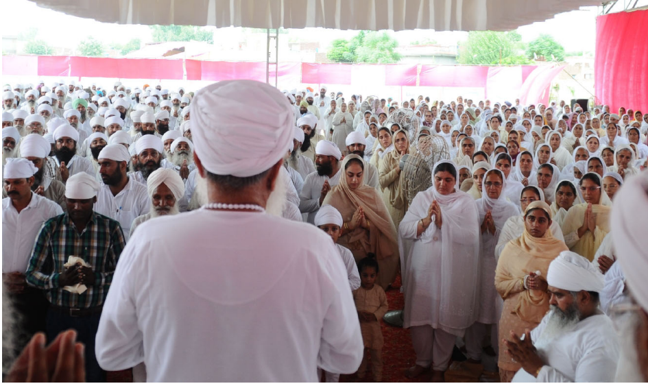
ਸ਼ਹੀਦਾਂ ਨਮਿਤ ਮੇਲੇ ਸਮੇਂ ਸ੍ਰੀ ਸਤਿਗੁਰੂ ਜੀ ਦੇ ਦਰਸ਼ਨਾਂ ਦਾ ਅਨੰਦ ਮਾਣਦੀ ਸਾਧ ਸੰਗਤ।