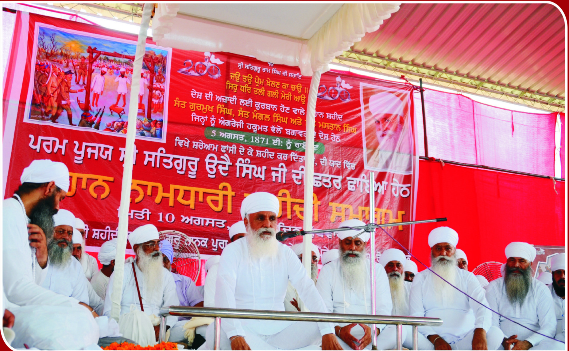
ਰਾਏਕੋਟ ਵਿਖੇ ਸ਼ਹੀਦਾਂ ਨਮਿਤ ਮੇਲੇ ਸਮੇਂ ਸ੍ਰੀ ਸਤਿਗੁਰੂ ਜੀ ਮਾਨਵਤਾ ਦੇ ਕਲਿਆਣ ਹਿੱਤ ਪ੍ਰਵਚਨ ਕਰਨ ਦੀ ਕਿਰਪਾ ਕਰਦੇ ਹੋਏ ਅਤੇ ਨਾਲ ਬੈਠੇ ਸਿੱਖ ਸੇਵਕ।