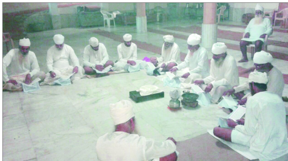
ਮੋਹਾਲੀ ਵਿਖੇ ਚਲ ਰਹੀ ਵਰਨੀਆਂ ਦੀ ਲੜੀ ਵਿੱਚ ਹਿੱਸਾ ਲੈ ਰਹੇ ਸਿੰਘ ।