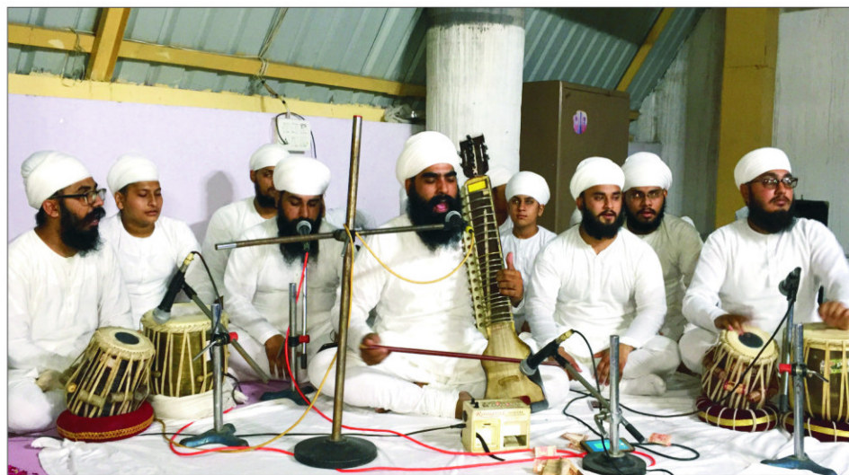
ਲੁਧਿਆਣੇ ਵਿਖੇ ਸ੍ਰੀ ਸਤਿਗੁਰੂ ਜੀ ਦੇ 59ਵੇਂ ਪ੍ਰਕਾਸ਼ ਪੁਰਬ ਮੇਲੇ ਸਮੇਂ ਲੁਧਿਆਣੇ ਦਾ ਰਾਗੀ ਜਥਾ ਕੀਰਤਨ ਕਰਦਾ ਹੋਇਆ ।