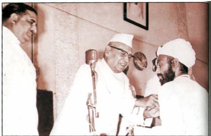
ਕੋਂਦਰੀ ਗੋ-ਸੇਵਰਧਨ ਪਰੀਸ਼ਦ ਵਲੋਂ ਸ੍ਰੀ ਸਤਿਗੁਰੂ ਜਗਜੀਤ ਸਿੰਘ ਜੀ ਨੂੰ 'ਗੋਪਾਲ-ਰਤਨ' ਸਨਮਾਨ ਭੇਂਟ ਕਰਨ ਸਮੇਂ-1965 ਈ: ਹੈਦਰਾਬਾਦ