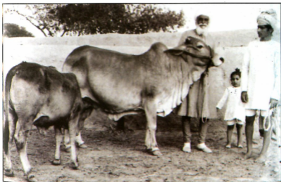
ਸ੍ਰੀ ਸਤਿਗੁਰੂ ਪ੍ਰਤਾਪ ਸਿੰਘ ਜੀ ਨੌਲੱਖੀ ਗਊ ਨਾਲ ।