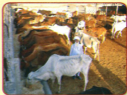
ਟਿੱਬਾ ਖੁਹ ਤੇ ਮੁਕਤਾ ਗਰੁੱਬਾਲਾ