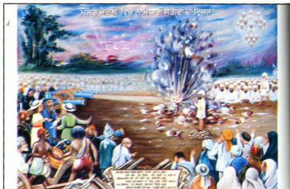
ਸ਼ਹੀਦੀ ਸਾਕਾ ਮਲੇਰ ਕੋਟਲਾ (17-18 ਜਨਵਰੀ ਸੰਨ 1872 ਈ.)