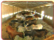
ਬੰਲ ਗਰੁੱਬਾਲਾ ਟਿੱਬਾ