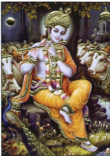
ਭਗਵਾਨ ਸ੍ਰੀ ਕ੍ਰਿਸ਼ਨ ਜੀ ਗਊਆਂ ਨਾਲ ।