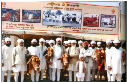
ਪੰਜਾਬ ਰਾਜ ਪਸ਼ੂ-ਧਨ ਚੈਂਪੀਅਨਸ਼ਿਪ-2009 ਈ. ਮੁਕਤਸਰ ਵਿਖੇ ਨਾਮਧਾਰੀ ਗਰੁੰਸ਼ਾਲਾ ਦੀਆਂ ਇਨਾਮ ਜੇਤੂ ਗਰੁੰਸ਼ਾਂ ਅਤੇ ਸਾਨ੍ਹਾਂ ਨਾਲ ਨਾਮਧਾਰੀ ਸਿੰਘ ।