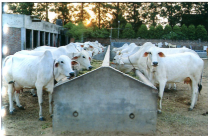
ਸ੍ਰੀ ਭੈਣੀ ਸਾਹਿਬ ਗਰੁੰਮਾਲਾ ਦੀਆਂ ਹਰਿਆਣਾ ਨਸਲ ਦੀਆਂ ਗਰੁੰਮਾਂ