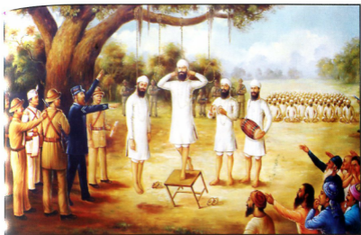
ਸ਼ਹੀਦੀ ਸਾਕਾ ਸ੍ਰੀ ਅੰਮ੍ਰਿਤਸਰ (15 ਸਿਤੰਬਰ ਸੰਨ 1871 ਈ:)