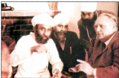
1967 ਈ: ਓਲਡਨ ਬਰਗ (ਜਰਮਨੀ) ਵਿਖੇ ਪਸ਼ੂ-ਪ੍ਰਦਰਸ਼ਨੀ ਸਮੇਂ ਸ੍ਰੀ ਸਤਿਗੁਰੂ ਜਗਜੀਤ ਸਿੰਘ ਜੀ