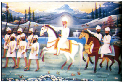
ਸ੍ਰੀ ਸਤਿਗੁਰੂ ਰਾਮ ਸਿੰਘ ਜੀ ਆਪਣੇ ਸਿੱਖਾਂ ਅਤੇ ਸੂਬੇ ਸਹਿਬਾਨ ਨਾਲ ਸੁਤੰਤਰਤਾ ਸੰਗਰਾਮ ਅਤੇ ਗਊਆਂ ਦੀ ਰੱਖਿਆ ਲਈ ਪ੍ਰਚਾਰ ਦੌਰੇ 'ਤੇ ਜਾਂਦੇ ਹੋਏ।