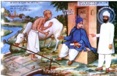
ਸ੍ਰੀ ਗੁਰੂ ਨਾਨਕ ਦੇਵ ਜੀ ਸੁਲਤਾਨਪੁਰ ਵੇਈ ਨਦੀ ਦੇ ਪੱਤਣ 'ਤੇ ਖੱਤ੍ਰੀ ਮਸੂਲੀਏ ਨੂੰ ਗਊ ਬ੍ਰਾਹਮਣ ਤੋਂ ਕਰ (ਚੁੰਗੀ) ਲੈਣ ਤੋਂ ਤਾੜਨਾ ਕਰਦੇ ਹੋਏ ।