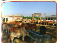
ਸ੍ਰੀ ਭੈਣੀ ਸਾਹਿਬ