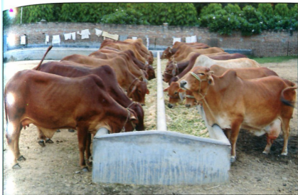
ਸ੍ਰੀ ਭੈਣੀ ਸਾਹਿਬ ਗਰੁੰਮਾਲਾ ਦੀਆਂ ਸਾਹੀਵਾਲ ਨਸਲ ਦੀਆਂ ਗਰੁੰਮਾਂ