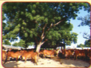
ਸ੍ਰੀ ਸੀਵਲ ਨਗਰ