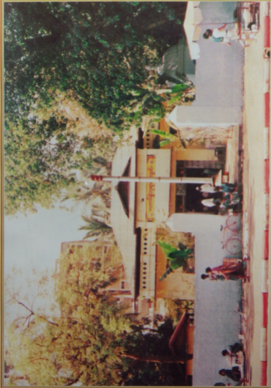
ਫੈਰੀ ਸਟਰੀਟ (ਰੰਗੂਨ) ਤੇ ਸਿਵ ਮੰਦਰ ਜਿਥੇ ਪੰਜਾਬ ਤੋਂ ਆ ਕੇ ਨਾਮਧਾਰੀ ਸਿੰਘ ਠਹਿਰਿਆ ਕਰਦੇ ਸਨ। ਸਤਿਗੁਰੂ ਬਿਲਾਸ ਕੀਥ ਵਿੱਚ ਇਸ ਮੰਦਰ ਨੂੰ 'ਠਾਕੁਰਦਾੜੀ' ਕਰਕੇ ਇੱਥਿਆ ਹੋਇਆ ਹੈ। ਇਹੀ ਸਫ਼ਰ ਅੱਗੇ ਜਾ ਕੇ ਸਤਿਗੁਰੂ ਰਾਮ ਸਿੰਘ ਜੀ ਦੇ ਬਰਾਲੇ ਦੇ ਅੱਗੇ ਦੀ ਜਾਈ ਸੀ।