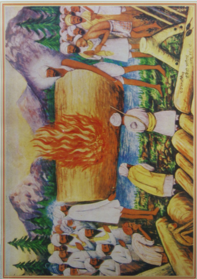
ਇਹ ਭਾਰ ਮੇਰੇ ਅਤੇ ਤੇਰੇ ਚੁੱਕਣ ਦਾ ਹੀ ਹੈ। ਪੱਥਰ ਚੁੱਕਣ ਵਾਲੇ ਦੇ ਭਵਿੱਖਤ ਬਚਨ ਸ੍ਰੀ ਸਤਿਗੁਰੂ ਰਾਮ ਸਿੰਘ ਜੀ ਨੇ ਹਰਿਦੁਆਰ ਅਠਾਰ੍ਹੀਥੀ ਮੇਲੇ ਸਮੇਂ ਗੰਗਾ ਕਿਨਾਰੇ ਭਾਰੀ ਗੋਲੀ ਚੁੱਕਦੇ ਹੋਏ ਆਪਣੇ ਛੋਟੇ ਭਾਈ ਖੁੱਧ ਸਿੰਘ ਨੂੰ ਕਹੇ ਸਨ ਕਿਉਂ ਨੇ ਸਤਿਗੁਰੂ ਜੀ ਦੇ ਬਦੇਸ ਜਾਣ ਉਪਰੰਤ ਸਤਿਗੁਰੂ ਹਰੀ ਸਿੰਘ ਜੀ ਦੇ ਨਾਂ ਨਾਲ ਨਾਮਾਧਾਰੀ ਪੱਥ ਦੀ ਚੁੱਕਣ ਵਾਲੀ ਸੰਭਾਲੀ।