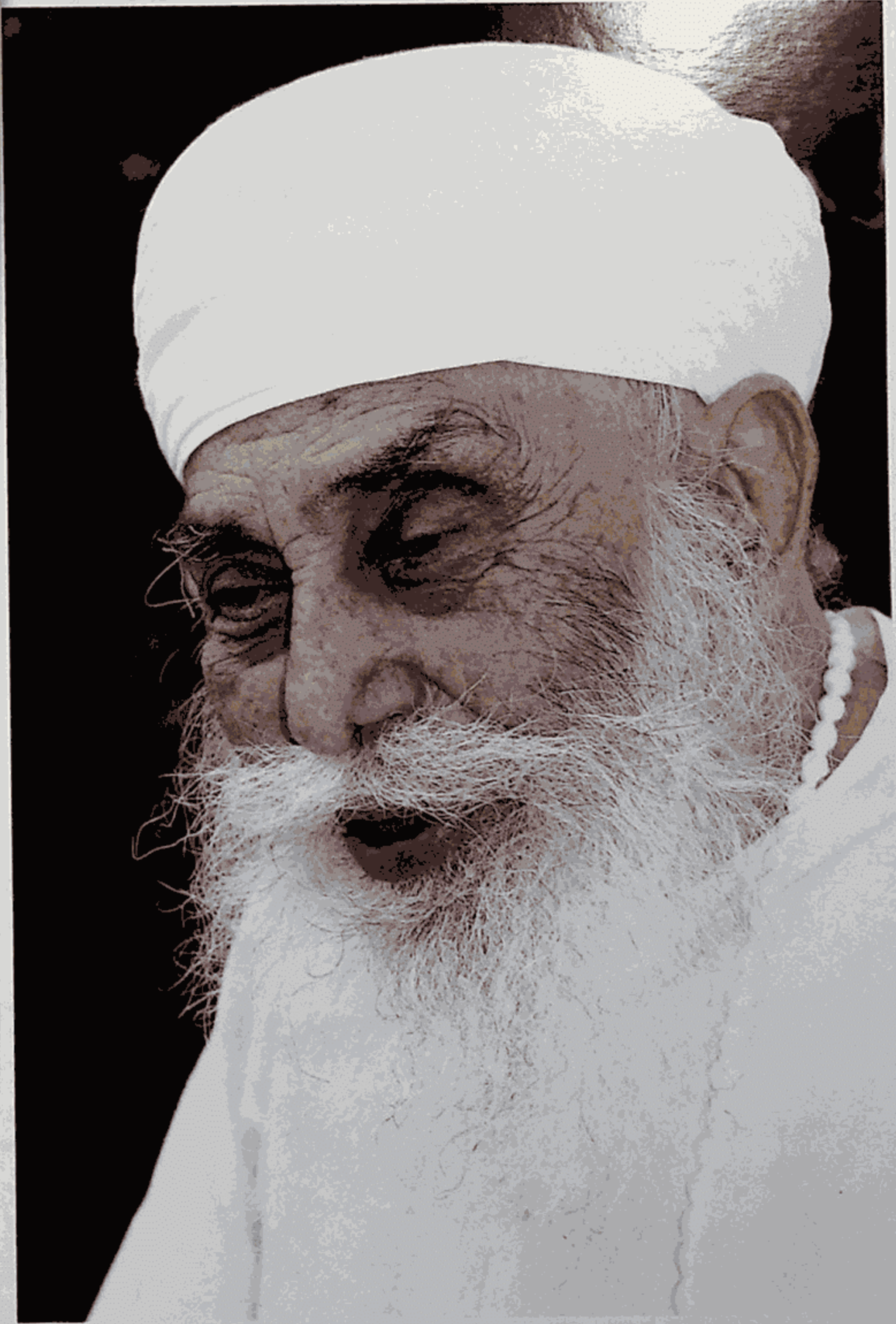
ਸ੍ਰੀ ਸਤਿਗੁਰੂ ਜਗਜੀਤ ਸਿੰਘ ਜੀ